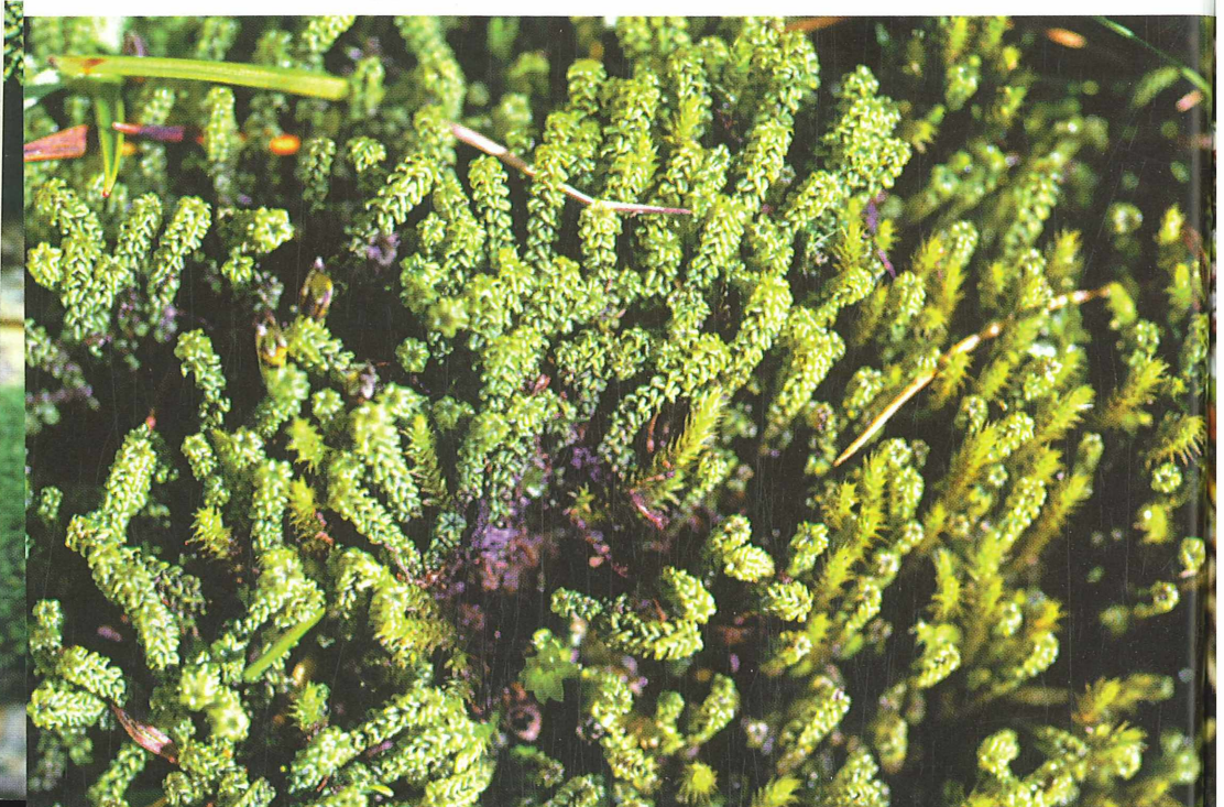
Foto 66: Paludella squarrosa , ein auffälliges Laubmoos der Niedermoore, durch die Zerstörung seines Lebensraums stark gefährdet