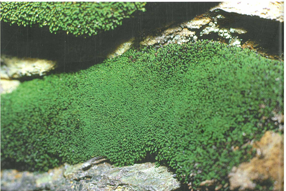
Foto 62: Mielichhoferia mielichhoferiana , ein Laubmoos kupferhaltiger Felsen, potentiell gefährdet