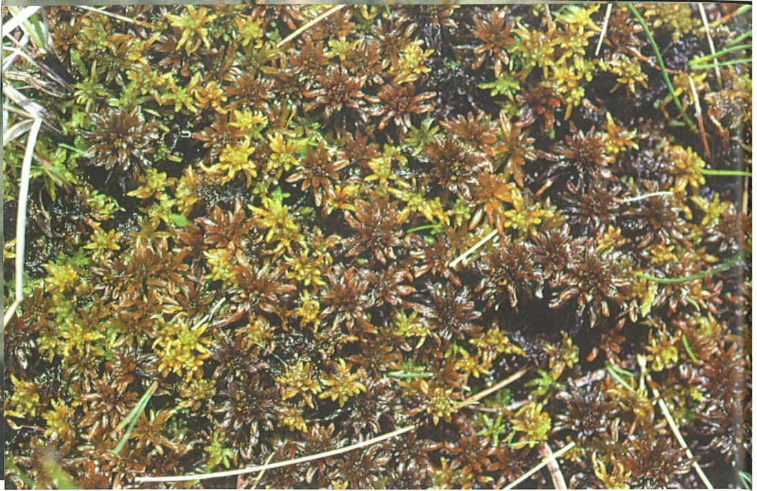
Foto 65: Sphagnum lindbergii hat als Eiszeitrelikt nur in einem einzigen Moor Österreichs überlebt, vom Aussterben bedroht (im Bild zusammen mit dem gelblichen S. subsecundum )