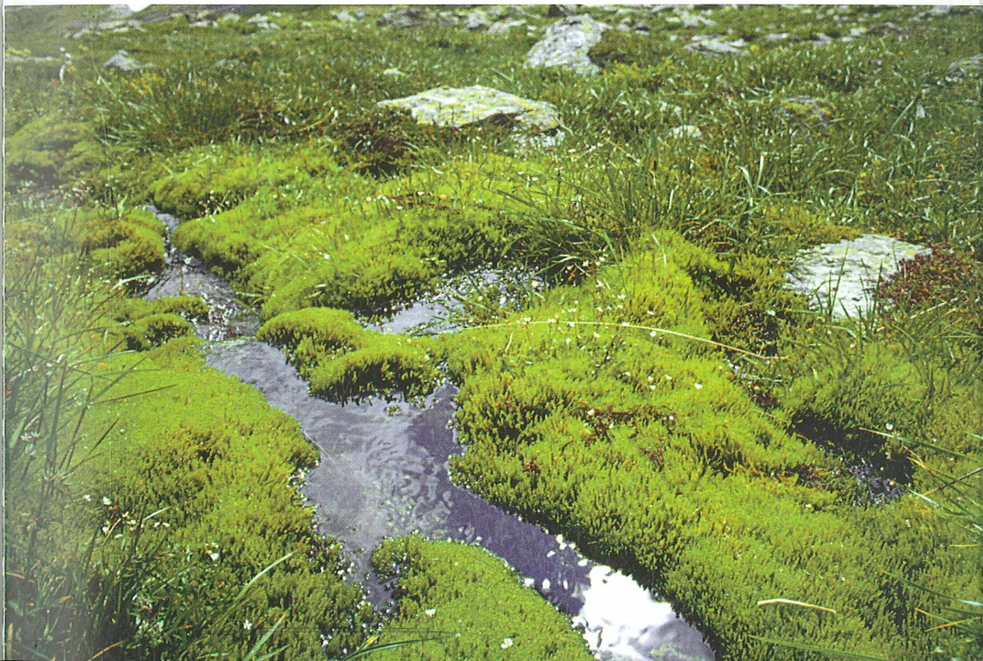
Foto 60: Subalpine und alpine Quellfluren werden von ausgedehnten Moosrasen besiedelt