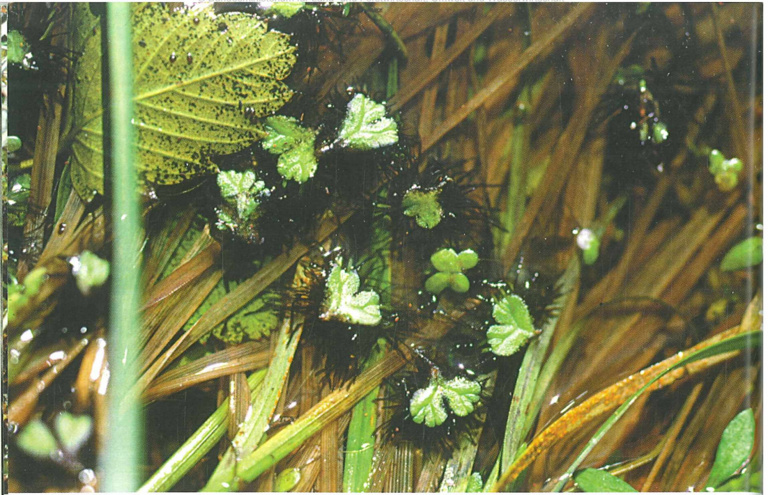
Foto 69: Ricciocarpos natans , schwimmendes Lebermoos in Teichen und Altarmen, stark gefährdet Foto 70: Hornmoose, heute bereits seltene Besiedler von Brachäckern: Anthoceros neesii (kurze, reife Sporophyten) ist vom Aussterben bedroht, A. agrestis (lange, unreife Sporophyten) stark gefährdet