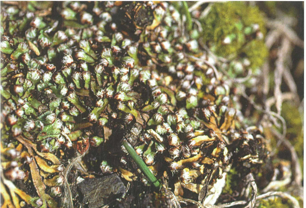
Foto 68: Mannia fragrans , ein xerophytisches Lebermoos in Felstrockenrasen, gefährdet