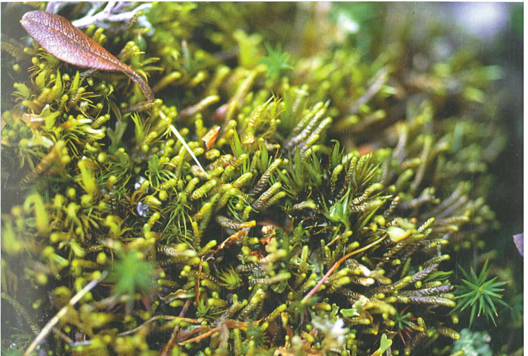
Foto 64: Herbertus sendtneri , ein Interglazialrelikt niederschlagsreicher Teile der Zentralalpen West-Österreichs, potentiell gefährdet