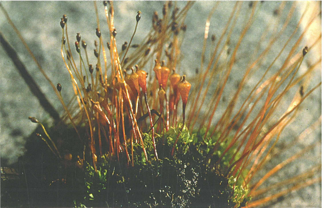
Foto 61: Splachnum ampullaceum (mit großen, hellen Kapseln), stark gefährdet, und S. sphaericum (mit kleinen dunklen Kapseln), beide auf Tierexkrementen in Mooren