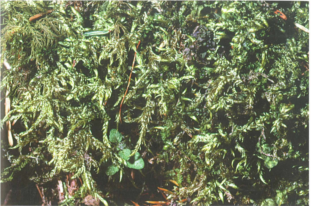
Foto 67: Brotherella lorentziana , Rarität in naturnahen Wäldern der Nordalpen und des Donaudurchbruchs SO Passau, gefährdet