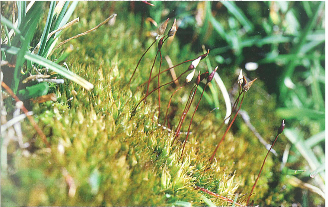
Foto 63: Voitia nivalis , ein berühmtes, kleistokarpes Hochalpenmoos, nur in den Hohen Tauern und sehr lokal in den Ötztaler Alpen, stark gefährdet