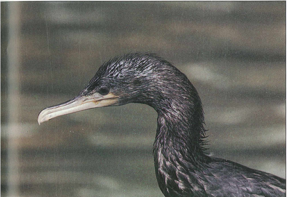
Foto 10: Kormoran ( Phalacrocorax carbo ), als Brutvogel ausgestorben