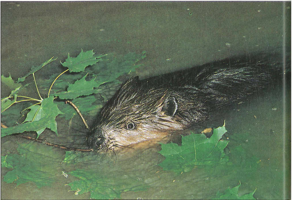
Foto 4: Biber ( Castor fiber ), Vorkommen nur durch ständiges Nachbesetzen gesichert