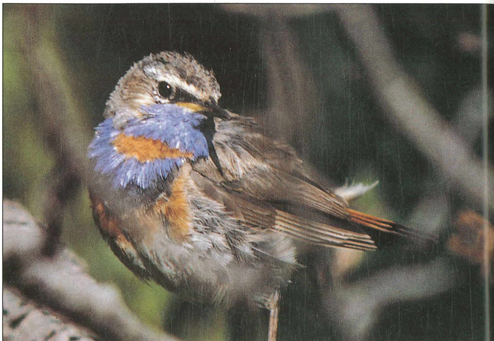
Foto 20: Rotsterniges Blaukehlchen ( Luscinia svecica svecica ), als Subspezies A.1