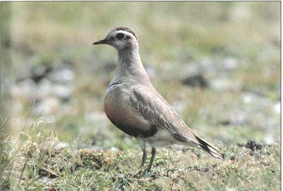
Foto 14: Mornellregenpfeifer ( Eudromias morinellus ), stark gefährdet