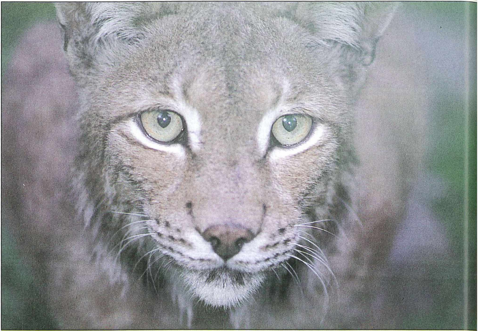
Foto 3: Luchs ( Lynx lynx ), Vorkommen nur durch ständiges Nachbesetzen gesichert