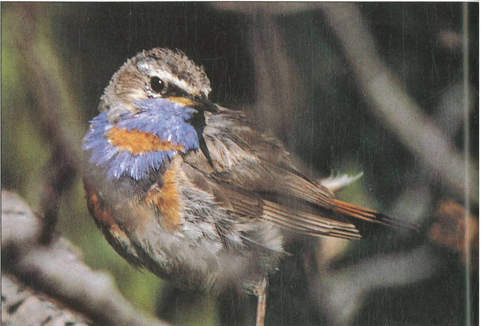
Foto 20: Rotsterniges Blaukehlchen ( Luscinia svecica svecica ), als Subspezies A.1