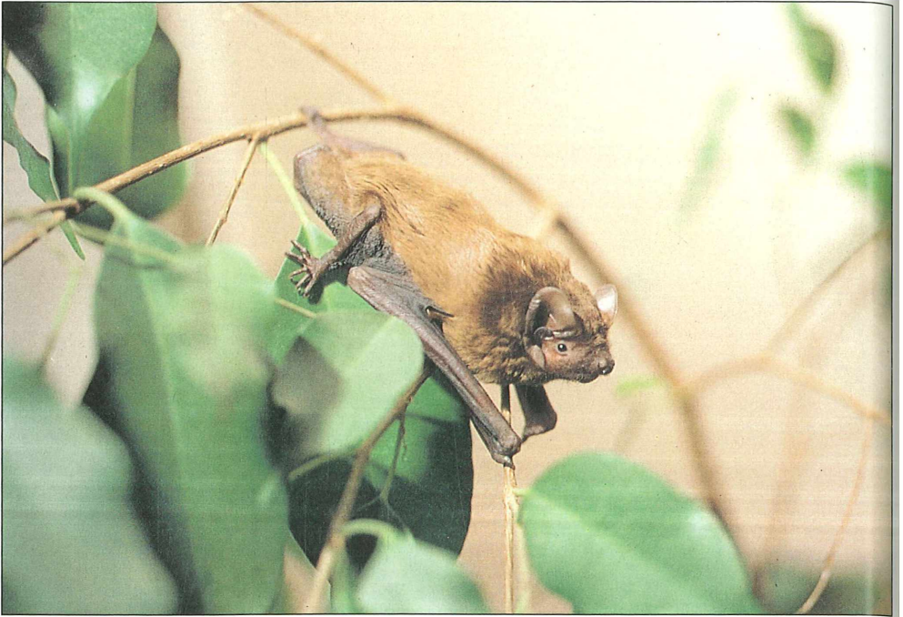
Foto 7: Abendsegler ( Nyctalus noctula ), gefährdeter Durchzügler, Überwinterer etc.