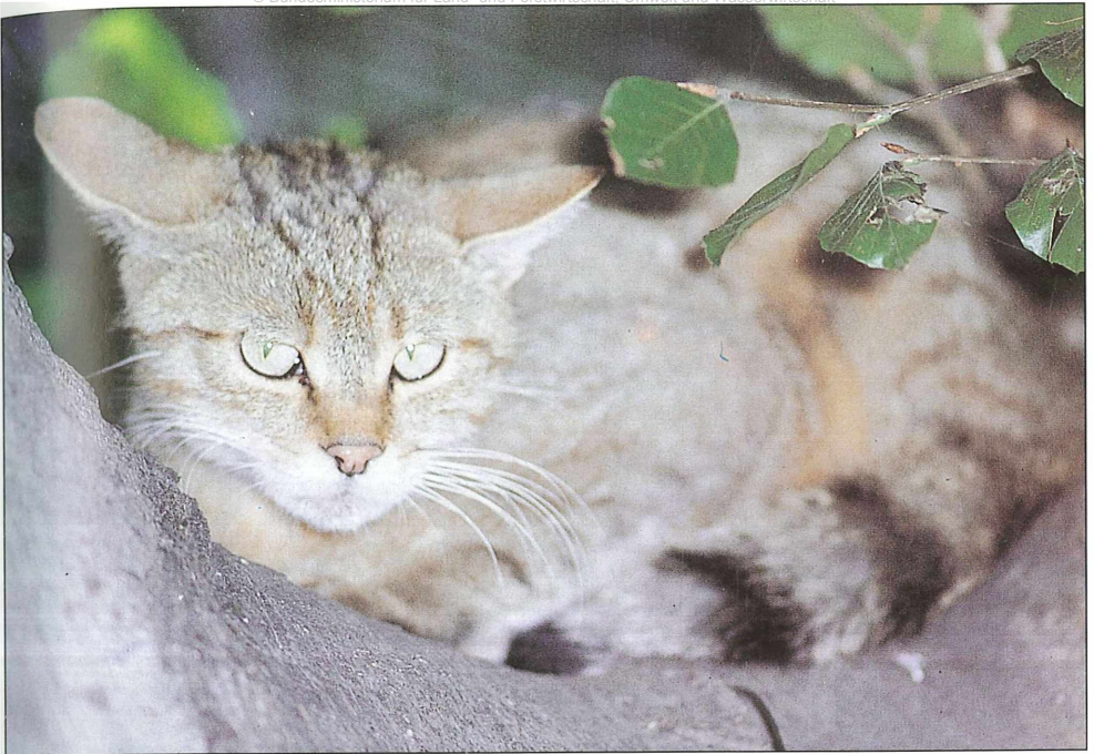
Foto 1: Wildkatze ( Felis silvestris ), ausgerottet bzw. verschollen