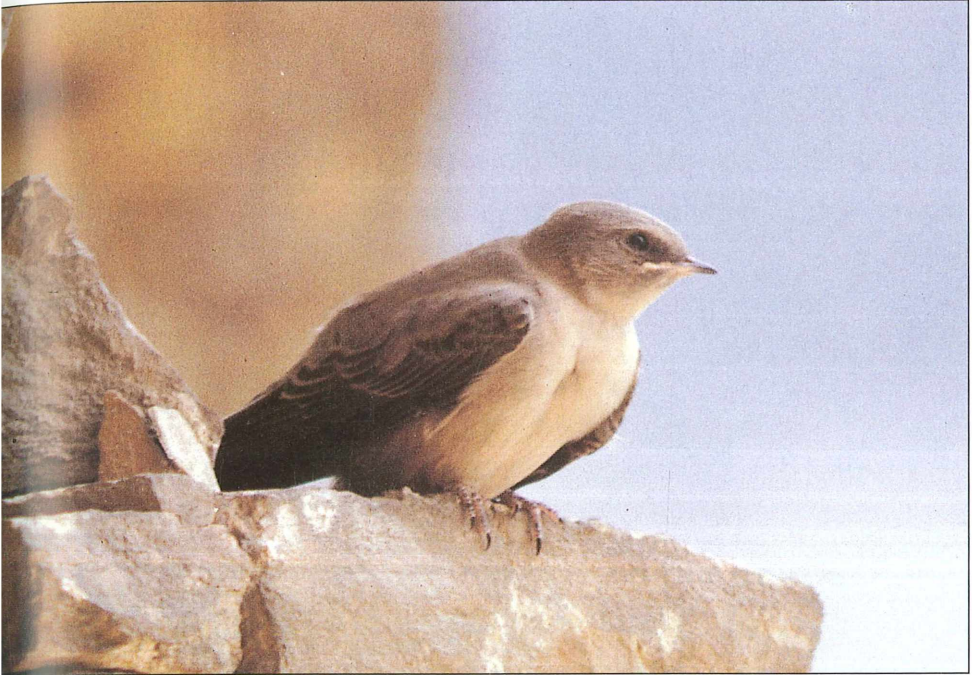
Foto 17: Felsenschwalbe ( Sterna hirundo ), vom Aussterben bedroht