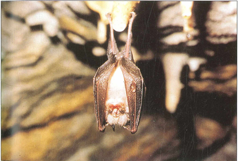
Foto 6: Kleine Hufeisennase ( Rhinolophus hipposideros ), gefährdet