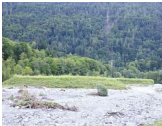
▲ Das Retentionsbecken nach dem Hochwasserereignis am 02.08.2013

nigen Stellen bereits zu einem starken Weidenanflug. Besonders erfreulich war aber die Entwicklung der Deutschen Tamarisken. Sowohl im ersten als auch im zweiten Teilbecken konnte eine ansehnliche Anzahl – geschätzt ein paar hundert – Jungpflanzen gefunden werden. Der verbliebene Altstrauch hatte 2013 stark geblüht und gefruchtet und schon ab Juni/ Juli gingen Samen auf, wobei bereichsweise nahezu rasenartige Bestände entstanden. Die ältesten der neuen Keimlinge waren schon relativ groß. Auch einige Sämlinge aus dem Vorjahr waren zu Jungsträuchern von bis zu 30 cm Höhe herangewachsen.