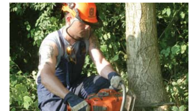
▲ Jetzt wirds ernst – ACHTUNG, Baum fällt, U.R.