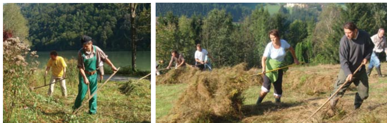
▲ Mit Sense und Rechen pflegt die Naturschutzgruppe Hainbach wertvolle Lebensräume in Oberösterreich, NG Hainbach.

Es ist immer schön, zu sehen, dass HALM sich nicht alleine mit schweißtreibender Arbeit für den Erhalt von wertvollen Lebensräumen einsetzt, sondern dass es auch Gleichgesinnte gibt.