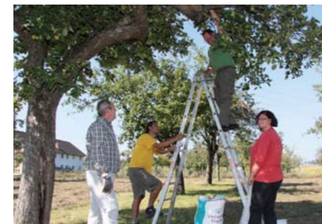
▲ Streuobstwiesen sind der Lebensraum des Steinkauzes.