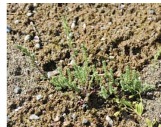
▲ Junge Keimlinge der Deutschen Tamariske am Fritzbach, G.N.