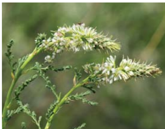
▲ Blühender Tamarisken-Zweig, G.N.