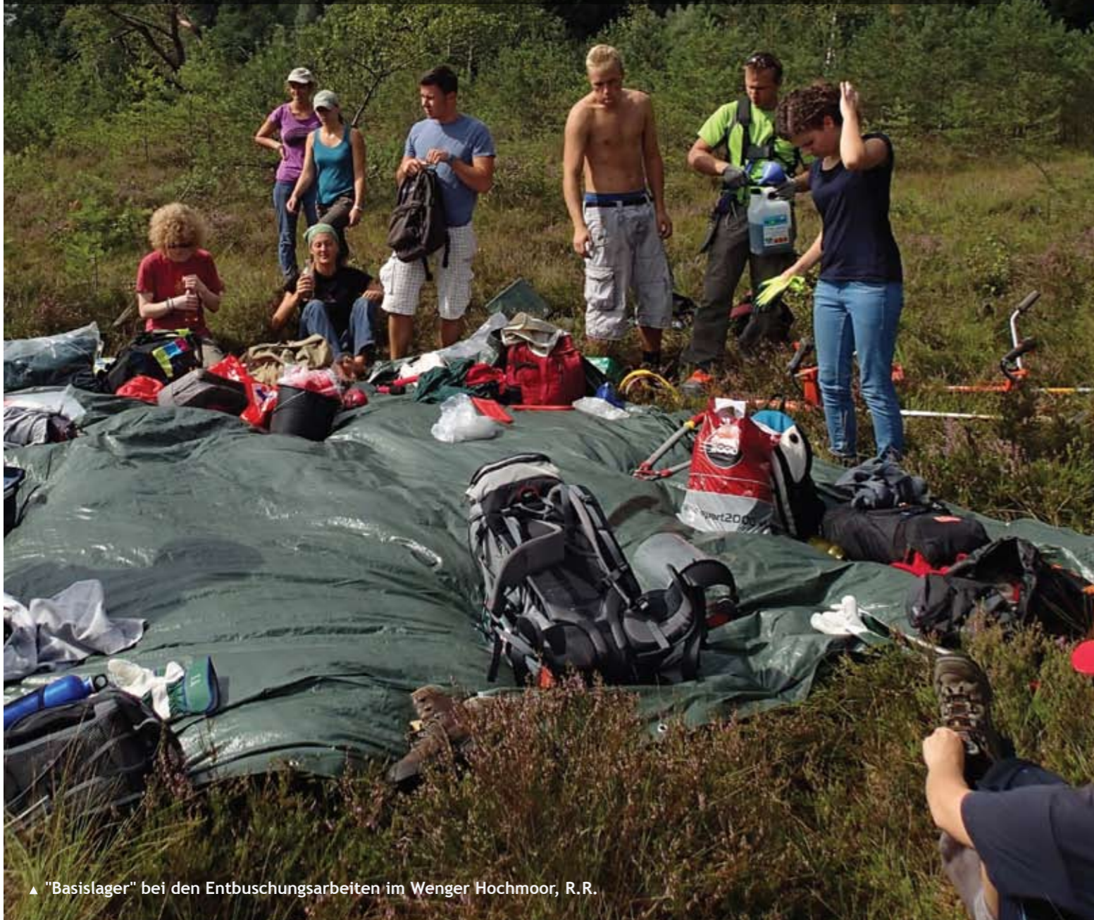
▲ "Basislager" bei den Entbuschungsarbeiten im Wenger Hochmoor, R.R.

MITTE AUGUST MACHTEN SICH EINIGE HALME MIT EINER GRUPPE VON EINSATZFREUDIGEN JUGENDLICHEN AUS DEUTSCHLAND, SLOWENIEN UND ÖSTERREICH AUF, IM HOCHMOORBEREICH DES WENGER MOORES BÄUME UND BÜSCHE ZU ENTFERNEN. VIEL SCHWEISS FLOSS IN DER WOCHE VOM 11. BIS 17. AUGUST 2013, ABER DIE ARBEIT HAT SICH GELOHNT. DURCH DIE DURCHFÜHRTEN PFLEGEMASSNAHMEN KONNTE DAS MOOR ALS LEBENSRAUM FÜR VIELE PFLANZEN- UND TIERARTEN AUFGEWERTET WERDEN, SOWIE DER UFERBEREICH DES NAHELIEGENDEN EISBACHS VOLLSTÄNDIG VOM DRÜSEN-SPRINGKRAUT BEFREIT WERDEN.