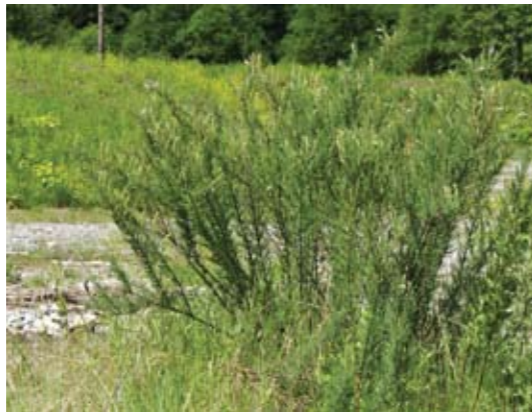
▲ Der große Tamarisken-Strauch in Blüte am 20.05.2013

Allerdings kamen die konkurrenzarmen Standortbedingungen auch unerwünschten Neophyten – insbesondere den Staudenknöterich-Arten ( Fallopia japonica und F. x bohemica ), die teilweise wieder in größeren Herden auftraten, – zugute. Am 2. August bekämpften daher fünf HALMe in einer Nachmittagsaktion die Neophyten durch Ausrupfen und Mahd, wobei auch die Dammböschungen gemäht wurden, um zumindest eine weitere Ausbreitung dieser Pflanzenarten hintanzuhalten. Eine Besichtigung am 20. Oktober ergab, dass die Maßnahmen bereichsweise durchaus erfolgreich waren. Wie ebenfalls nicht anders zu erwarten war, kam es an ei-