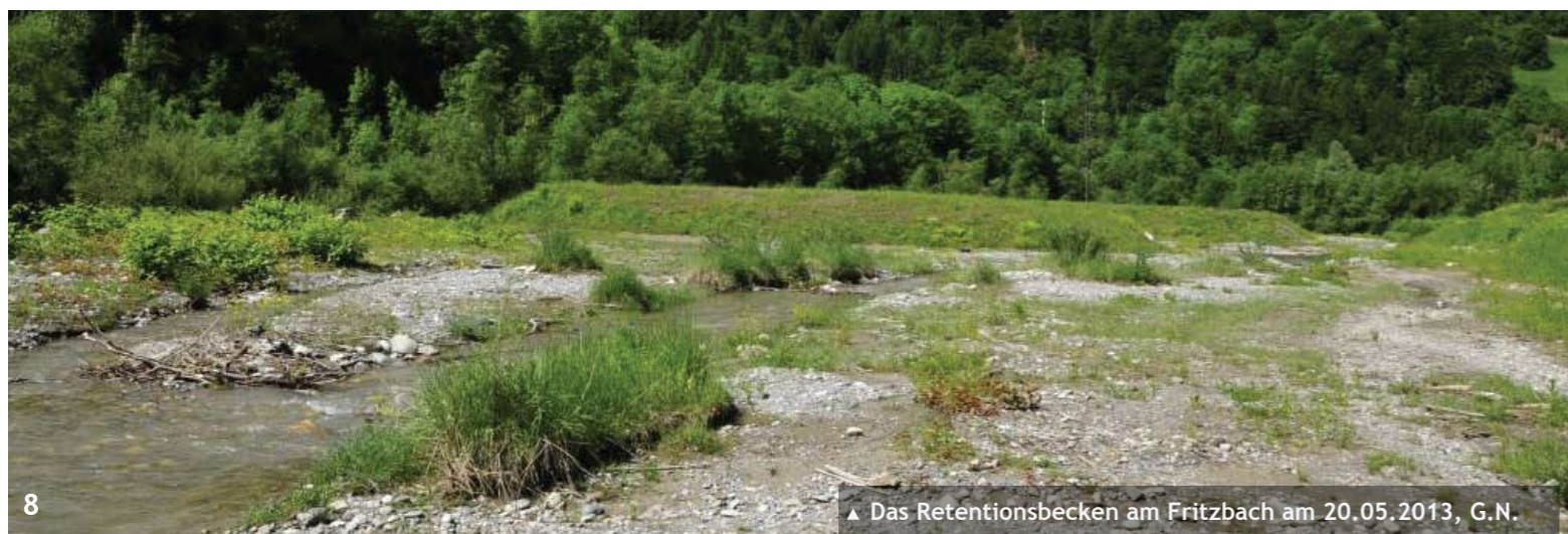
▲ Das Retentionsbecken am Fritzbach am 20.05.2013