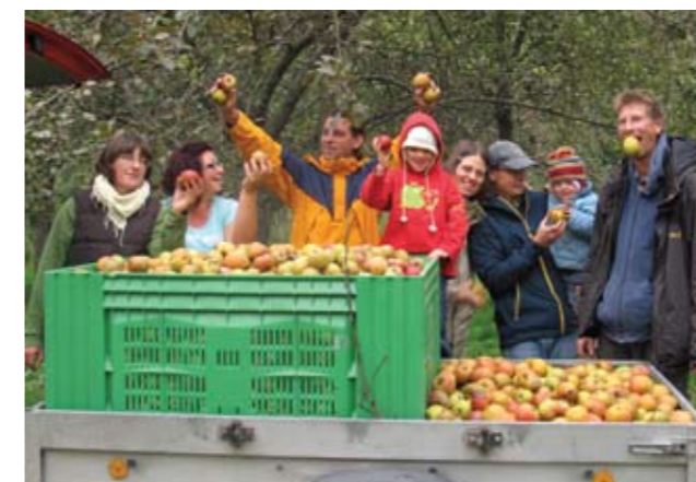
▲ Ernten von Obst aus dem Saft gepresst wird. U.R.