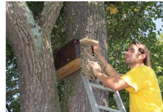
▲ Pflege der Nisthilfen für den Steinkauz. C.A.

Insgesamt sind seither rund 1.400 Hektar ökologisch wertvolle Waldflächen im Donautal und seinen Seitentälern langfristig geschützt (davon rund 1.100 ha Nutzungsverzicht, 300 ha Nutzungseinschränkungen)! Die vielfältigen Naturschutzaktivitäten der Naturschutzgruppe Haibach finden immer mehr landesweite Anerkennung. Mehrere Umwelt- und Naturschutzpreise, ein Wasser- schutzpreis und auch eine Ehrung seitens der OÖ. Landwirtschaftskammer bestätigen dies! Auf jeden Fall muss aber den vielen Grundeigentümern gedankt werden, die all diese Arbeiten ermöglichen und unterstützen.