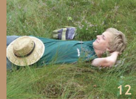
▲ Wiesenpflege – anstrengend, aber auch vergnüglich. C.A.