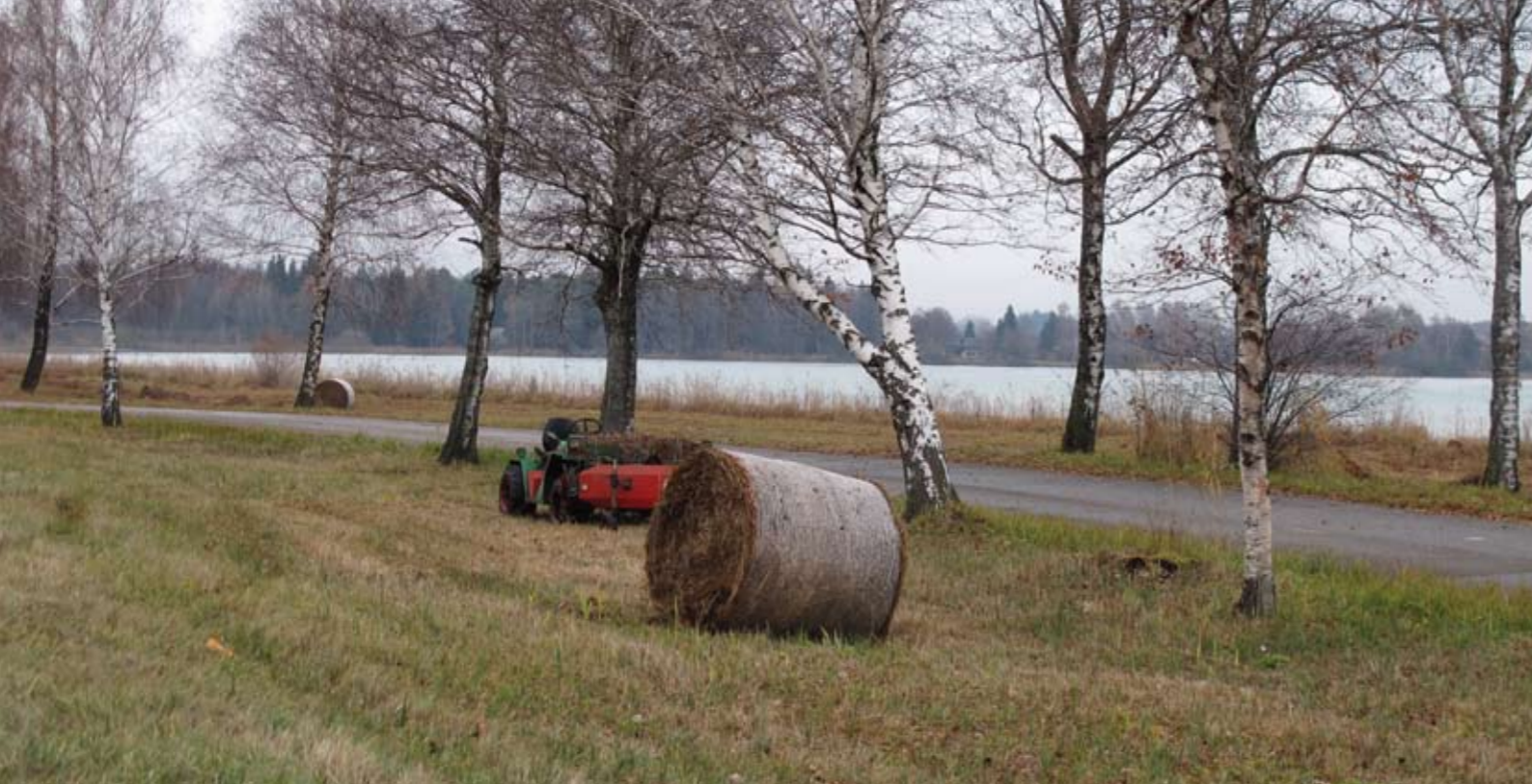
▲ Das Mähgut wird zu Ballen gepresst und abtransportiert, Ch.E.