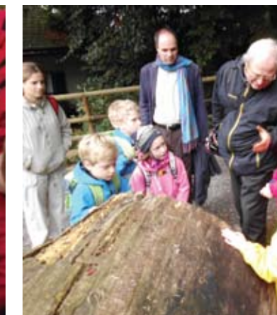
▲ Totholz steckt voller Leben (Kapuzinerberg), E.T.