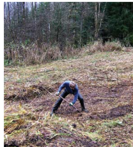
▲ Anlegen weiterer Probeflächen im November, B.S.