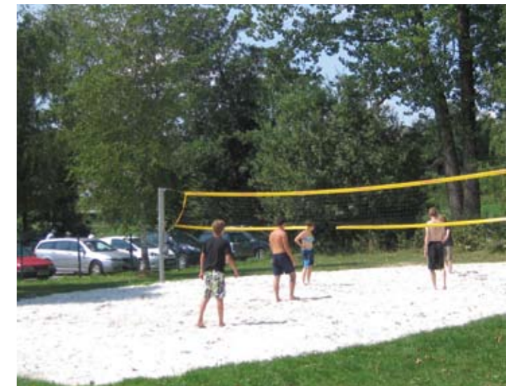
▲ Volleyballspiel am freien Nachmittag, B.L.

In dieser ereignisreichen Woche wurde insgesamt 324,5 Stunden gearbeitet. Mittels eines durchdachten Freizeitprogramms wurde dafür gesorgt, dass die TeilnehmerInnen neben der Arbeit auch Spaß und Erholung erfuhren. So wurde ein wundervoller Badetag am Wallersee verbracht, an dem die fleißigen ArbeiterInnen wieder neue Kraft tankten. Bei einer abendlichen Wanderung auf den Gaisberg konnten die TeilnehmerInnen Salzburg bei Nacht bestaunen und der anschließende Abstieg mit Fackeln war ein schöner Ausklang des freien Tages. Krönender Abschluss für die ganze Gruppe war eine Führung der Schutzgebietsbetreuerin Elisabeth Ortner durch das Wenger Moor entlang artenreicher Streuwiesen. Die Umweltbaustelle war ein voller Erfolg