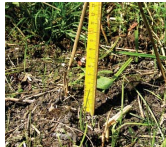
▲ Iris-Sämlinge Anfang September, B.S.

variablen Umwelt anpassen können. Ob dies langfristig eine erfolgreichere Variante darstellt als das Ausbringen von aufgezogenen Pflanzen, wird ein entsprechendes Iris-Monitoring zeigen. Um aussagekräftige Ergebnisse zu erhalten, wurden im November 2013 auf der Prähauserbauerwiese auf einer Fläche von ca. 30 m 2 weitere zehn Probeflächen angelegt und besät. Es hatte sich bereits in Vorversuchen gezeigt, dass eine Aussaat im Spätherbst – dem natürlichen Rhythmus der Sibirien-Schwertlilie entsprechend – zu besserem Wachstum führt als eine Aussaat erst im darauffolgenden Frühjahr. Parallel zu den Freilandaussaaten laufen zum Vergleich entsprechende Nachzucht-Experimenten im Botanischen Garten der Universität Salzburg und auf dem Balkon des Verfassers.