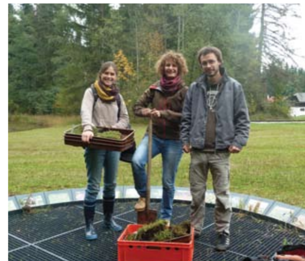
▲ HALMe auf der Schau!Streuwiese, E.O.

Im Auftrag der Naturschutzabteilung der Salzburger Landesregierung (Dipl.-Ing. Bernhard Riehl) wurden von HALM in Kooperation mit dem Botanischen Garten der Universität Salzburg ausgewählte Streuwiesenpflanzen für die Schau!Streuwiese im Freilichtmuseum Größmain nachgezogen. Im Spätherbst 2012 wurden die Samen angesät, danach wurden die Keimlinge pikiert und schließlich getopft. Der erste Teil der Nachzucht war im Herbst 2013 so gut entwickelt, dass er auf der Schau!Streuwiese ausgebracht werden konnte. Wir hoffen, dass sich die Pflanzen in der Schau!Streuwiese gut weiterentwickeln. E.O.