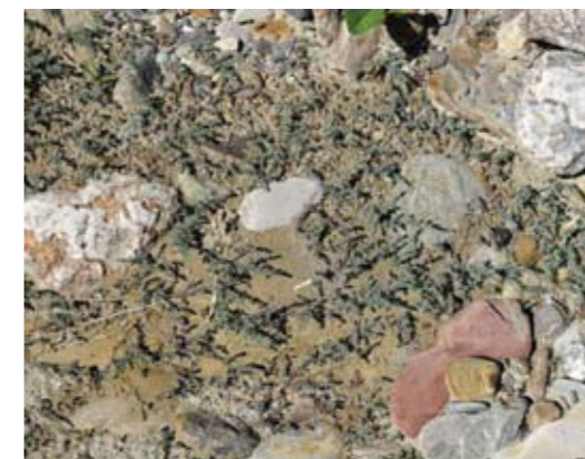
▲ Rasenartiger Bestand von Keimlingen der Deutschen Tamariske, G.N.