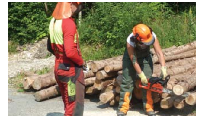
▲ Trockenübung am Holzplatz, U.R.