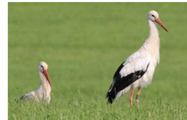
▲ Die Störche nahe beim SOS-Kinderdorf, C.A.

Im Mai 2012 wurden mehrere Weißstörche in den Wiesen nahe dem Kinderdorf Seekirchen gesichtet. Weil sie sich dort bis in den Juli hinein aufhielten und es sich wahrscheinlich um junge Störche handelte, wurde der Versuch beschlossen, den Störchen durch eine geeignete Nisthilfe einen dauerhaften Brutplatz in der Region anzubieten. Im Frühjahr 2013 kehrten die Störche wieder zurück und wurden öfters in den umliegenden Wiesen bei der Nahrungssuche beobachtet. Uwe Rodewald montierte im Mai 2013 einen aus Ungarn stammenden Weidenkorb auf dem Kamin eines der Kinderdorf-Häuser. Mit weißer Farbe wurden Flecken aufgemalt, die den Eindruck erwecken, dass die Nisthilfe schon einmal benutzt wurde. Dies soll – wie aus der Literatur bekannt – die Annahme der Nisthilfe erhöhen. Vielleicht hat zumindest einer der Störche die Nisthilfe bereits 2013 gesehen und kann sie 2014 ausprobieren! Nach Angaben BirdLife Österreich wurden 2013 in Österreich 361 Weißstorch-Brutpaare gezählt. Davon brüteten 125 im Burgenland, 102 in Niederösterreich und 93 in der Steiermark. Der Rest teilt sich auf Oberösterreich, Kärnten und Vorarlberg auf. Auch in Salzburg (St. Georgen) siedelte sich nach längerer Zeit wieder ein Paar an.