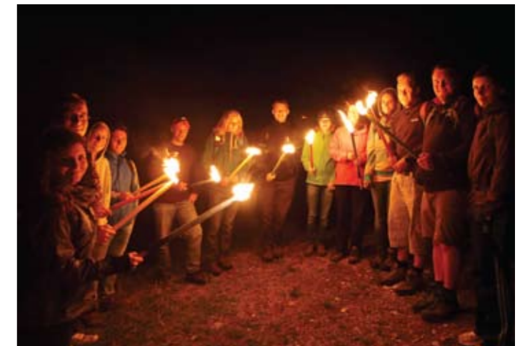
▲ Wanderung auf den Gaisberg, B.L.

sowohl auf Naturschutz- und Bildungsebene als auch im zwischenmenschlichen Bereich. Die Zusammenarbeit der Teilnehmer_innen (die jüngste war 16 und die älteste 27 Jahre) funktionierte einwandfrei und alle waren sehr motiviert und begeistert bei der Arbeit.