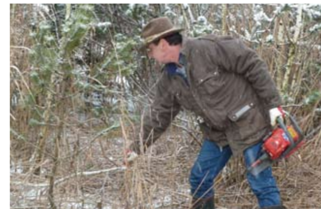
▲ Winterliche Holzarbeiten im Weidmoos. E.O.

Das Weidmoos ist eines der bedeutendsten Vogel-schutzgebiete in Salzburg. Um seine Artenvielfalt zu erhalten, bedarf es regelmäßiger Pflegemaßnahmen. Neben der herbstlichen Streuwiesenmähd müssen Sträucher und einzelne Bäume zurückgeschnitten werden. Diese Arbeiten werden vom Torferneuerungsverein Weidmoos durchgeführt. Im Jänner 2013 hat eine Gruppe von HALMen dem Verein einen Besuch abgestattet und sie bei den Pflegearbeiten im Weidmoos unterstützt. Als Belohnung gab es eine gemütliche Jause in der Inföhütte Weidmoos. E. O.