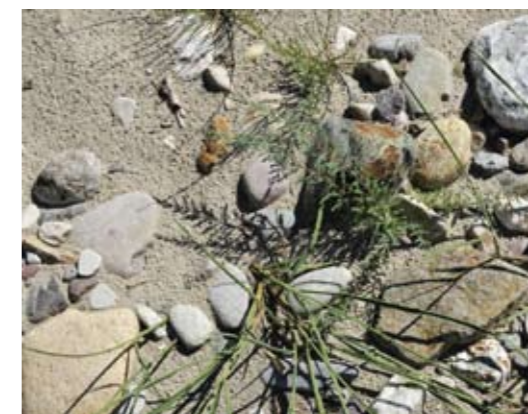
▲ Kräftig entwickelte Jungpflanze der Deutschen Tamariske, G.N.

größtenteils ein neues Bett gesucht und dieses natürlich ausgeformt. Die angeschwemmten Wurzelstöcke und das sonstige Schwemmholz sorgten für einen hohen Strukturreichtum. Durch rasche Kontaktaufnahme mit der Salzburg AG konnte