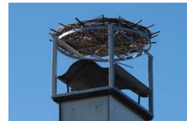
▲ Storch-Nisthilfe im SOS-Kinderdorf, I.E.