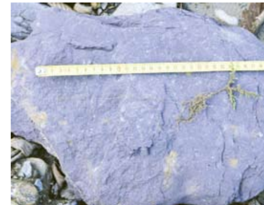
▲ Keimling mit über 20 cm langer Wurzel, G.N.

Da bei dieser Begehung einige Jungpflanzen im Baustellenbereich entdeckt wurden, führten Georg Pflugbeil und Günther Nowotny am 8. November eine Bergungsaktion durch. Dabei wurden 64 im Jahr 2013 aus Samen aufgegangene Pflänzchen mit Wurzellängen zwischen 5 cm und 25 cm ausgegraben und im dritten Teilbecken in Gruppen relativ nahe zum Fritzbach ausgepflanzt. Dort konnten überraschenderweise zudem drei natürlich angeflogene Jungpflanzen nachgewiesen werden. Zuvor waren keine Deutschen Tamarisken in diesem Teilbecken bekannt. Auch ein etwa zwei bis drei Jahre altes, durch das