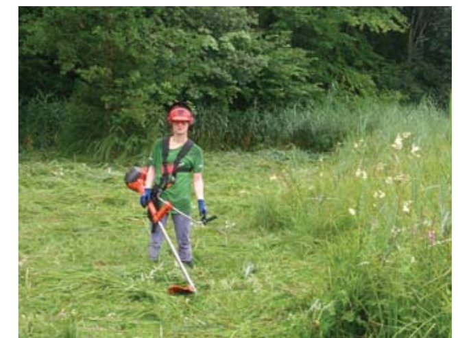
▲ A gmade Wiesn ... und a Haufn Neophyten.

nächtlichen Kartenspielen direkt in eine Sonnenaufgangswanderung am Trattberg über. Nach der Endreinigung der Unterkunft freuten wir uns über ein sehr positives Feedback und die Ankündigungen einiger TeilnehmerInnen, an der Umweltbaustelle im Jahr 2018 mit anpacken zu wollen.