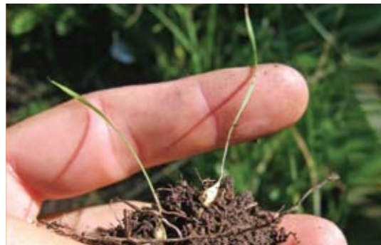
▲ Einjährige Jungpflanzen. B.S.