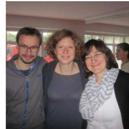
▲ Bei der Klausur im Spätwinter. M.Lo.

Wer viel arbeitet, muss es sich bei der einen oder anderen Gelegenheit auch einmal gut gehen lassen. Das beherrschen die HALMe schon seit jeher recht gut. Ob beim der HALM-Klausur im Spätwinter, beim Sommerfest oder zur Weihnachtsfeier, die Gemütlichkeit bei gutem Essen darf nicht zu kurz kommen. Aber auch bei der Arbeit im Gelände bietet die traditionell grandiose HALM-Jause Gelegenheit zum Plaudern und Regenerieren.