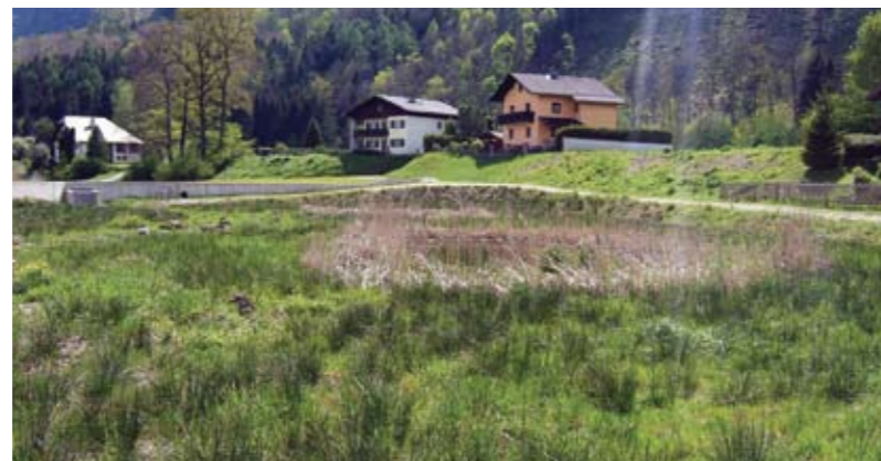
▲ Durch die Arbeit von HALM blüht nun die Mehl-Primel auf der ▲ Schilfwiese in Taxach. G.N.