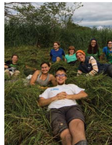
▲ Pause bei der Umweltbaustelle.

• Bankverbindung: • Biotopschutzgruppe HALM • IBAN: AT35 6000 0501 1010 7177 • BIC: BAWAATWW