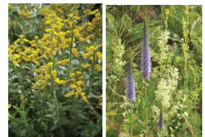
▲ Die Karthäuser-Nelke wächst in der lückigen Vegetation auf der Felsensteppe am Rainberg. T.S. ▲ Färber-Ginster ins Vollblüte. T.S. ▲ Der Orchideen-Blauweiderich im Halbtrockenrasen in Pfarrwerfen. G.N.

terial, welches ja nach dem Absterben zu Humus abgebaut werden würde, wieder aus dem Halbtrockenrasen entfernt werden. Unsere Arbeit lohnt sich: Am Rainberg kommen die in Salzburg stark gefährdeten Arten Hügel-Meier ( Asperula cynanchia ), Färber-Ginster ( Genista tinctoria ), Aufrecht-Ziest ( Stachys recta ) und Groß-Ehrenpreis ( Veronica teucrium ) vor. Der Orchideen-Blauweiderich ( Veronica orchidea ) in Pfarrwerfen stellt eine große Besonderheit in Salzburg dar, ad er hier sein einziges Vorkommen im Bundesland besitzt. Magerstandorte, zu denen die Halbtrocken- und Trockenrasen sowie die Feuchtwiesen gehören, sind laut Salzburger Naturschutzgesetz (§ 24 (1)d) ab einer Fläche von 2000 m 2 geschützt.