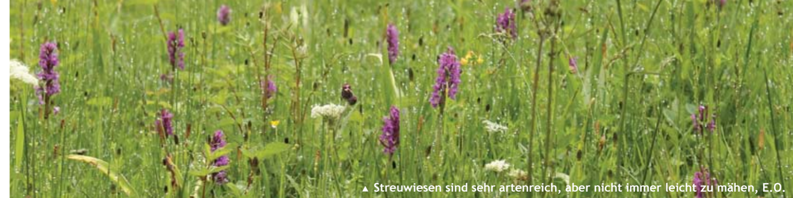
▲ Streuwiesen sind sehr artenreich, aber nicht immer leicht zu mähen, E.O.

HALM achtet besonders auf eine für Tiere schonende Mahdtechnik. Alle Projektflächen werden mit einem Doppelmesser-Mähbalken gemäht, das Mähgut wird also abgeschnitten. Es kommen keine Rotationsmähergeräte (Scheibenmäher, Mulchmäher) zum Einsatz, mit welchen das Mähgut abgeschlagen wird und wodurch besonders viele Insekten wie Heuschrecken, Honigbienen oder Schmetterlinge, aber auch Spinnen oder Amphibien verletzt bzw. getötet werden.