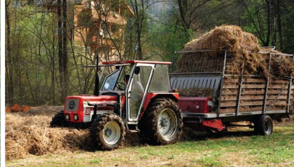
▲ Abtransport der Streu auf der Prähauserbauerwiese. G.N.