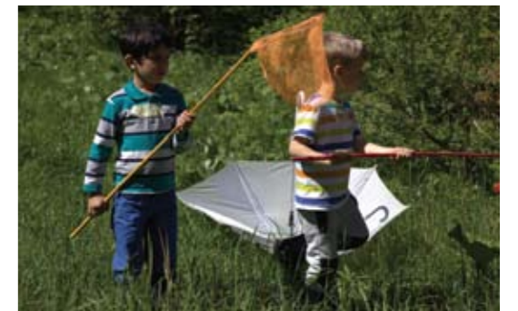
▲ Auf der Jagd nach Schmetterlingen. M.E.