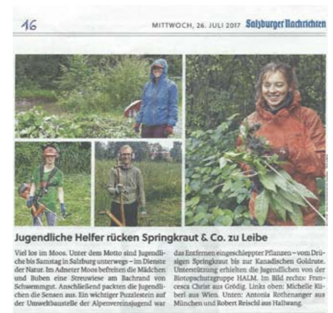
▲ Bericht in den Salzburger Nachrichten

Im Laufe der Woche schweißten uns die Arbeit, die gute Laune und die eine oder andere Herausforderung zusammen. Somit war es kein Wunder, dass der Abschied schwer fiel. Deshalb wurde der letzte Abend nicht mit Schlaf verschwendet, sondern ging von