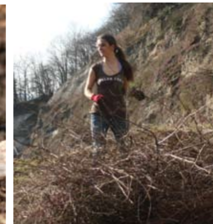
▲ Asthaufen am Rainberg. F.S.