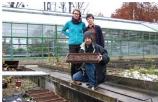
▲ Nachzucht im Botanischen Garten. B.S.

Um den Bestand der Sumpf-Siegwurz auf der Illinger-Streuwiese zu stärken, werden drei Maßnahmenswerpunkte gesetzt. Der erste Schwerpunkt beinhaltet Maßnahmen zur Habitatverbesserung. So wurde beispielsweise ein verwachsender und verlandeter Entwässerungsgraben, der in den vergangenen Jahren eine zunehmende Vernässung im Nordteil der Wiese verursachte, 2016 händisch reaktiviert, was in eine wahre Schlammschlacht ausartete. Versumpfte und verschilfte Randbereiche der Wiese, die aufgrund der schwierigen Gelände- verhältnisse im Zuge der maschinellen Streuwiesenmähd bislang ausgespart worden waren, wurden in den letzten beiden Jahren mit der Handsense gemäht. 2017 erfolgte eine händische Bekämpfung (durch Ausreißen) der nicht heimischen Riesen-Goldrute ( Solidago gigantea ), die im Zentralbereich der Wiese eine gewisse Ausbreitungstendenz zeigt. Die Nachzucht der Sumpf-Siegwurz im Botanischen Garten der Uni-