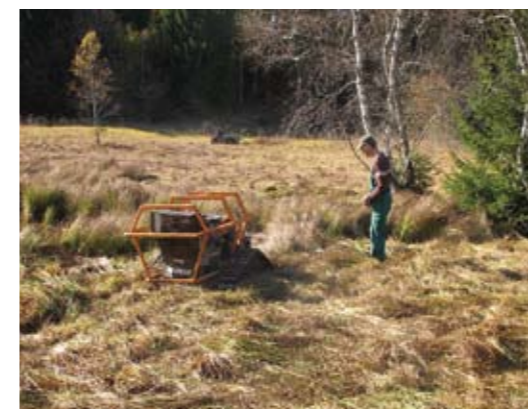
▲ Mahd des Niedermoors in Koppl. Ch.E.