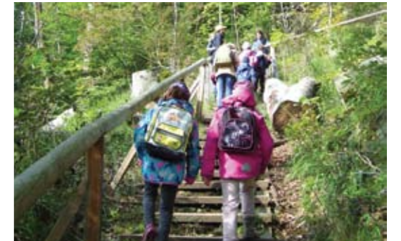
▲ Wanderung auf den Kapuzinerberg.