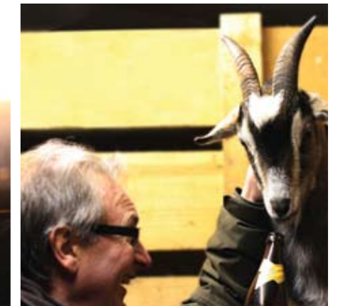
▲ Günther und der Bock. F.S.