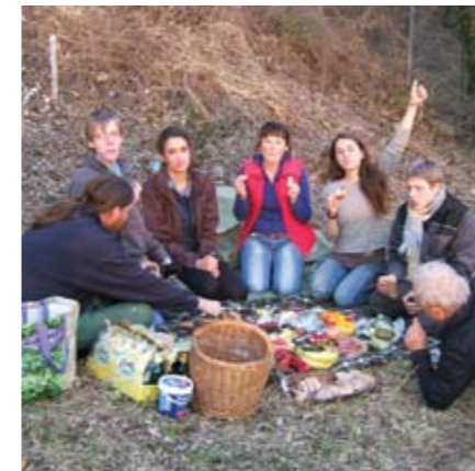
▲ Traditionelle HALM-Jause. B.S.