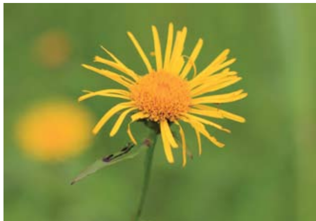
▲ Eine leicht verbuschte Streuwiese in Thalgau. S.P.-K. ▲ Der vom Aussterben bedrohte Weiden-Alant ( Inula salicina ). C.W.

Wir HALMe mähen jeden Herbst händisch zwei Streuwiesen: die Prähauserbauerwiese in Fürstenbrunn und die Randersbergwiese in Großgmain. Doch warum dürfen diese Wiesen erst ab September gemäht werden und was macht sie so besonders?