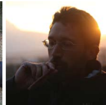
▲ Nach getaner Arbeit am Reinberg. F.S.