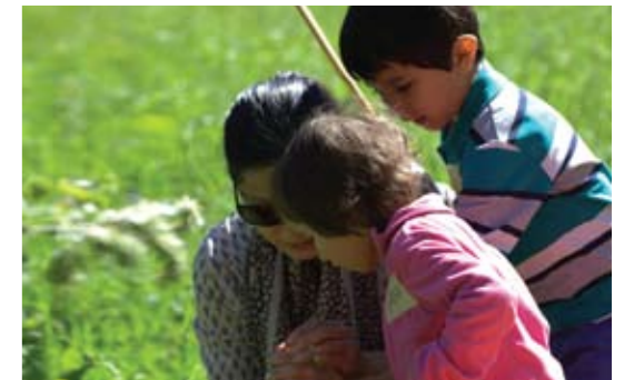
▲ Was für ein Tier ist das wohl? M.E.