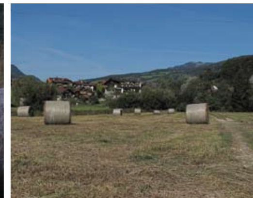
▲ Ballen mit tockener Streu. Ch.E.