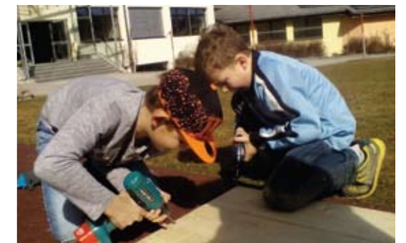
▲ Beim Bauen von Fledermauskästen. M.W.