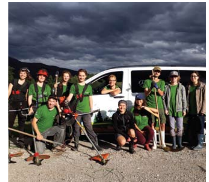
▲ Gewitterstimmung in Adnet, G.N.

nächtlichen Kartenspielen direkt in eine Sonnenaufgangswanderung am Trattberg über. Nach der Endreinigung der Unterkunft freuten wir uns über ein sehr positives Feedback und die Ankündigungen einiger TeilnehmerInnen, an der Umweltbaustelle im Jahr 2018 mit anpacken zu wollen.