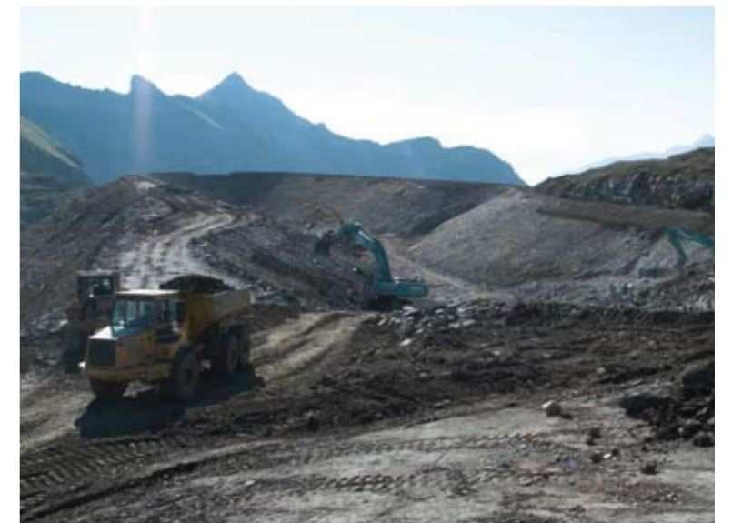
▲ Gravierende Eingriffe in die Natur verursachen massiven Aufwand bei der Renaturierung. Die Möglichkeit zu Renaturierungsmaßnahmen darf nie als Rechtfertigung für Eingriffe gelten! A.B.

unigen und in eine gewünschte Richtung zu lenken. Nach Möglichkeit sollen sich damit Arten aus einem regionalen Artenpool (wieder) etablieren und so zur Entwicklung der gewünschten Zielgemeinschaft und zu den damit verbundenen Prozessen führen. Allgemein wird ein Ökosystem als wiederhergestellt bezeichnet, wenn genügend abiotische und biotische Ressourcen für eine weitere selbständige Entwicklung ohne zusätzliche Eingriffe zur Verfügung stehen. Dies beinhaltet auch eine gewisse Widerstandsfähigkeit gegenüber äußeren Einflüssen bzw. Stress und Wechselbeziehungen mit umliegenden Lebensräumen. Im Kontext einer Kulturlandschaft ist eine Nutzung jedoch als ein Teil dieser Ressourcen zu sehen. Ohne die meist traditionelle, extensive Nutzung ist ein Erhalt von derartigen „halb-natürlichen“ Lebensräumen vielfach nicht möglich. Der Übergang von reinen Pflege- bzw. Erhaltungsmaßnahmen hin zu „klassischen“ Renaturierungsmaßnahmen ist fließend und entspricht letztendlich auch der Intensität der erfolgten Eingriffe – auch hier zeigt sich, dass Vermeidung bzw. Vorbeugung gegen einen späteren, ungleich höheren und mühsamen Einsatz hilft, zum Wohle unserer Natur. Dies ist ein wichtiger Ansatzpunkt und eine der Grundlagen der Arbeit von HALM, was sich speziell bei der äußerst erfolgreichen Renaturierung der unterschiedlichen Streuwiesen zeigt.