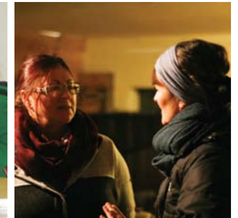
▲ Weihnachtsfeier am Maxlgut. F.S.