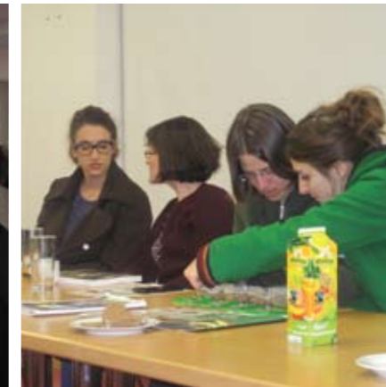
▲ Konzentrierte Jahresplanung. M.Lo.