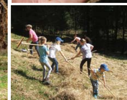
Springfrosch; Rechenarbeiten mit HALMini. B.S. ▲▲