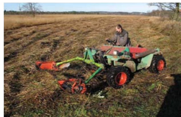
▲ Gebirgstraktor Rasant im Ibmer Moos. Ch.E.