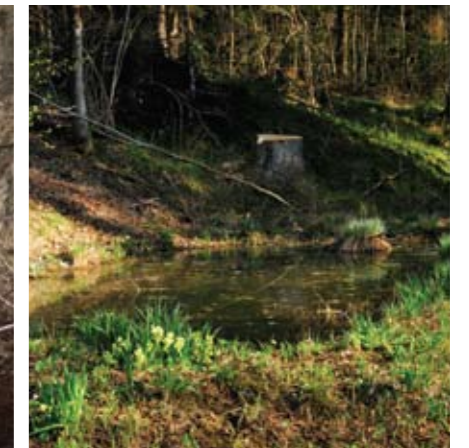
▲ Teich auf der Prähauserbauernwiese. G.N.