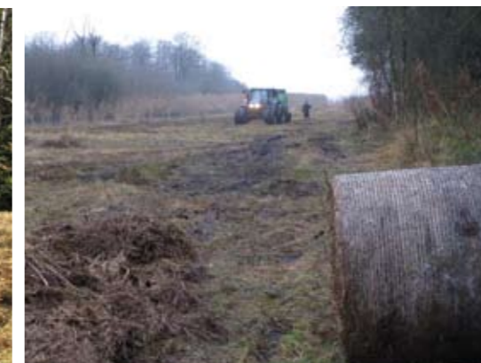
▲ Schwieriger Einsatz am Obertrumsee. Ch.E.