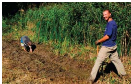
▲ Händische Reaktivierung eines Entwässerungsgrabens. G.N.

versität Salzburg, der zweite Maßnahmenswerpunkt, bereitete bislang keine größeren Probleme und der Erfolg kann sich sehen lassen: 2017 wurden über 1000 einjährige Jungpflanzen produziert!