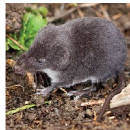
▲ Die Sumpfspitzmaus bekommt man selten zu Gesicht. Ch.B. & S.R.