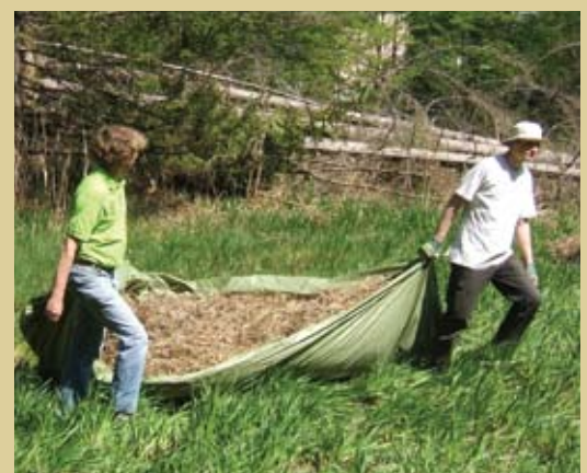
▲▲ Abrechen der Prähauserbauer-Wiese. B.S.