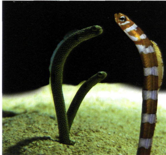
Heteroconger hassi (links) und Gorgasia preclara (rechts)

Röhrenaale (Unterfamilie Heterocongrinae) sind hochspezialisierte Fische, die weltweit in tropischen Meeren auf Sandgrund vom Flachwasser bis in 50 m Tiefe leben. Die Kolonien können bis zu 5000 Individuen erreichen (CLARK 1980 und CLARK et al 1990). Röhrenaale bauen sich im Sand senkrechte Röhren, die mit kurzen Stoßbewegungen mit dem spitzen, harten Schwanzende gegraben werden (FRICKE 1970). Hautdrüsen produzieren ein Sekret, mit dem die Wohnröhre verfestigt wird (CASIMIR et al. 1971). Bei Gefahr ziehen sie sich blitzschnell in die Röhre zurück. Als Planktonfresser sind Röhrenaale auf eine ständige Strömung angewiesen. Aus dieser schnappen sie sich mit wiegenden Bewegungen tierische Kleinstlebewesen.