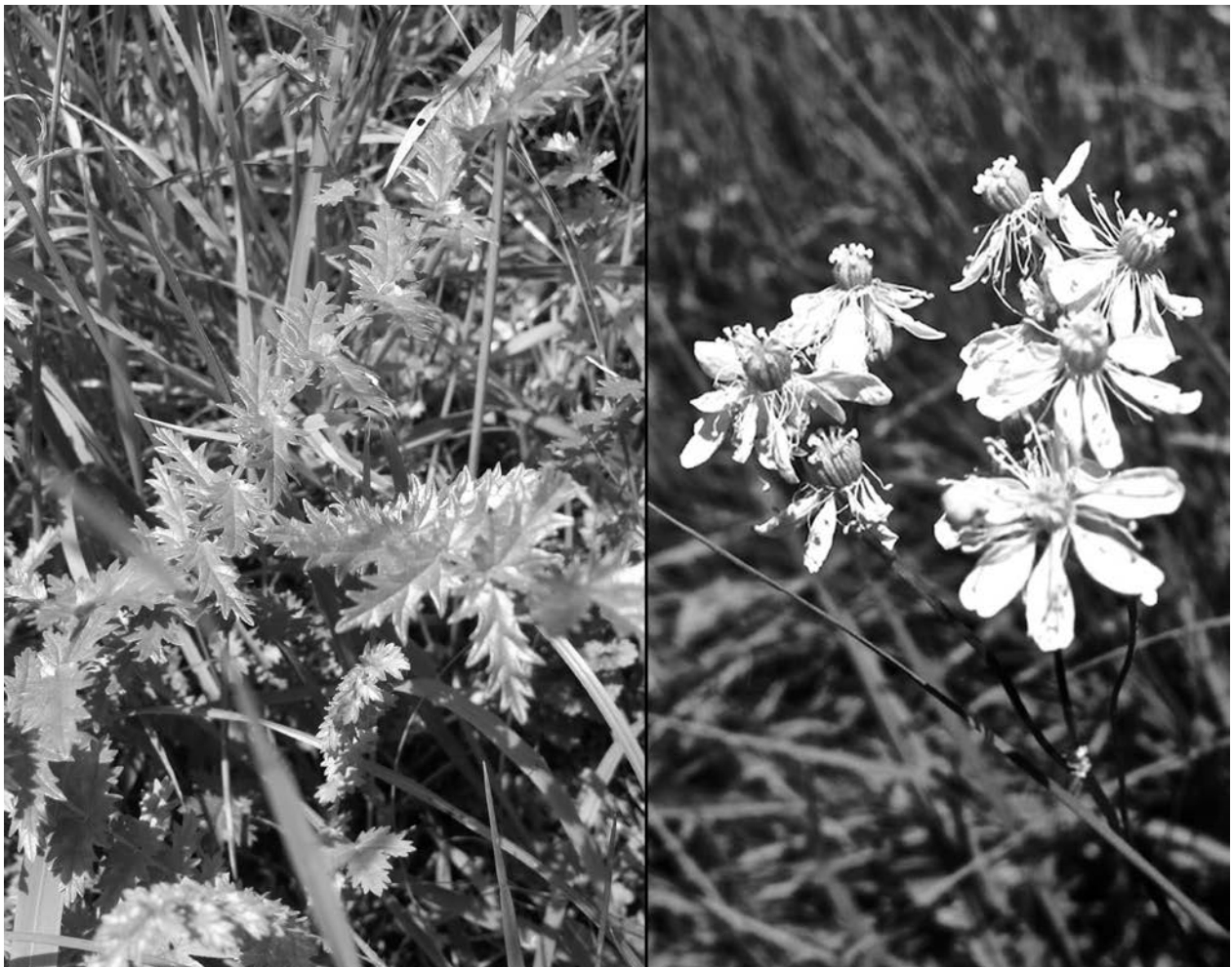
Abb. 3: Links die Blätter des Klein-Mädesüßes ( Filipendula vulgaris ) in Hallwang, rechts ein blühendes Exemplar in Bad Vigaun.

NEU für Österreich: Auch wenn ROTHMALER (2008) davon berichtet, dass sich die Lindheimer-Prachtkerze über Selbstausaat vermehrt, konnten in Österreich bisher noch keine Verwilderungen bemerkt werden. Diese nicht selten kultivierte Zierpflanze wird gerne in Staudenbeeten und Sommerabatten gepflanzt und bildet bis zu 150 cm hohe Kerzen mit zahlreichen weiß bis zart rosa gefärbten Blüten. In WALTER et al. (2002) wird die verwandte Gaura biennis für die Steiermark als verwildert angegeben, welche sich auf den Botanischen Garten in Graz bezieht, in dem die Art wie Un-