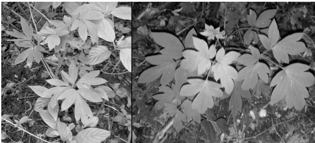
Abb. 5: Verwilderte Exemplare der Herzblume ( Lamprocapnos spectabilis ) im Sonnenbergpark (links) und am Leopoldskroner Weiher (rechts).