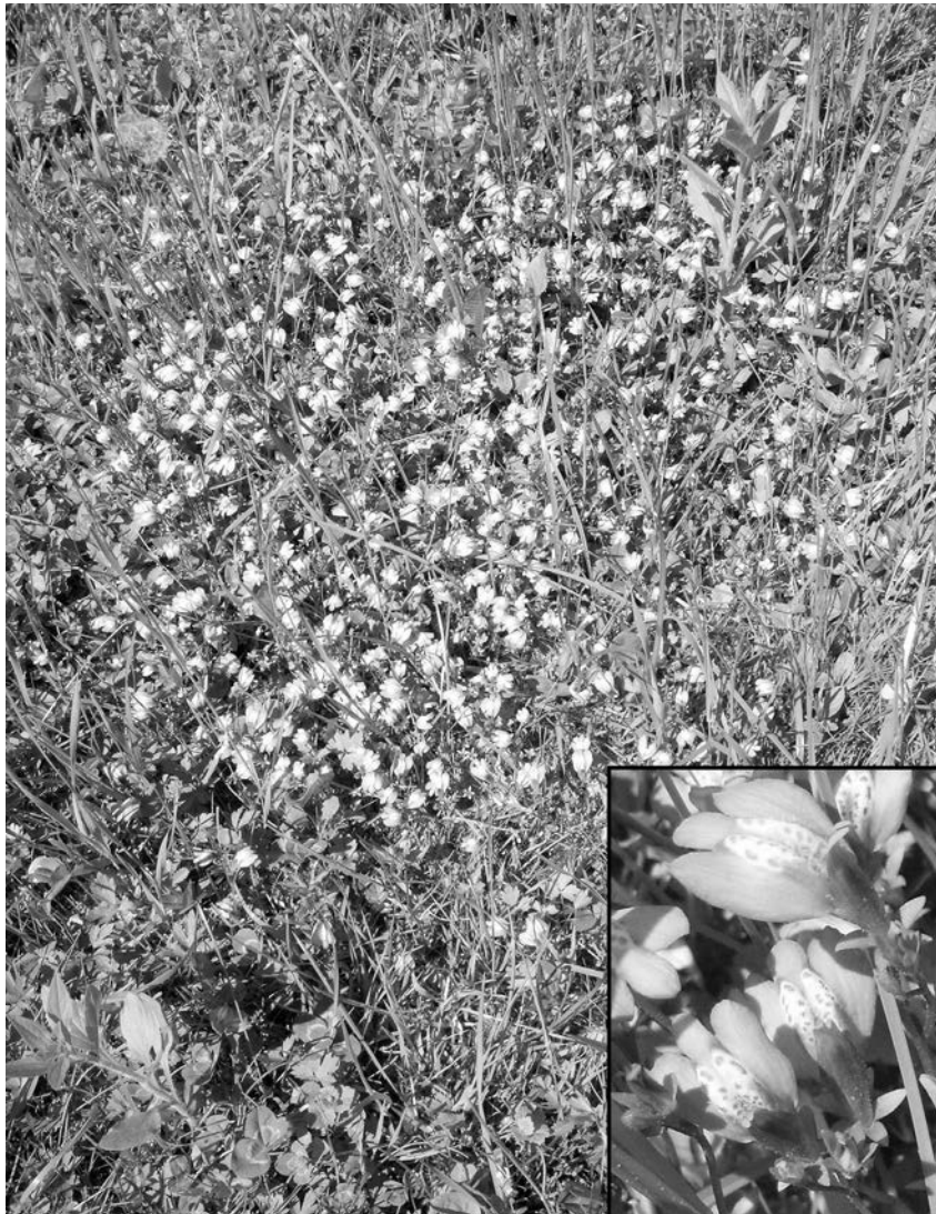
Abb. 6: Das verwilderte Kriech-Lippenmäulchen ( Mazus miquelii ) im Rasen des Salzburger Landeskrankenhauses. Im kleinen Bild sind die Blüten detailliert dargestellt.

NEU für Österreich: Das Kriech-Lippenmäulchen stammt aus Ostasien, wo es Wegränder feuchter Orte und lichte Wälder besiedelt (FLORA OF CHINA 2015a). Die Gattung Mazus wurde ursprünglich den Braunwurzgewächsen (Scrophulariaceae) zugerechnet (vgl. ROTHMALER 2008), nach neueren molekularbiologischen Erkenntnissen erst den Gauklerblumengewächsen (Phrymaceae) – zu denen auch die Gattung Mimulus gehört – und zuletzt als eigene Familie (Mazaceae) gehandelt (REVEAL 2011). Die Unterscheidung der in Europa eingeführten Mazus -Arten, und auch deren Taxonomie, sind z.T. sehr schwierig (vgl. MANUAL OF THE ALIEN PLANTS OF BELGIUM 2015). So erwähnen diese, dass Mazus miquelii und M.