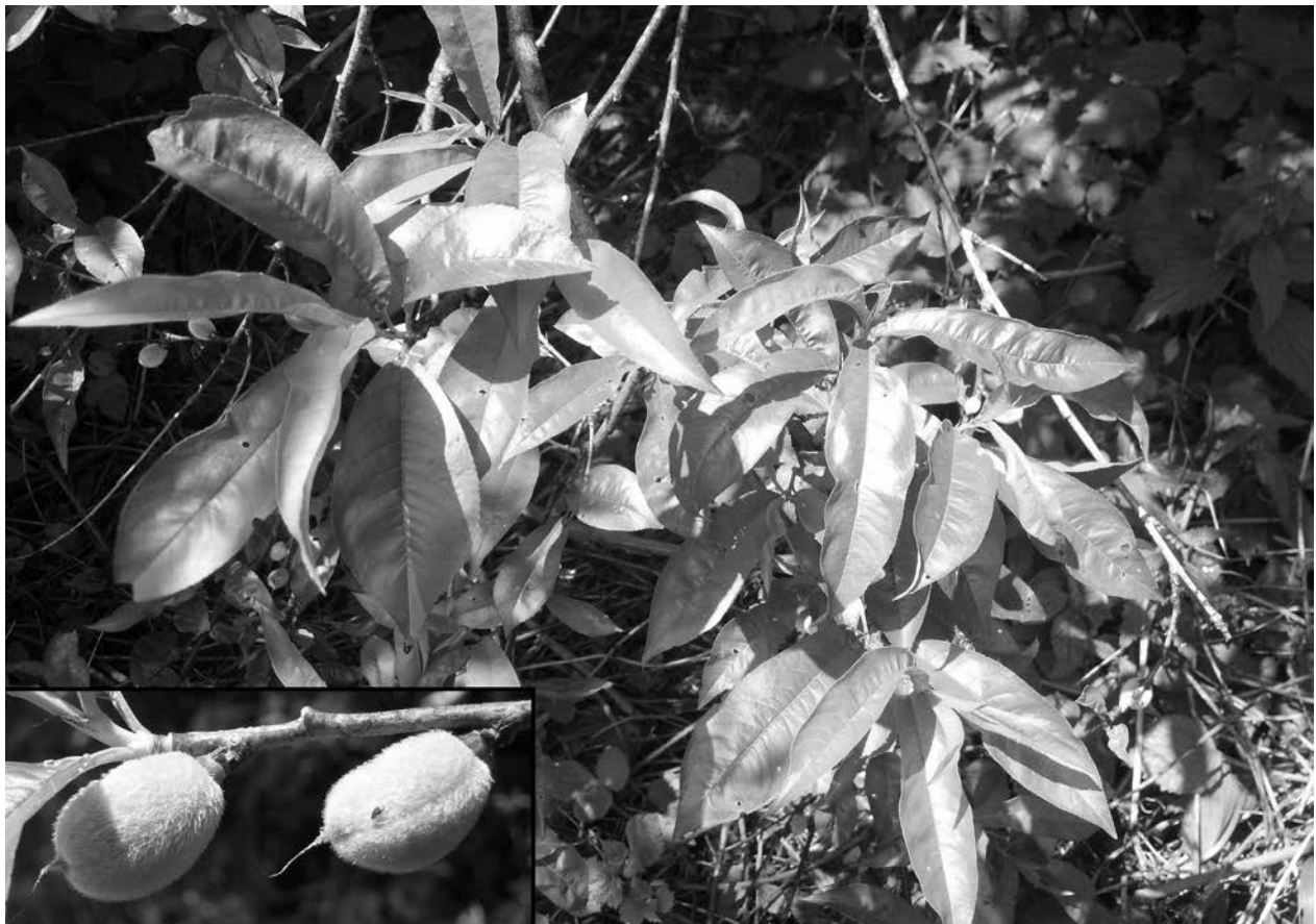
Abb. 7: Belaubte Zweige des Pfirsichbaumes ( Prunus persica ) am Kapuzinerberg. Im kleinen Bild sind junge Früchte abgebildet.

Flachgau, Hallwang, Söllheimer Berg, 240 m ostnordöstlich der Eisenbahn-Unterführung der Söllheimer Straße, Magerasen auf ehemaliger Schottergrube, ca. 490 m, 8144/3, 18.09.2014, leg. GP & KM. – Flachgau, Elsbethen, Glasenbach, J. Herbst-Straße, Straßenböschung, ca. 450 m, 8244/2, 18.06.2004, leg. Peter Pils, Herbarium Pils. – Pinzgau, nördlich von Lofer, Straße von Unken ins Heutal, Hintertgöll, Straßenböschung beim Moar, ca. 1000 m, 8341/4, 18.07.2004, leg. Peter Pils, Herbarium Pils.