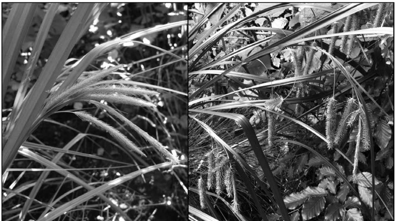
Abb. 2: Links blühendes Exemplar der Groß-Zypergras-Segge ( Carex pseudocyperus ) in Ursprung, rechts die typischen Fruchtstände am Hochgitzten.

Die Ufer-Segge galt im Land Salzburg lange Zeit als verschollen, nachdem der einzige Nachweis am Leopoldskroner Weiher (LEEDER & REITER 1958) nicht mehr bestätigt werden konnte. Sie wurde daher in der Roten Liste als ausgestorben bzw. verschollen eingestuft (WITTMANN et al. 1996). Erst 2007 wurde die Ufer-Segge schließlich am Leopoldskroner Weiher wiederentdeckt (STÖHR et al. 2009). Seither konnte ein weiteres Vorkommen im Pinzgau (Zell am See: STÖHR et al. 2007), sowie je eines im südlichen und östlichen Flachgau (Glanegg: STÖHR et al. 2009, Blinklingmoos: GRUBER 2007) dokumentiert werden. Zwei bisher unbekannte, autochthone Bestände der Großsegge wurden nunmehr im Gemeindegebiet von Bergheim entdeckt. Ein ca. 30m 2 großes Vorkommen wurde am Südufer des Mühlbaches in einer Lücke des Ufergehölzstreifens vorgefunden. Er reicht direkt an die Wasserlinie heran bzw. wird randlich langsam vom vorbeifließenden Wasser durchströmt. Auffäl-