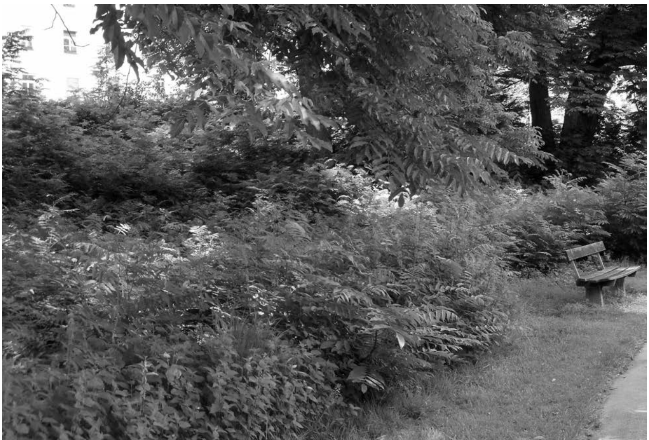
Abb. 8: Dichter Bestand der verwilderten Kaukasischen Flügelnuss ( Pterocarya fraxinifolia ) im Donnenbergpark.

Der Wiesen-Salbei war vor weniger als 60 Jahren keine Seltenheit in Salzburg und von LEEDER & REITER (1958) noch „auf Trockenwiesen vom Vorland bis Golling und Lofer verbr.“ genannt. Durch Intensivierung von Magerwiesen wurde dieser Lippenblütler mit den auffälligen blauen Blüten stark zurückgedrängt. In der Roten Liste, welche vor 20 Jahren verfasst wurde (WITTMANN et al. 1996), klassifiziert man den Wiesen-Salbei bereits als „gefährdet“. Nun regen STÖHR et al. (2012) allerdings an, diesen als „vom Aussterben bedroht“ einzustufen. Jetzt können jedoch zwei weitere rezente Fundpunkte genannt werden, an denen der Wiesen-Salbei vor-