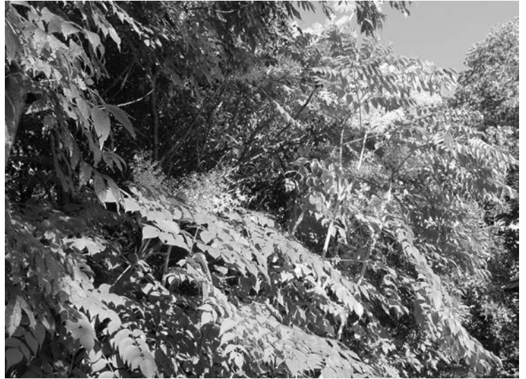
Abb. 1: Blühende Japanische Angelicabäume ( Aralia elata ) am Kapuzinerberg

möglicherweise brachte man die Art ursprünglich dort aus (der Bestand befindet sich direkt neben dem Weg) oder sie entstand über Gartenablagerungen, die aus dem benachbarten Kloster stammen könnten.