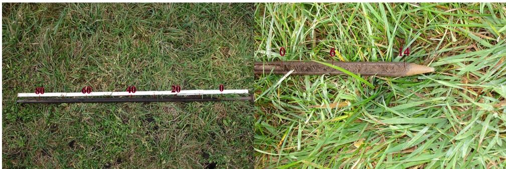
Abb. 2a, b Bodenprofile a - Moorboden (90 cm) b - Moorboden über lehmigem Sand (17 cm)

Gesamtkohlenstoff und Gesamtstickstoff sowie die natürlichen Isotopenverhältnisse ^{13}\text{C}/^{12}\text{C} und ^{15}\text{N}/^{14}\text{N} wurden mit dem Massenspektrometer, gekoppelt mit einem Elementaranalysator, analysiert (GEHRE 1994). Die Bestimmung der Gesamtgehalte von Schwefel (S), Phosphor (P), Kalium (K), Magnesium (Mg), Calcium (Ca), Eisen (Fe), Mangan (Mn) und Aluminium (Al) pro Gramm Trockengewicht (TG) erfolgte mit der Methode der Röntgenfluoreszenz. Zur Bestimmung der löslichen Gehalte von K, Mg, Ca, Fe, Al und Mn im Boden wurden 0,5 g TG Boden mit 12,5 ml bi-distilliertem Wasser extrahiert und zur Analyse der Extrakte wie auch der entnommenen Wasserproben aus den Drainagen und Gräben ein Emissionsspektrometer (ICP-OES) eingesetzt. Chlorid, Nitrit, Nitrat, Sulfat und Phosphat wurden ionenchromatographisch, Ammonium im 1%igen \text{K}_2\text{SO}_4 -Extrakt photometrisch oder mit der SPINMAS-Technik (STANGE et al. 2007) bestimmt. Die Messung der pH-Werte im Boden erfolgte in den wässrigen Extrakten. Die Bestimmung der pflanzenverfügbaren Gehalte von P und K im Boden erfolgte im Calcium-Acetat-Lactat-Auszug (CAL) bzw. nach Extraktion mit \text{CaCl}_2 photometrisch bzw. mittels Atomabsorptionsspektroskopie (VDLUFA 1991).