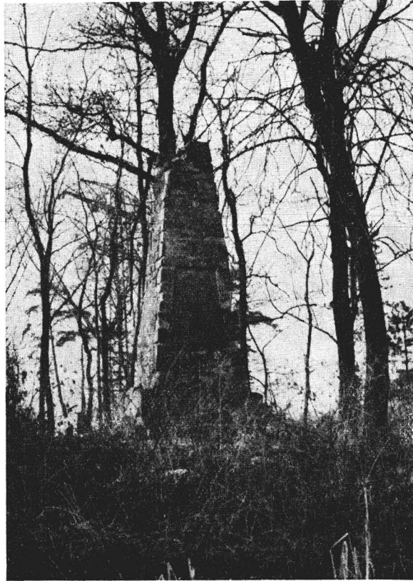
Abb. 6. Der „Graue Stein“ im Dieskauer Park