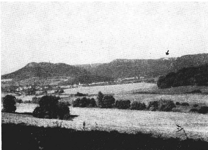
Abb. 1. Hahletal, im Hintergrund Westrand des Ohmgebirges mit „Schloß Bodenstein“.

Das Gebäude mit dem Vorkommen von R. hipposideros (Bechstein) steht oberhalb des westlichen Hanges des Ohmgebirges, der verhältnismäßig steil zum Hahletal abfällt (Abb. 1). Die Höhe von der Talsohle bis zum „Schloß Bodenstein“ beträgt 170 m. Einen Schutz vor nordwestlichen, nördlichen und östlichen Winden bieten die in diesen Richtungen höhergelegenen Erhebungen des Ohmgebirges (535 m NN) sowie der vorkommende Laubwald. In der Nähe des Wochenstubengebäudes schließen sich vereinzelte Gebäude eines ehemaligen Gutes an.