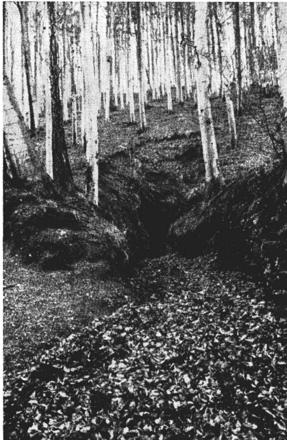
Abb. 1. Stollenmund am Fuße eines Buchenhanges.

Hecht (1931) entdeckte hibernierende Salamander unter Grasbüscheln und Moospolstern, viele versammeln sich in morschen Stubben, hohlen Bäumen oder unter Wurzeln (Klingelhöffer 1956, Feldmann 1964). Bei Arbeiten an der kluftreichen West-