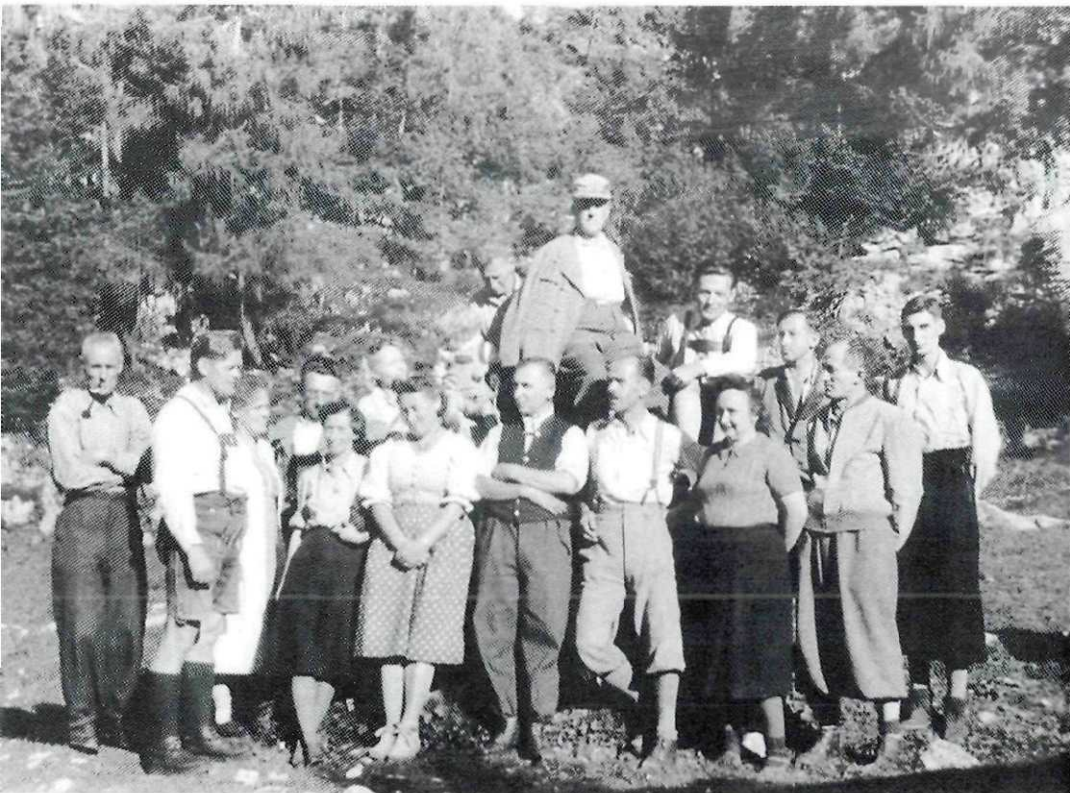
Teilnehmer an der Gründungsversammlung des Verbandes österreichischer Höhlenforscher auf der Schönbergalm bei Obertraun (OO) im Jahre 1949.