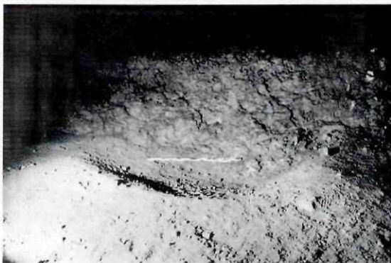
Abb. 5: Große Klingenberghöhle, Bärenliegeplatz, Stelle 5, Größe: 1,8 x 2,8 m