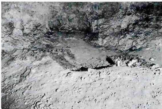
Abb. 4: Große Klingenberghöhle, Bärenliegeplatz, Stelle 1, Größe: 1,5 x 1,6 m

Stelle 7,8: Die beiden nicht sicher als Liegeplätze zu deutenden Stellen befinden sich ebenfalls im Raum D, und zwar in dessen niedrigem südlichem Teil. Die Raumhöhe beträgt dort durchschnittlich nur einen Meter. Die Sohle besteht aus Lehm. Durch