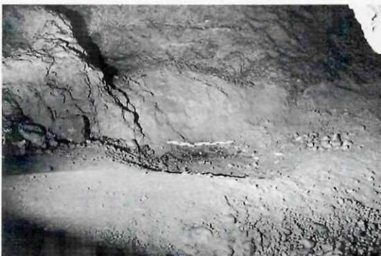
Abb. 6: Große Klingenberghöhle, Bärenliegeplatz, Stelle 6, Größe: 2,3 x 3,0 m