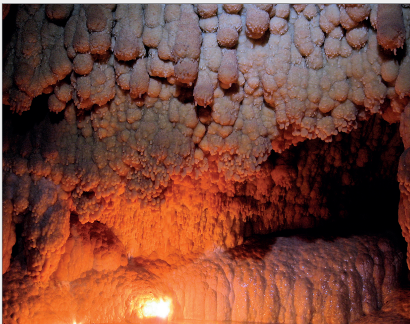
Abb. 2: Pool Fingers in der Qualitätssicherung. Bildbreite ca. 200 cm.

Wenn auch bereits bei der Entdeckung die Besonderheit dieser Sinterformen erkannt wurde, konnten sie erst nach einer österreichweiten Rundfrage von Lukas Plan als sogenannte „Pool Fingers“ identifiziert wer-