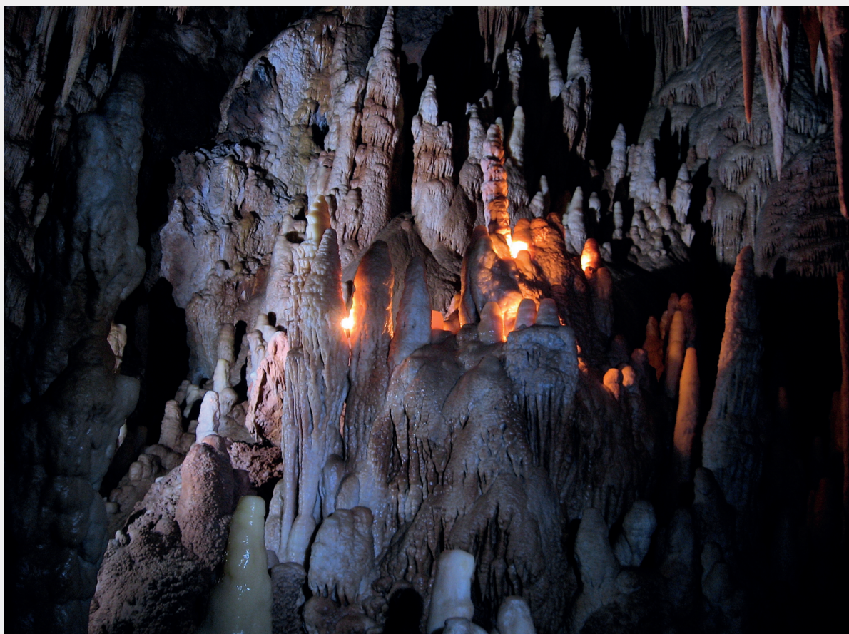
Abb.1: Blick in den Südteil der 30 m langen Weyprecht-Halle.

entdeckt. Nach Erklettern einer 11 m hohen Tropfsteinsäule im SE-Ende der Aprilscherzhalle gelang der Durchstieg durch einen stark versinternten Schluft – die Nordost-Passage – in einen 50° aufwärts führenden Schrägschacht, der im Norden von einem 6 x 4 m großen See begrenzt ist. Nach weiteren 20 Schrägmetern erreicht man die 30 x 20 m große Weyprecht-Halle , die neben 3 cm Durchmesser zählenden Höhlenperlen, Sinterbecken und Tropfsteinsäulen bis 5 m Höhe und 4 m Breite aufweist (Abb. 1). Auffallend ist vor allem die Dichte der auftretenden Speläotheme. Südlich an die Weyprecht-Halle schließen der 20 x 20 m messende Payerdom (ebenfalls ein Höhlenperlen-Fundplatz) und die 25 m lange, extrem lehmige Orgelwerkstatt an. Unterhalb der die östliche Wandbegrenzung verdeckenden Tropfsteinorgel findet sich die Qualitätssicherung , ein Raum mit bemerkenswerten unter Wasser gebildeten Sintern (Fink, et al., 2009).