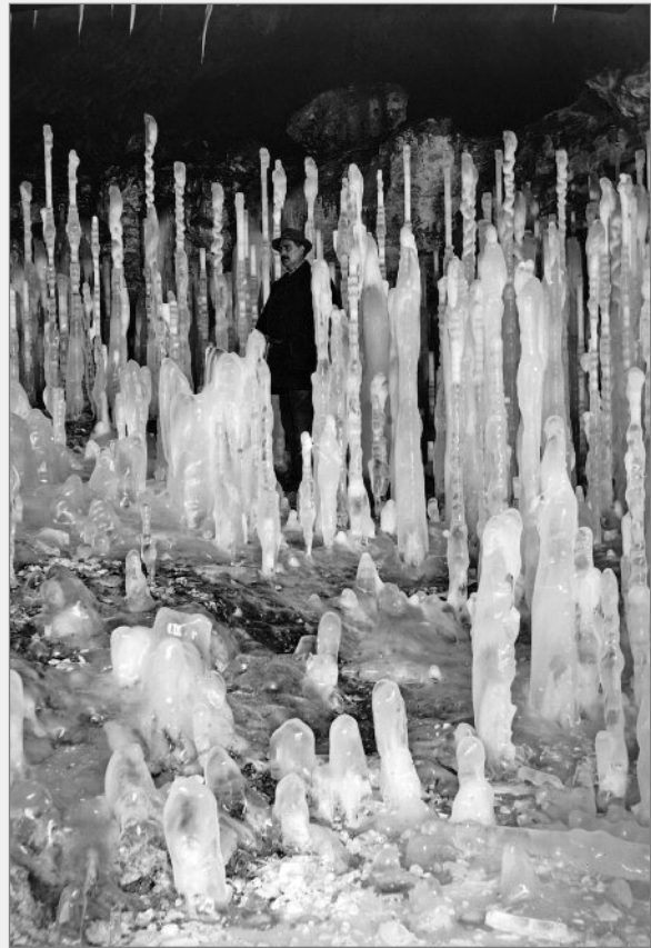
Abb. 3: „Eismandln“ im Eingangsteil des Scheukofens, Aufnahme vom 7.1.1940.