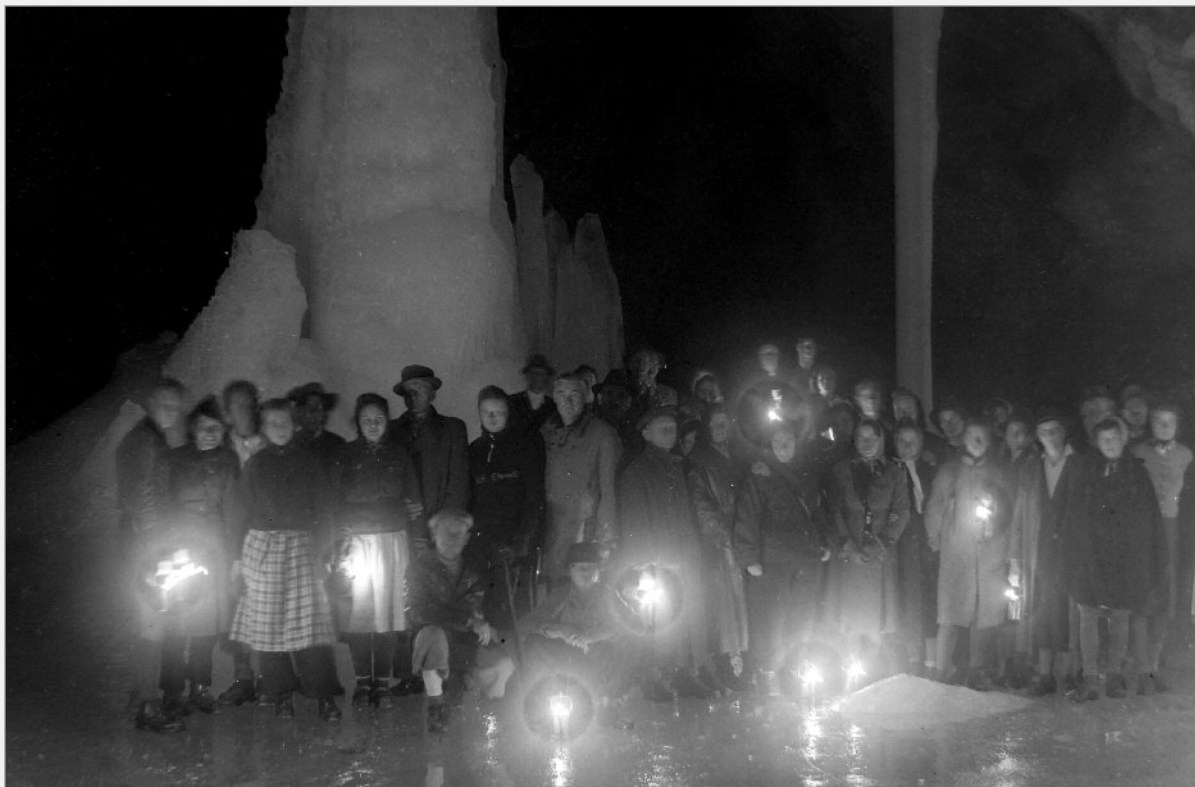
Abb. 1: Teilnehmer eines Ausflugs der NS-Gemeinschaft „Kraft durch Freude“ in die Eisriesenwelt im Juli 1942.