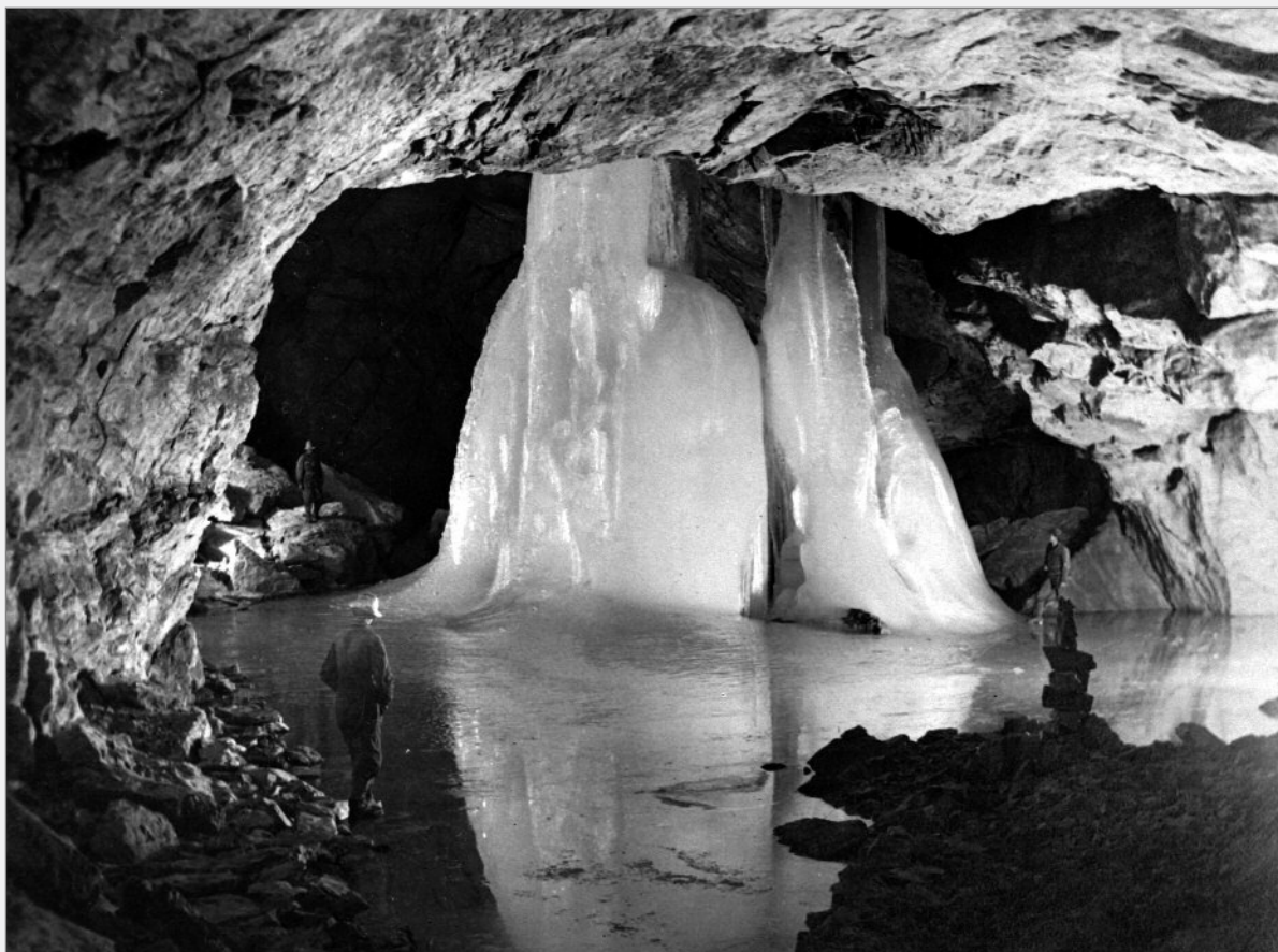
Abb. 2: Eisriese „Baldur“ im Midgard der Eisriesenwelt, Aufnahme um 1940. Fig. 2: Giant ice formation „Baldur“ in Eisriesenwelt, around 1940.