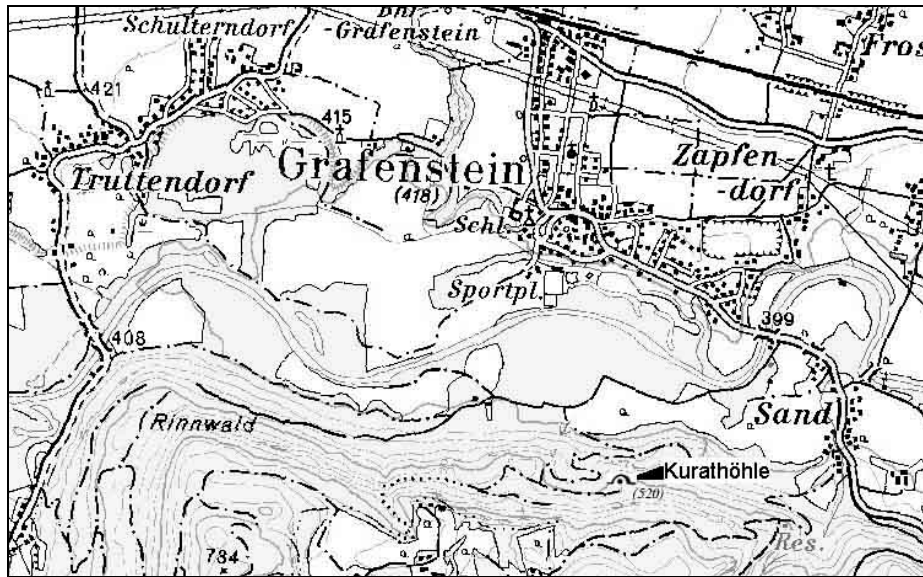
Abb. 1: Standort der Kurathöhle, südl. von Grafenstein.

Am steilen Nordabfall, 120 m über der Gurk südlich von Grafenstein (Abb. 1), liegt im voreiszeitlichen Konglomerat die Kurathöhle (Kat. Nr. 2723/1).