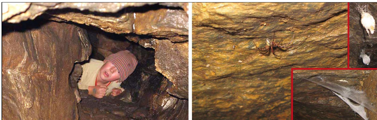
Abb. 9: Tobias ENGL in der engen Röhre.