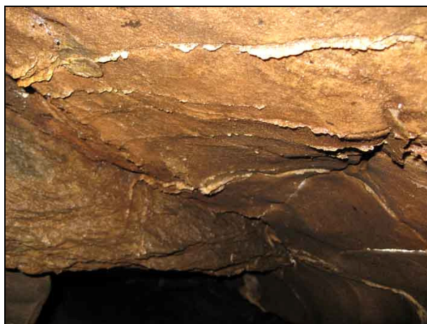
Abb. 8: Eingelagerte Quarzadern an der Decke

Somit wurde wieder eine Höhle erkundet und vermessen, welche eigentlich schon seit vielen Jahren darauf harpte.