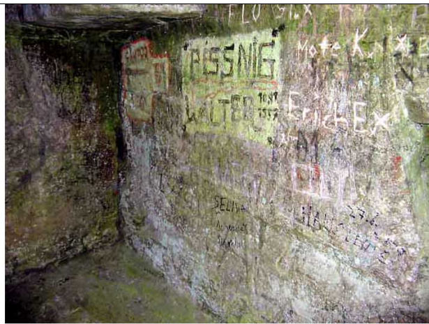
Abb. 2: Ausnehmung vom herausgemeißelten Felsblock.