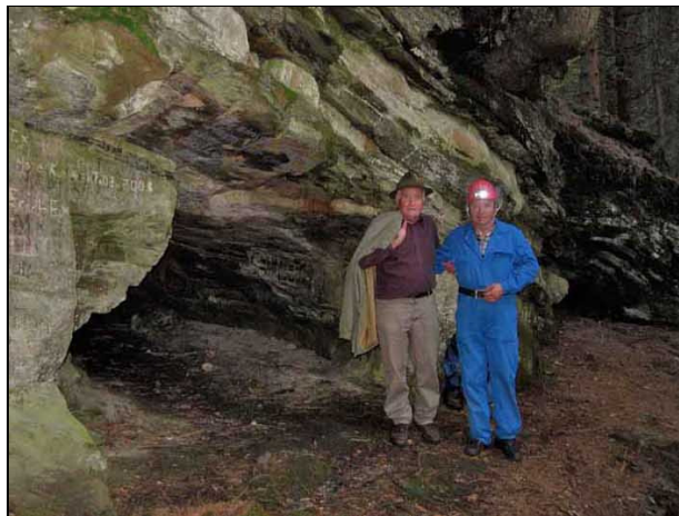
Abb. 1: Das Portal vom Saligerloch, mit den vielen Innschriften

Verfasser: Otto JAMELNIK sen. und Georg PLANTEU