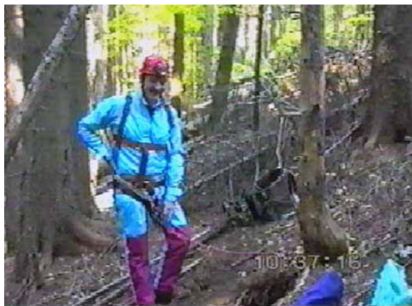
Abb. 6: das Schneckenloch mit dürrer Baum rechts im Bild.

Doch wir gaben nicht auf, im Winter suchte ich in den alten Videobändern nach Aufnahmen vom Schneckenloch. Kопierte und druckte einige Bilder aus, um zu sehen wie die Struktur