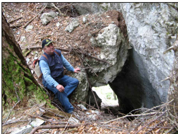
Abb. 2: Das Fenster / Okno.

Danach machten wir uns wieder auf den Weg und gingen weiter nach NO, wo sich zwischen dem Elsafelsen und dem Ansatz zum Urancefelsen das Schneckenloch befindet. Doch zu unserem Erstaunen ist dort eine Kahlschlägerung durchgeführt worden. Die Gegend sah total fremd aus, es waren ja keine Bäume als eventuelle Anhaltspunkte mehr da. Wir mussten im Umkreis von höchstens 10 m suchen, also in einem Kreis von 20 m Durchmesser. Nun versuchte ich mich auf die Struktur des Geländes bzw. der Bäume (nun Baumstümpfe) zu erinnern. Das Gelände steigt ganz leicht, höchstens 20° nach NW an. Das Loch ist 30 cm breit und 60 cm lang und nordöstlich oberhalb vom Loch war ein ca. 15 cm dicker vertrockneter Fichtenbaum. So suchten wir vorerst nach einem Baumstumpf welcher ungefähr diesen