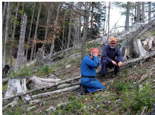
Abb. 7: Bild aus gleicher Position nach der Schlägerung.

Man beachte die Struktur des Geländes auf beiden Bildern, die des Baumes ganz links im linken Bild aber auch die des Baumstumpfes im rechten Bild links, hier ist auch der Baumstumpf vom dürrer Baum nicht mehr vorhanden..