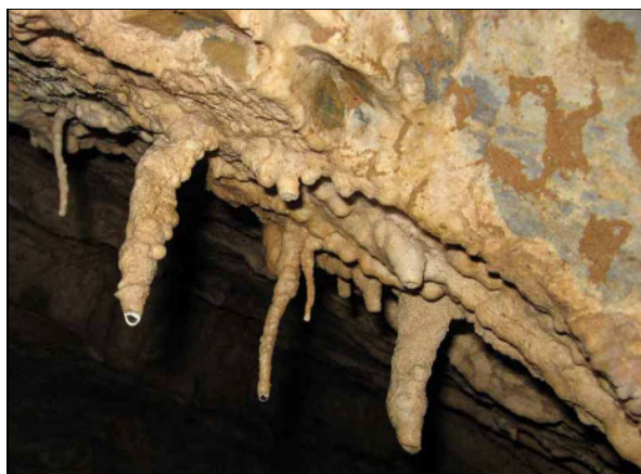
Abb.8: noch aktive Stalaktiten an der Decke.

An dieser Stelle sei noch bemerkt: Aus Sicherheitsgründen, - niemals alle Anwesenden in eine Höhle gehen, einer muss immer draußen bleiben.