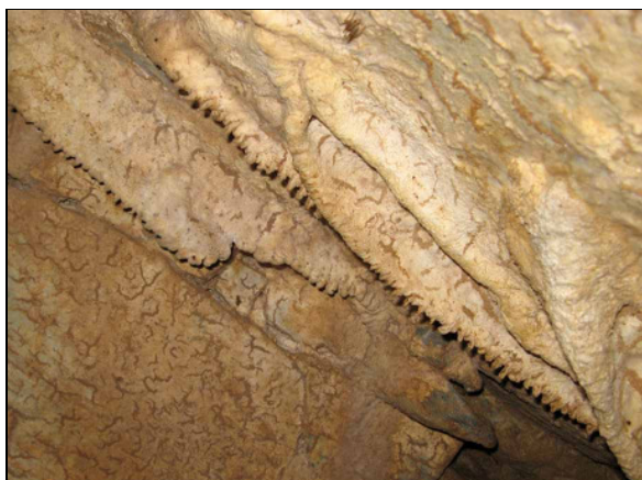
Abb. 9: zahnartigen Gebilde und Tonablagerungen links unten im Bild.