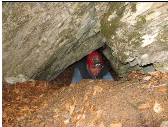
Abb.3: Die Jureluckn.

Baum entsprechen würde. Aber unsere Suche war erfolglos, es könnte ja auch sein, dass der dürre Baum bei der maschinellen Schlägerung samt der Wurzel ausgerissen wurde. Oder es könnte durch Äste udgl. verlegt worden sein. Es blieb uns nichts anderes übrig als die Suche aufzugeben und ein andermal wiederzukommen.