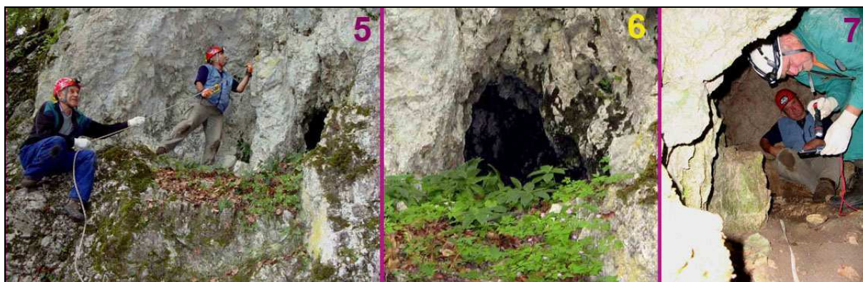
Abb. 5: Balkonartige Felsstufe Abb. 6: Einstieg Abb.7: Sicht zum Innenraum