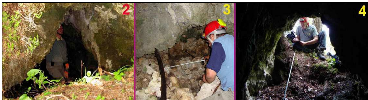
Abb. 2: Einstieg, Abb. 3: Grabung Fotos: O. JAMELNIK. Abb. 4: Einstieg nach Außen Foto: G. PLANTEU

"Suchet und ihr werdet finden". Leichter gesagt als getan. Als Otto JAMELNIK sen. mir den Besuch bei Zdravko HADERLAP vlg.Vinkl in Leppen wegen der Suche nach der Lepa jama vorschlug, war ich sehr begeistert.