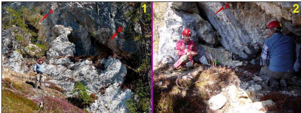
Abb. 1: A = Einstieg in die Turmkluft, B = Halbhöhle. Abb. 2: Halbhöhle, A = Verbindung zur Turmkluft.