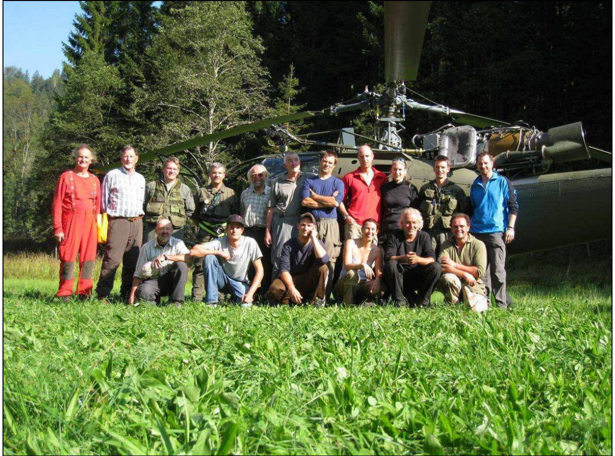
Das gesamte Übungsteam Kotschna Eisdom 2011 ! WIR WAREN DABEI !