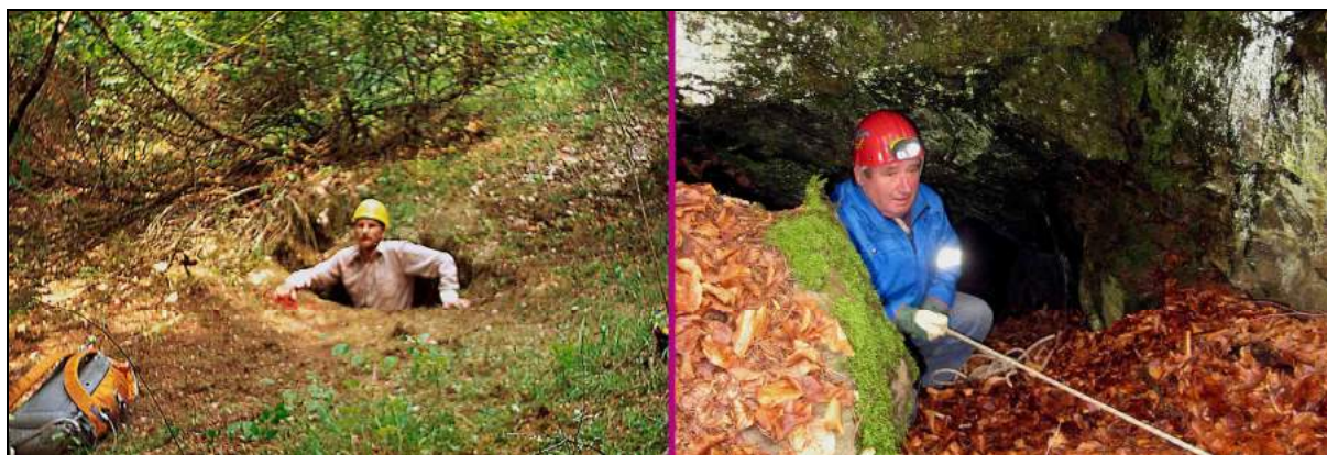
Abb. 1: Graberhöhle