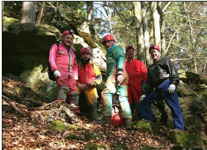
Abb. 4: Vermessungsteam.