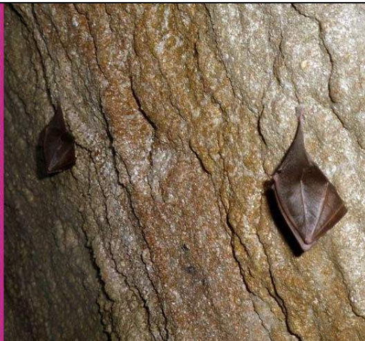
Abb. 5: Fledermäuse