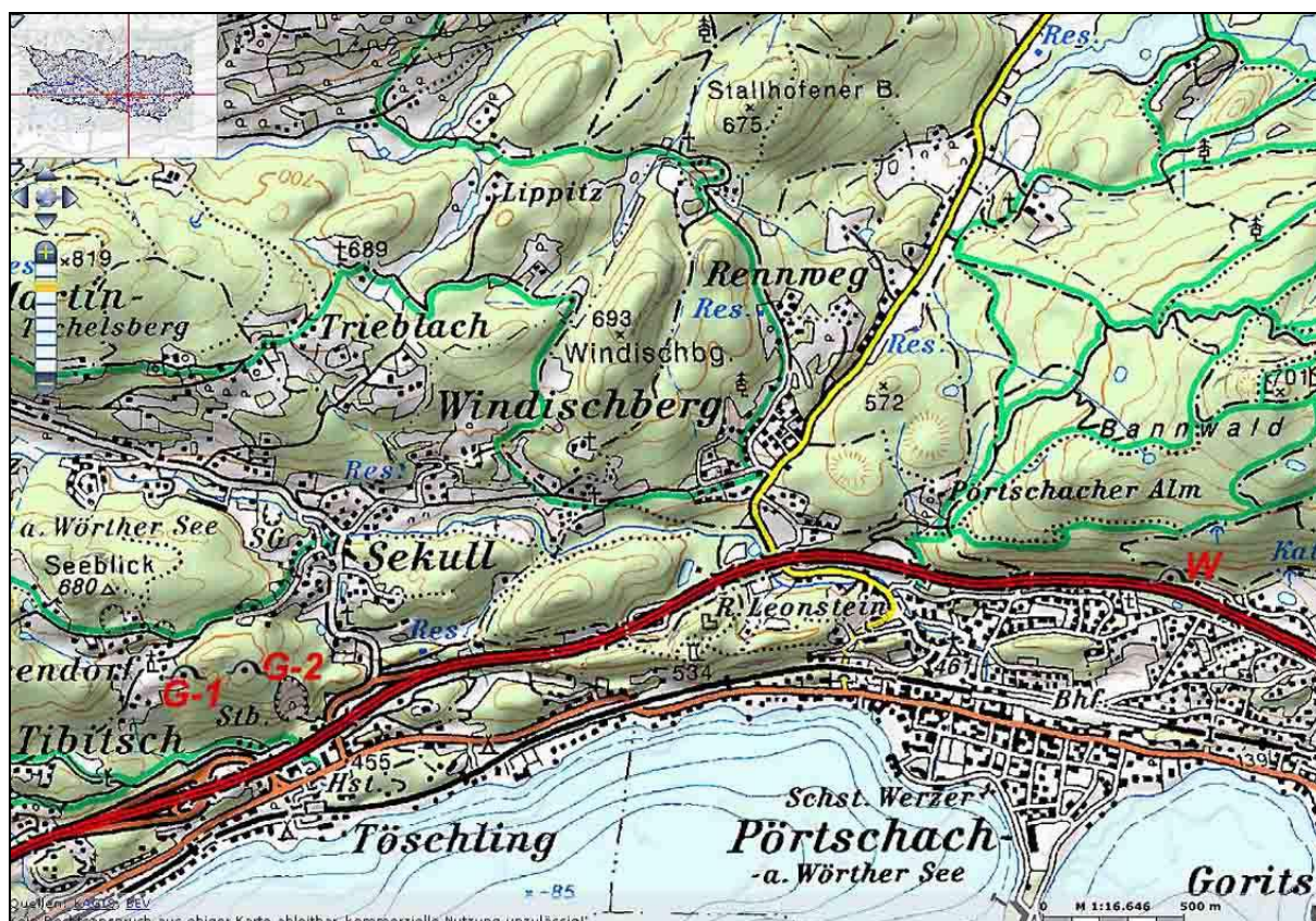
Abb. 3: Untersuchungsgebiet, Gradisch-Kogel SW von Sekull. G-1 = Gradisch-Höhle, G-2 = Graberloch. W = Wasserloch oberhalb der Autobahn nördl. von Pörschach