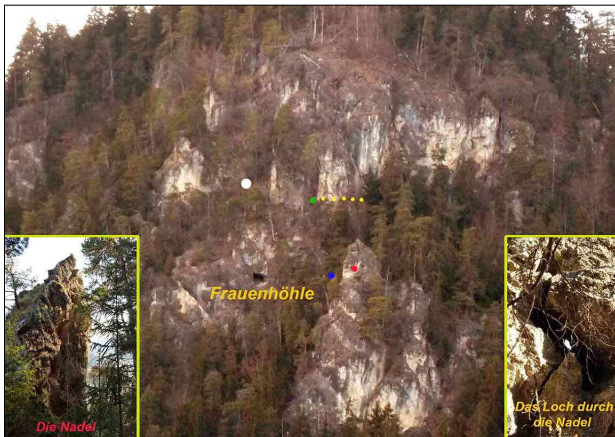
Abb. 8: Der Buchberg mit Frauenhöhle und Blockhalbhöhle. Die Wacholderkluff befindet sich beim grünen Punkt und geht hinter dem Felsen durch (gelbe Punkte). Die Blockhalbhöhle ist beim blauen Punkt und die Nadel ist rot gekennzeichnet.

und auch keine Tropfsteinhöhle, die es dort geben soll. Es wird nämlich erzählt, dass zur Zeit der Türkeneinfälle sich Frauen und Kinder in der Höhle versteckt haben sollten. Dafür fand ich eine Kluff und nannte sie Wacholderkluff, weil davor eine kleine Wacholderstaude wächst (Abb. 5 und 6). Von dort oben hat man eine wunderschöne Aussicht zur Burg Hochosterwitz (Abb. 7). Etwas weiter unterhalb fand ich auch eine kleine Halbhöhle, die wir Blockhalbhöhle nannten (Abb. 2 und 3).