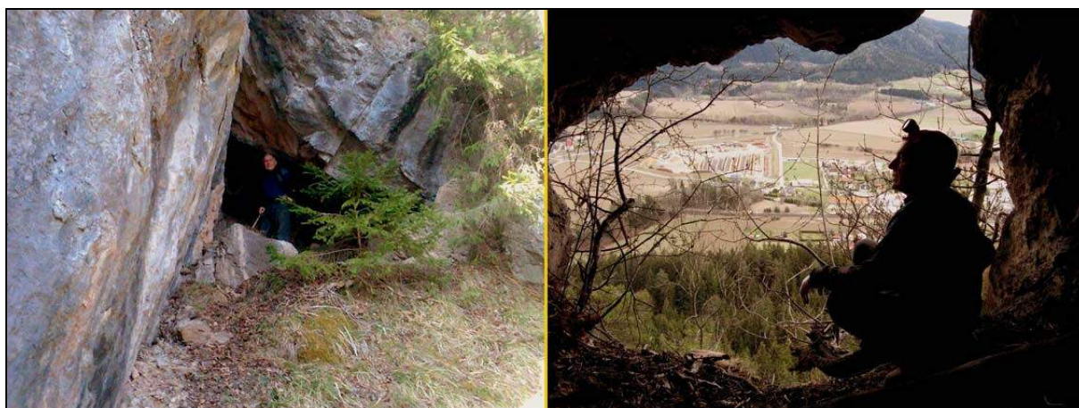
Abb. 3: Blockhalbhöhle.