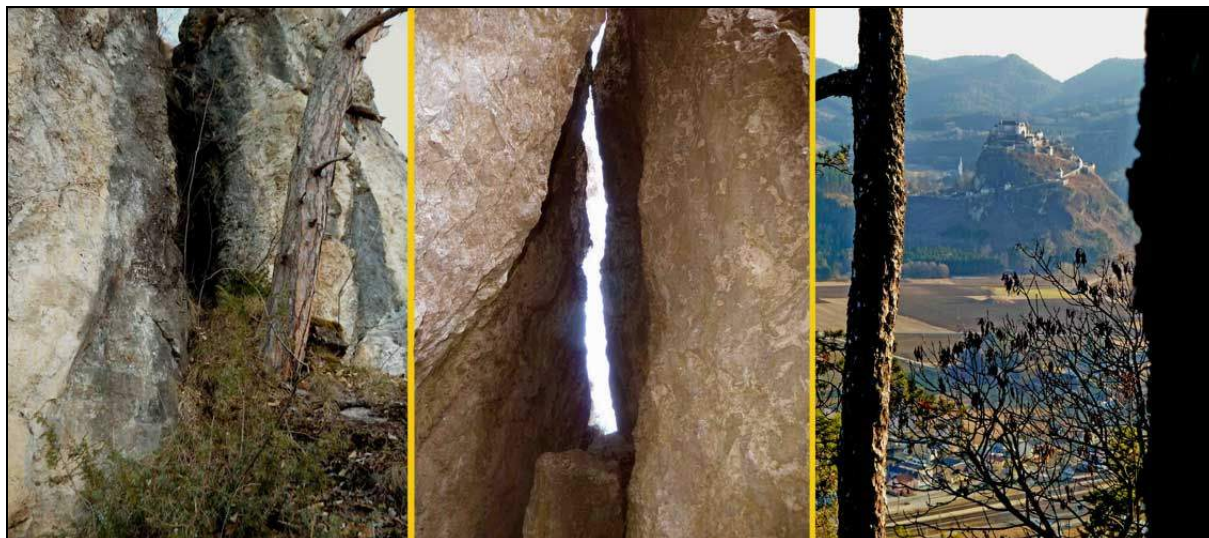
Abb. 5: Wacholderkluff, Frontansicht.