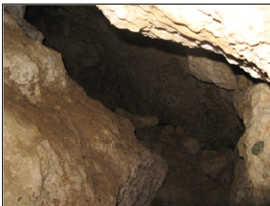
Spaltkluft - kleiner Raum