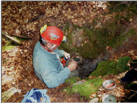
Spaltkluft - Einstieg