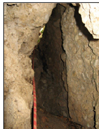
Spaltkluft - nach oben