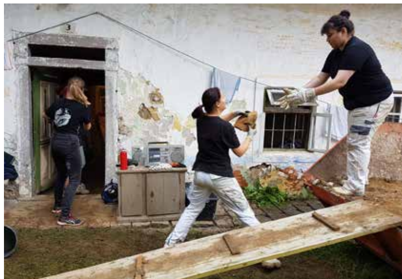
Frauen am Werk beim Sanieren der Schörgendorfer Mühle.