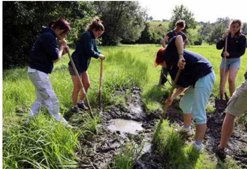
Echte Drecksarbeit – das punktuelle Drainagieren der Wege im Naturschutzgebiet Koaserin.