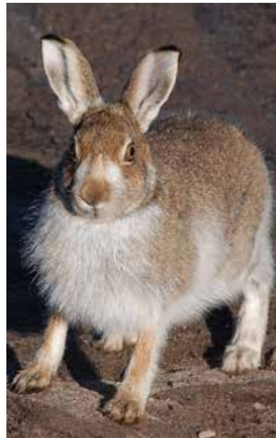
Schneehase ( Lepus timidus ) im Wechsel vom braunen Sommer- ins weiße Winterfell.