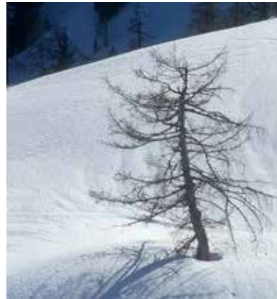
Lebensraum des Schneehasen ( Lepus timidus ).