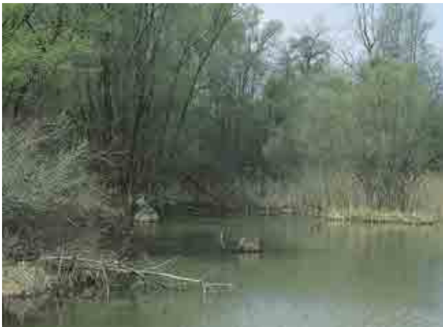
Weiche Au am Unteren Inn

1998 startete das EU-LIFE-Natur-Projekt „Unterer Inn mit Auen“, das von Bayern und Oberösterreich gemeinsam getragen und abgewickelt wird. Die grenzübergreifende Idee von Natura 2000 kann hier modellhaft verwirklicht werden, denn Ökosysteme über politische Grenzen hinweg zu managen und in engster Kooperation zu verwalten ist ein neues Ziel.