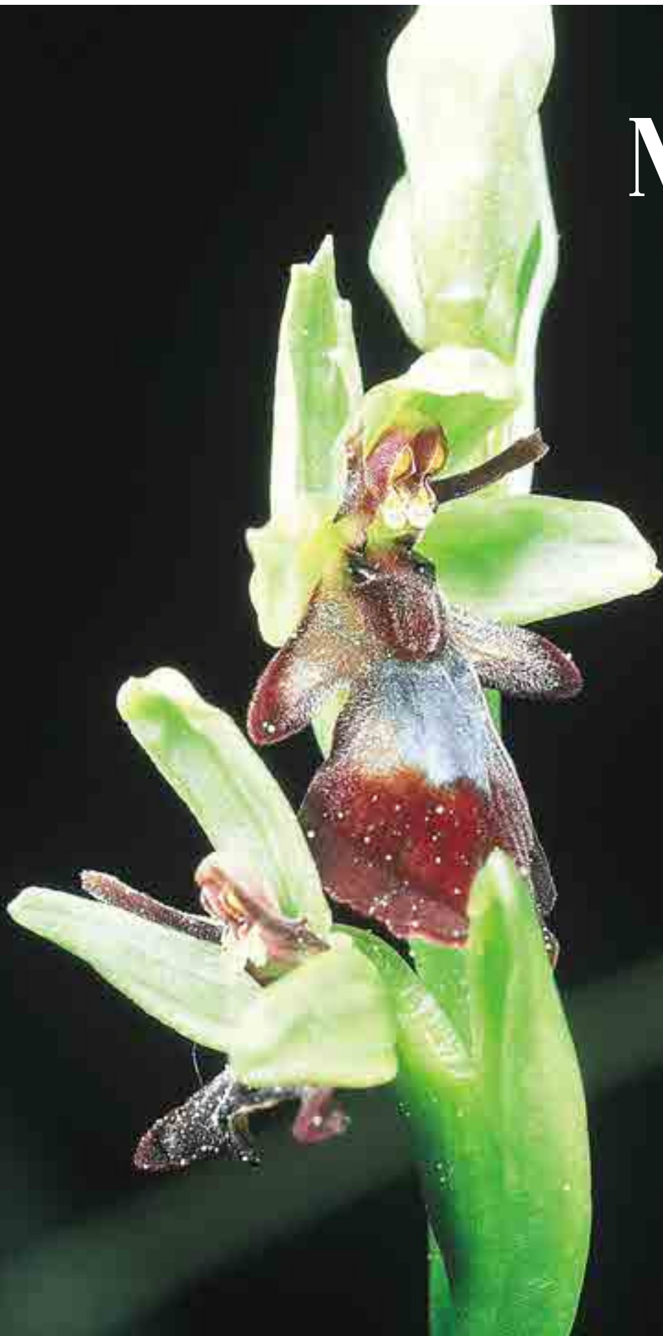
Fliegenragwurz ( Ophris insectifera )