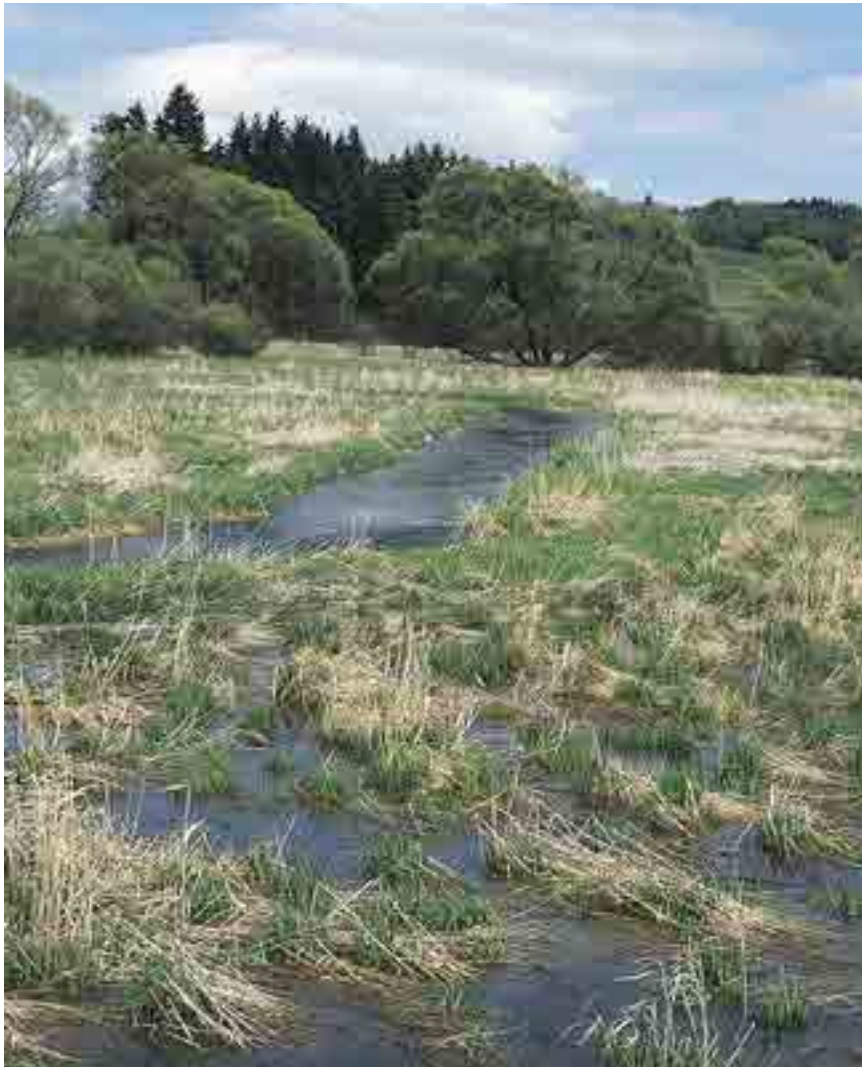
Malsch bei Leopoldschlag

D as Gebiet erstreckt sich entlang der Malsch zwischen der Ortschaft Hacklbrunn bei Sandl und der Einmündung des Eisenhuterbaches bei Leopoldschlag. Als Schutzgebiet gilt der Flusslauf selbst und seine