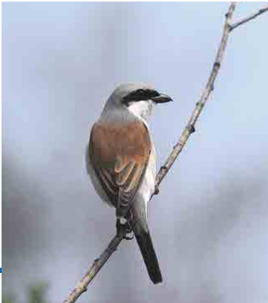
Neuntöter ( Lanius collurio )

Das Gebiet ist heute nach menschlichem Ermessen gesichert, das Wasserregime aber immer noch nicht ausreichend geregelt. Die Drainagen der Wiesen am Ostrand reichen bis unmittelbar an die Schutzgebiets-Grenze heran; teilweise werden immer noch kleinere Gräben – sogar über Landesbesitz – gezogen. Am Südrand des Schutzgebietes wurde eine Kultur amerikanischer Heidelbeeren angelegt und eingezäunt, womit wieder eine Fläche als verloren zu betrachten ist. Somit bleibt für die Zukunft noch einiges zu tun!