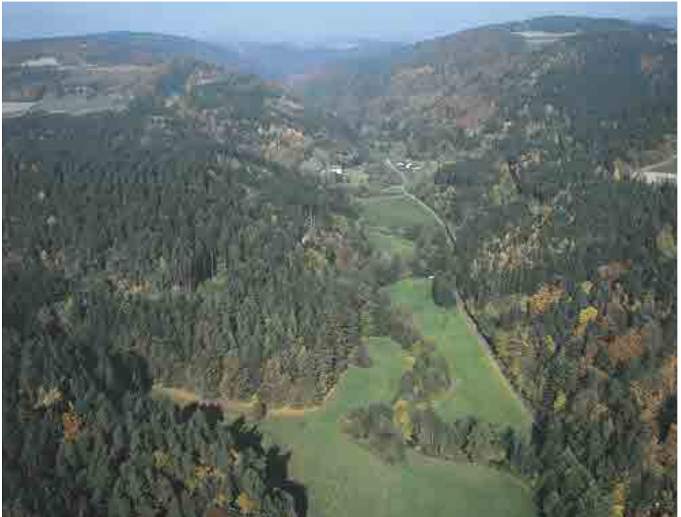
Blick von Unterweikersdorf nach Norden

Obwohl eine Reihe anderer Mühlviertler Fließgewässer in Teilbereichen ähnliche Qualitäten aufweisen, ist die Kleine Gusen samt der angrenzenden Talräume mit ihrer speziellen Ausprägung und der weitreichenden, unverbauten Landschaft doch etwas Besonderes, so dass aus naturschutzfachlicher Sicht die Erhaltung dieses Lebensraumes unumgänglich ist.