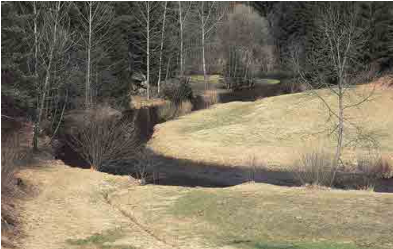
Frühling an der Waldaist

Diese Schmetterlinge brauchen für ihre Entwicklung nicht nur den Wiesenknopf als Futterpflanze, sondern auch bestimmte Ameisenarten, in deren Nestern ihre Raupen leben. Nur wenn beide Elemente auf kleinstem Raum nebeneinander vorhanden sind, können die Ameisenbläulinge überleben.