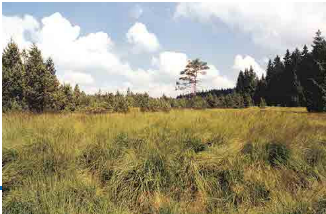
Einer der wenigen waldfreien Bereiche des Tanner Moores

Das Tanner Moor zählt zu den größten österreichischen Mooren. Es ist ein in Teilbereichen touristisch gut erschlossenes Naturschutzgebiet. Auch wenn es im Interesse des Naturschutzes liegt, die Schutzwürdigkeit und Besonderheit derartiger Lebensräume einer breiten Öffentlichkeit zu präsentieren und zu erklären, müssen Bedenken gegenüber einer allzu intensiven „Vermarktung“ angebracht sein. Wesentlicher Faktor des Naturschutzes ist immer noch der Schutz und die Bewahrung natürlicher und naturnaher Ökosysteme, von denen der Mensch zwar nicht prinzipiell ausgeschlossen sein kann, im Gegenzug aber auch nicht in zu hohem Maße Besitz ergreifen soll.