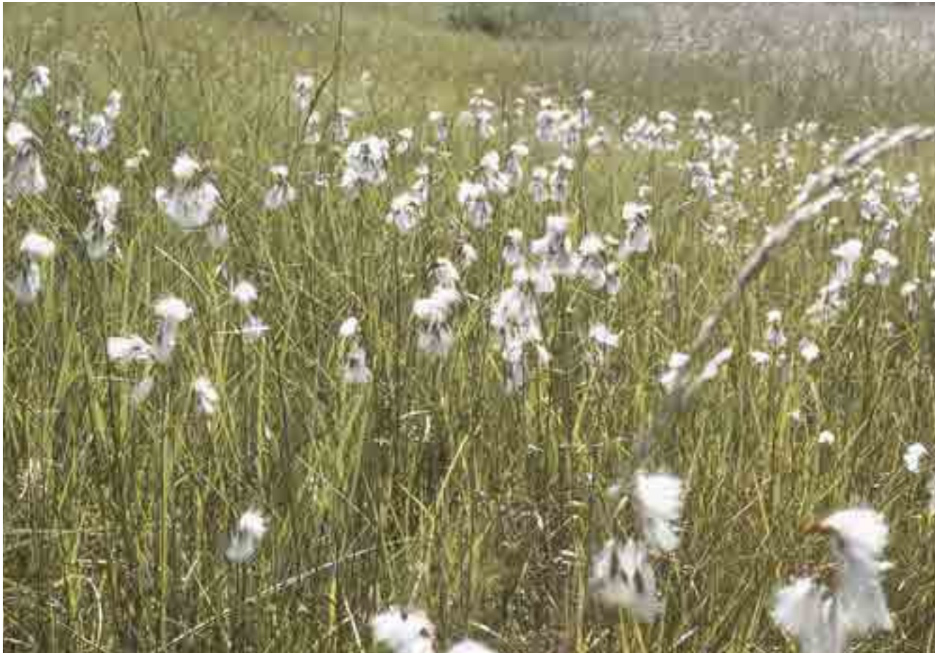
Schmalblättriges Wollgras ( Eriophorum angustifolium )

Das Frankinger Moos weist eine Torfmächtigkeit von drei bis fünf Metern auf und ist damit sehr alt. Die Moorbildung begann nach der letzten Eiszeit vor zirka 9.500 Jahren. Das Stadium des reinen Hochmoores ist bis heute nicht erreicht, was dem Gebiet seinen besonderen Wert verleiht. Entwässerung und Torfstich in der Umgebung trugen aber dazu bei, dass dieses Moor sein Wachstum weitgehend eingestellt hat.