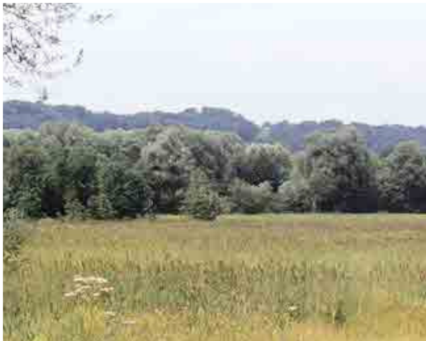
Feuchtwiese unweit Schwaig

Zu den weltweit bedrohtesten Vogelarten zählt der in der Ettenau brütende Wachtelkönig. Dem nachtaktiven Vogel bietet dieses Gebiet mit seiner stark strukturierten Landschaft, dem Wechsel zwischen extensiv genutzten Wiesen, Wäldern und Gewässern einen idealen Lebensraum. Aber auch andere Vogelarten, wie zum Beispiel der Weiß- und Schwarzstorch, der Wanderfalke oder gar der Fischadler verweilen bei ihrem Durchzug im Ettenauer „Revier“.