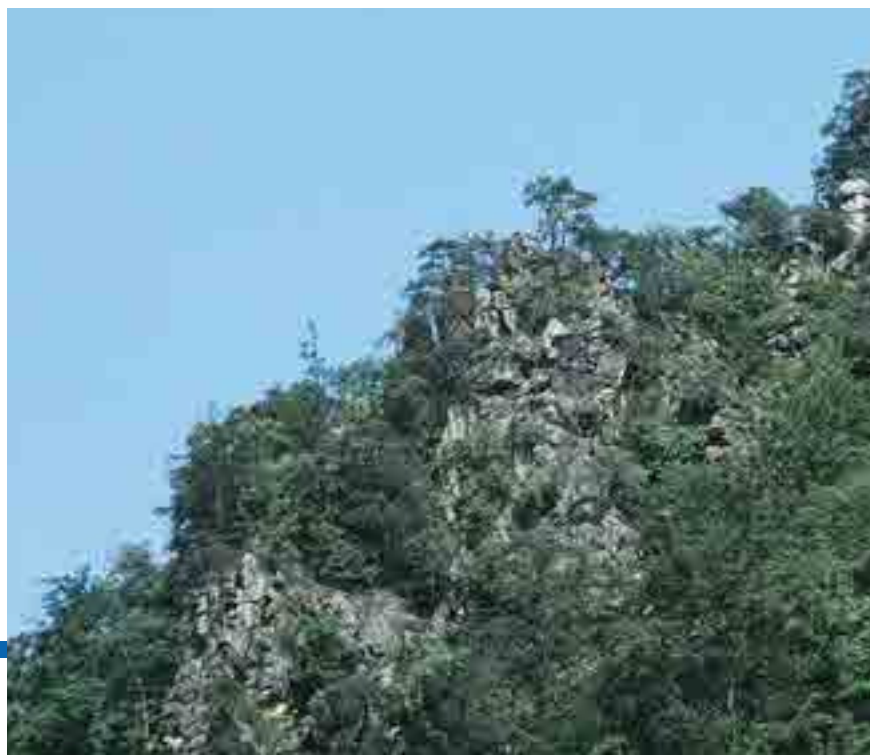
Der Predigtstuhl bei Hinteraigen mit Föhren-Eichen-Wäldern

Deutlich abgehoben von den ausgedörrten, sonnendurchfluteten Südhängen präsentieren sich die tief eingeschnittenen Seitentäler und Schluchten, welche die Donauhänge immer wieder unterbrechen. Der Anblick mächtiger Eschen-, Bergahorn-, Berg- und Flatterulmenbäume vermittelt den Eindruck in einem Urwald zu stehen. Viele tote Baumstämme, stehend oder liegend, verstärken dieses Gefühl. Das Klima ist hier ausgeglichen, die Luftfeuchtigkeit hoch.