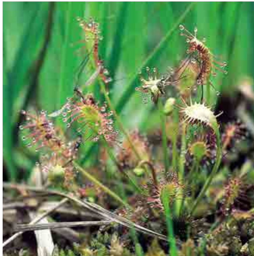
Mittlerer Sonnentau ( Drosera intermedia )

...können für die einzelnen Gebiete erarbeitet werden, sind aber nicht zwingend vorgeschrieben. Sie enthalten Maßnahmen, die sicherstellen sollen, dass die natürlichen Lebensräume und die darin vorkommenden Tier- und Pflanzenarten von gemeinschaftlichem Interesse in einem „günstigen Zustand“ erhalten bleiben. Sie müssen den ökologischen Erfordernissen und wissenschaftlichen Erkenntnissen entsprechen. Bei