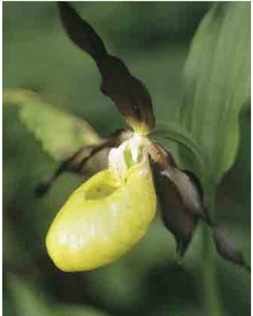
Der Frauenschuh ( Cypripedium calceolus ) ist eine Orchideenart, die auf Grund ihres charakteristischen Erscheinungsbildes leicht erkannt werden kann.