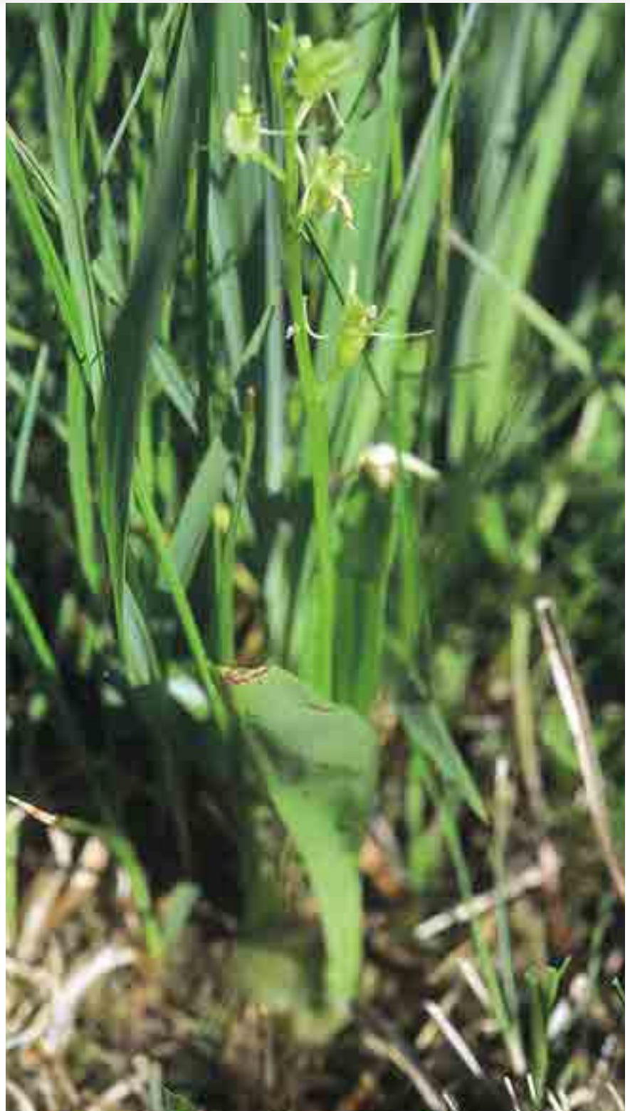
Der Glanzstendel ( Liparis loeselii ) ist eine bereits stark gefährdete Orchideenart der Flachmoore oder sumpfigen Wiesen.

Moorwälder mit Schwarzerlen und Moorbirken umgeben und durchziehen stellenweise die Wiesen. Sie gelten als prioritärer, also besonders schützenswerter Lebensraum und verleihen dieser Landschaft eine unverwechselbare Prägung.