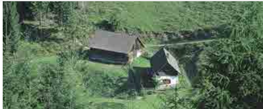
Naturschutz und Landnutzung müssen kein Widerspruch sein – die Menauer Alm.