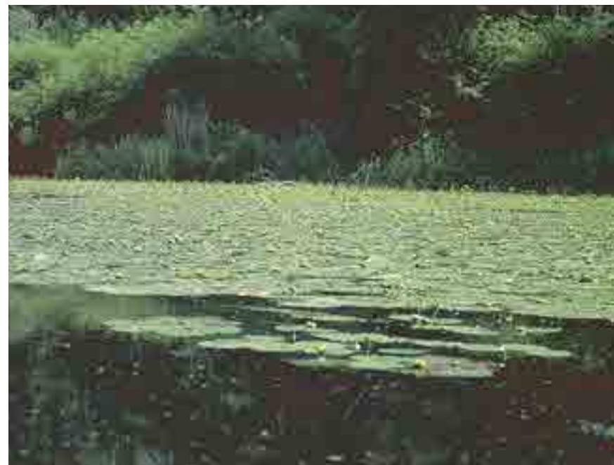
Mitterwasser mit gelber Teichrose

Im Nahbereich der Traun-Donau-Auen entsteht ein großes Stadterweiterungsprojekt, die Solar City Pichling. Um den zu erwartenden Nutzungsdruck auf die benachbarte Au zu minimieren, wurden seitens der Stadt Linz umfangreiche Begleitmaßnahmen initiiert und teilweise bereits umgesetzt: So wird das Mühlbachsystem des Aumühlbaches auf einer Länge von vier Kilometern reaktiviert. Der Kleine Weikerlsee wird vergrößert und als Naherholungszone und Badesee entwickelt. Auf dem Gelände des ehemaligen Truppenübungsplatzes der Kaserne Ebelsberg entsteht ein „Auwald-Ökopark“ als Bestandteil eines Besucherlenkungs Konzeptes, in dem auch ein Lehrpfad über die Ökologie der Traun-Donau-Auen integriert werden soll. Naherholungsansprüche werden so mit den Zielen des Naturschutzes in Einklang gebracht.