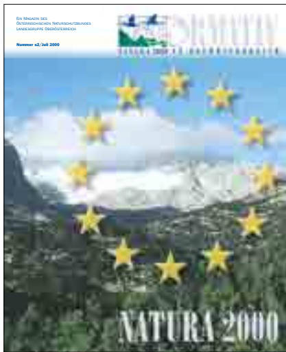
Der Dachstein ist das zweitgrößte an Brüssel nominierte NATURA 2000-Gebiet in Oberösterreich.