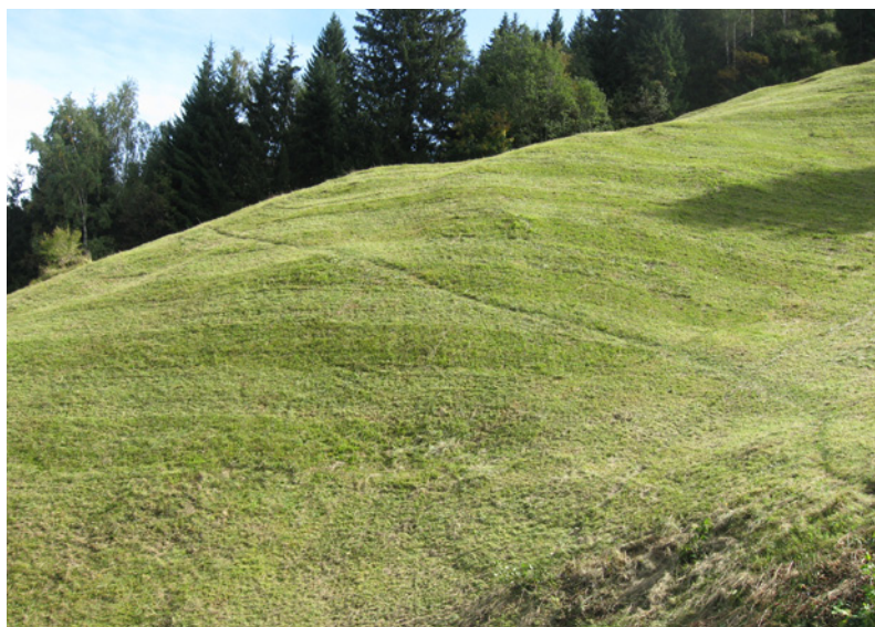
Abb. 2: Fallenstandort a1 (Magerheuwiese)

= 162 spp.) stammt aus Barberfallen. Die Ausbeute der Handfänge erwies sich trotz geringerer Gesamtfangzahl (1010) mit 173 spp. als ebenso umfangreich. Sieben Arten liegen nur mit juvenilen Exemplaren vor: 2 Pholcus opilionoides , 26 Theridion varians , 141 Nuctenea umbratica , 201 Micrommata virescens , 211 Synaema globosum , 221 Ballus chalybeius , 230 Pseudeuophrys erratica . Bei der standörtlichen Zuordnung (Tab. A1) sind Jungtiere von leicht kenntlichen Taxa mit einbezogen (z. B. 128 Aculepeira ceropegia , 160 Pisaura mirabilis , 177 Anypaena accentuata , 208 Misumena vatia etc.), wenn diese Taxa in den Ausbeuten auch mit adulten Exemplaren vertreten sind (Tab. A1).