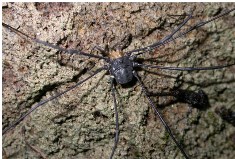
Abb. 13: Gyas titanus

Artenreichster Lebensraum sind die Wälder- und Waldränder mit 15 spp., dabei stellen Lophopilio palpinalis , Oligolophus tridens und Mitopus morio gemeinsam 85 % der Fangzahlen. Auch in den Flach- und Hangmooren herrscht beträchtliche Artenvielfalt (14 spp.) Dabei spielt natürlich die Kleinräumigkeit und Vernetzung mit umgebenden Saumbiotopen eine große Rolle. Großflächigere Moorlebensräume sind sonst tendenziell eher weniger als Lebensraum für Weberknechte geeignet (vgl. Hochmoorkomplex Fohramoos, STEINBERGER & RIEF 2015).