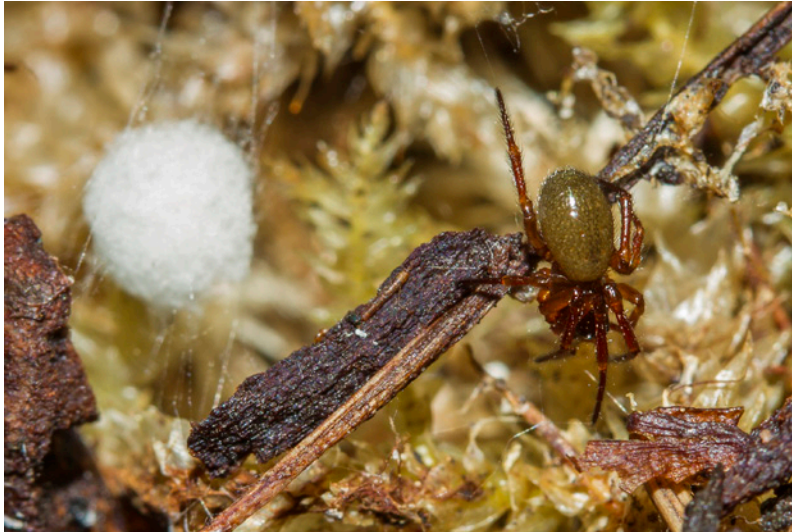
Abb. 11: Robertus lividus

4 Harpactea hombergi , 30 Caracladus leberti , 62 Pelecopsis elongata , 70 Thyreostenius parasiticus , 74 Drapetisca socialis , 110 Meioneta innotabilis , 185 Clubiona corticalis , 230 Pseudeuophrys erratica . Besonderes Augenmerk wurde auch auf Waldstandorte gelegt, die von kleinen Bächen mit teils sumpfiger Umgebung durchzogen sind (d3, d5, e2). Hier ist eine sehr kompakte und charakteristische Gilde spezialisierter Arten von feucht-schattigen Walduferhabitaten zu finden: 38 Diplocephalus helleri (euryzonal bis in die nivale Stufe), 59 Oedothorax agrestis , 85 Bathyphantes similis , 95 Hilaira excisa , 106 Leptorhoptrum robustum , 118 Porrhomma convexum . Auch 122 Metellina merianae (Abb. 12) ist typisch für solche Lebensräume. Die Zusammensetzung der dominanten Waldarten der drei Untersuchungsflächen unterscheidet sich nach den offensichtlich vorherrschenden Standortfaktoren. Im lichten Moorwald (Abfluss eines kleinen Flachmoores) in einem Graben an einer Wegböschung (e2) ist die Waldrandform 149 Pardosa lugubris (21 %) die häufigste Art. Diese vergleichsweise sehr artenreiche Zönose (61 spp.) besitzt höheren Anteil von Moor- und Bruchwaldarten (v. a. 154 Pirata hygrophilus , 12 %). Auch die einzigen Exemplare von 29 Asthenargus paganus (Sumpfwälder, Moore) und 40 Diplocephalus permixtus (Feuchtwiesen, Tü-