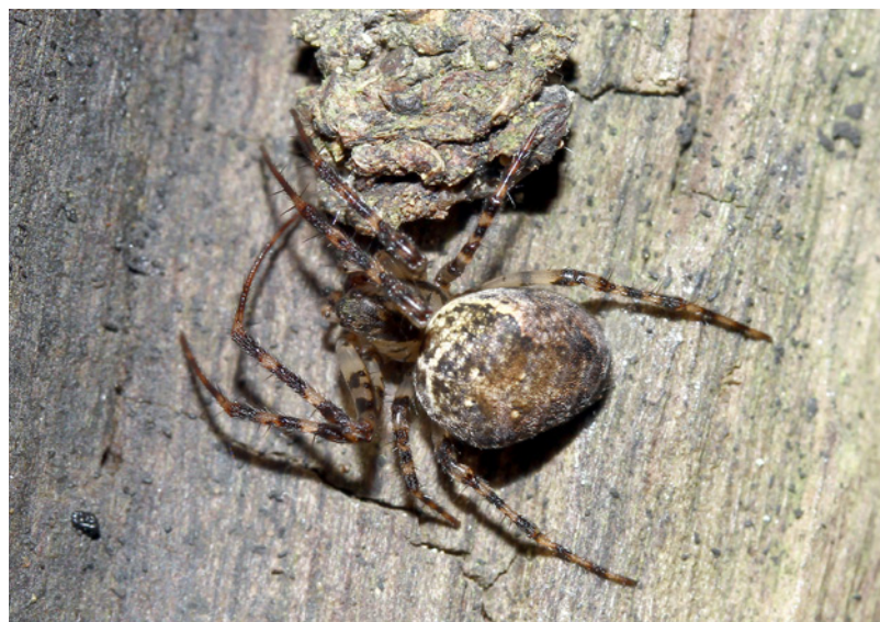
Abb. 12: Metellina merianae

Ein Erlen-Sumpfwald (d5) wurde in einer verkürzten Fangperiode besammelt (22.04. bis 12.07.2015). Dementsprechend liegt nur eine kleinere Ausbeute vor, mit 39 Diplocephalus latifrons an der Dominanzspitze (31 %), gefolgt von der Ufer- und Auenart 59 Oedothorax agrestis . Weiters findet sich eine Mischung der auch an den Standorten d3 und e2 festgestellten, standorttypischen Artengemeinschaft (u. a. 38 Diplocephalus helleri , 85 Bathyphantes similis , 95 Hilaira excisa , 106 Leptorhoptrum robustum ) mit höherer Ähnlichkeit zum Moorwald e2 (154 Pirata hygrophilus ). Die Präsenz von 17 Robertus scoticus (in feuchten subalpinen Waldbereichen) stellt eine Erweiterung der Gesamtartenliste dar. Einzelne Gesiebe an Rindenstrukturen in anderen, extensiv untersuchten Waldstücken, z. B. im Mischwald co3 (am Rande des Grenzmoores, 990 m),