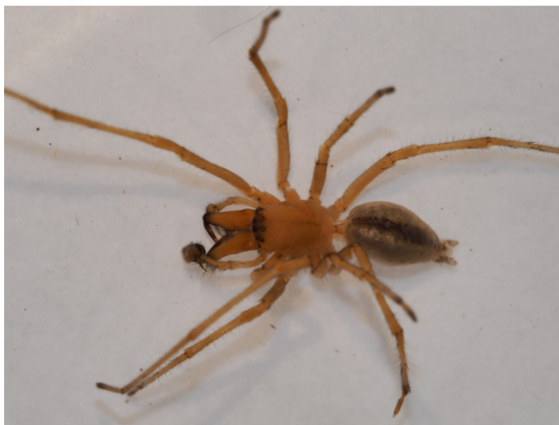
Abb. 8: Cheiracanthium erraticum

1♂, b2 (Flachmoor), BF 25.04.-20.05.2014. Funde von Cheiracanthium spp. sind im Alpenraum mit Ausnahme des mediterran-expansiven Cheiracanthium mildei , der rezent auch in Vorarlberg (ZIMMERMANN 2015) in urbanen Lebensräumen auftritt, durchwegs faunistisch bemerkenswert. Cheiracanthium erraticum ist im Kulturland und in Feuchtwiesen des planar-kollinen außeralpinen Mitteleuropa häufig und kontinuierlich verbreitet, strahlt jedoch nur marginal in die Alpentäler ein. Aus Vorarlberg ist bis jetzt erst ein Fundort bekannt (Gsieg-Obere Mäher, 1♂ 15.05.2005, leg. T. Kopf).