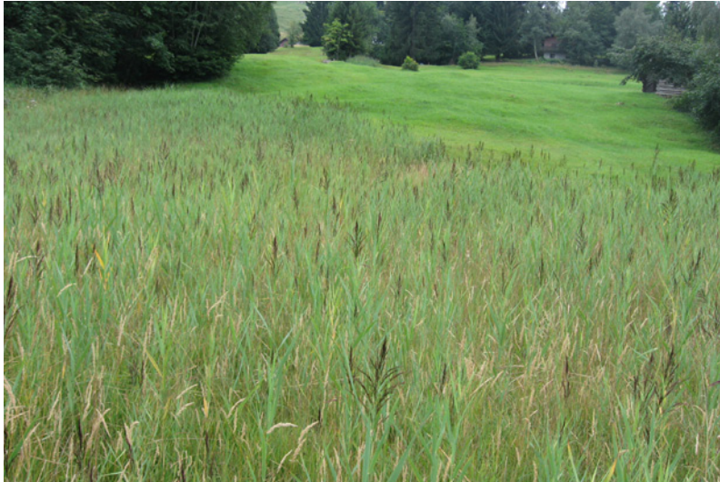
Abb. 3: Fallenstandort d1 (Hang-Flachmoor, gemäht)