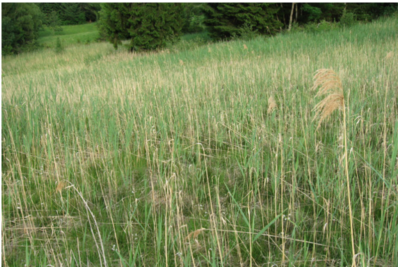
Abb. 4: Fallenstandort d2 (Hang-Flachmoor, bultig, verschilft)