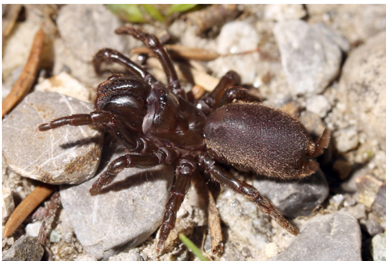
Abb. 9: Atypus piceus

Um die (natürlich schon weitgehend bekannte) Auswirkung von intensiver agrarischer Nutzung auf Spinnenzönososen auch für das Untersuchungsgebiet zu dokumentieren, wurde eine eutrophierte Kunstwiese (g2) besammelt. Die Artenvielfalt ist hier erwartungsgemäß deutlich reduziert. In der Ausbeute der Barberfallen sind trotz hoher Gesamtfangzahl (N=1213) nur 26 Arten vertreten. 69 % des Materials entfallen dabei auf die praticol-agricole 124 Pachygnatha degeeri . Mit größerem Abstand folgen weitere Vertreter dieser ökologischen Gruppe: 137 Pardosa palustris (9 %) und 96 Erigone dentipalpis (7 %). Auch im (sub-)rezedenten Bereich überwiegen die störungstoleranten Arten des Intensiv-Kulturlandes (71 Tiso vagans , 151 Pardosa pullata ). Lehrreich ist die