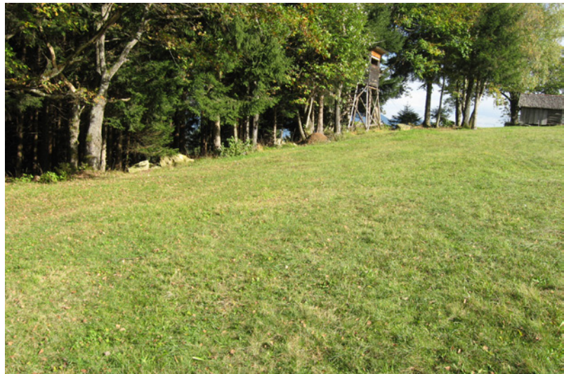
Abb. 6: Fallenstandort f2 (Waldrand)

9♂ 5♀, Magerheuwiesen a1, c1, d4, Waldrand f2, Schotterhügel e1. Aktivitätszeitraum der ♂ Herbst und Frühjahr (diplochron). Eine Art aus der Gruppe der »schwarzbäuchigen« Alopecosa -spp., die im zentralen Alpenraum nur mit zwei recht verstreut gemeldeten Formen vertreten sind (aus N- und S-Tirol ist auch Alopecosa pinitorum belegt). In Österreich kommen weitere Vertreter erst im pannonisch geprägten Gebiet und am südöstlichen Alpenrand hinzu (THALER & BUCHAR 1994). Zum Zeitpunkt der ersten Sichtung auf Stutz-Bazora (31.03.2015) neu für Vorarlberg. Am 13.06.2015 gelang im Rahmen des Tages der Artenvielfalt in Hohenems ein weiterer Fund (1♀, Schuttannen, 1200 m, Wegrand im Wiesengelände), sehr rezent (2016) wurde die Art auch im Saminatal nachgewiesen (jeweils leg. T. Kopf). Lebensraum: kleinräumig strukturierte