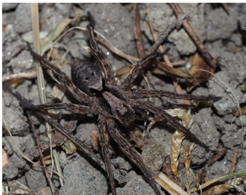
Abb. 7: Alopecosa inquilina

gedrungen. Weitere dem Verf. vorliegende Exemplare stammen vom Eingang des Montafon (Lorüns, 1♂, BF 25.05. bis 21.06.2005, leg. T. Kopf et al.) und aus Liechtenstein (Balzers, 08. bis 13.06.2006, Röhren-Barberfallen, leg. F. Glaser). Gemeinsam mit dem bisher einzigen Nachweis aus N-Tirol vom Reschenpass (THALER 2000) deutet sich somit eine regionale Verbreitungsgrenze entlang von Rätikon und Silvretta an. Lebensraum Magerrasen, Trockenwiesen, wärmebegünstigte Saumbiotope.