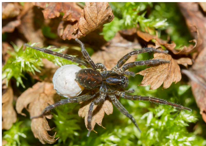
Abb. 10: Pirata hygrophilus

Bei ähnlicher Gesamtfangzahl (d1: 566, d2: 526) und doch recht deutlich abweichender Artenzahl (d1: 41, d2: 50) unterscheiden sich die Flächen erwartungsgemäß sehr typisch in der Reihenfolge der dominanten Arten. An der gemähten Fläche d1 dominiert die störungstolerant-hygrophile 155 Pirata latitans (32%), gefolgt von der Kulturwiesenart 124 Pachygnatha degeeri , (21%). Erst an 3. Stelle findet sich mit 154 Pirata hygrophilus (17%) eine stenotope Auwald- und Moorart. Umgekehrt wird am ungemähten Standort d2 die Dominanzspitze von 154 Pirata hygrophilus (27%) gebildet, gefolgt von 155 Pirata latitans (19%), während 124 Pachygnatha degeeri hier, den vergleichsweise naturnahen Bedingungen entsprechend, auf ein einzelnes Exemplar reduziert ist. Die stenotope Moorart 157 Trochosa spinipalpis ist hingegen in beiden Flächen ähnlich