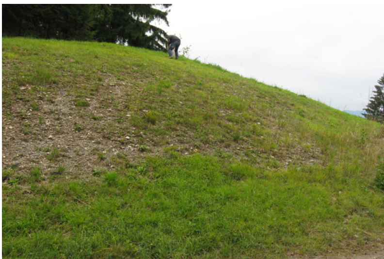
Abb. 5: Fallenstandort e1 (Schotter-Pionierfläche)

Im Gesamtergebnis dominieren erwartungsgemäß weitverbreitete und kommune Formen. Elf Arten sind mit mehr als 100 Individuen am Gesamtfang beteiligt und stellen gemeinsam 61 % des Gesamtfanges. Darunter finden sich triviale Elemente des Kulturgrünlandes (124 Pachygnatha degeeri , 17 %, häufigste Art der Untersuchung, 150 Pardosa palustris , 151 Pardosa pullata ), thermophile Bewohner des offenen Geländes und von extensiv genutzten Wiesenbereichen (143 Alopecosa pulverulenta ), sowie weitverbreitete und kommune Elemente von Feuchtstandorten (154 Pirata hygrophilus , 155 Pirata latitans ) und eine Reihe von in Mitteleuropa überall häufigen Wald- und Waldrandarten (92 Centromerus sylvaticus , 149 Pardosa lugubris , 158 Trochosa terricola , 175 Coelotes inermis ). 167 Hahnina pusilla weist ein recht breites Habitatspektrum auf und kommt sowohl in offenem Gelände wie auch in Waldhabitaten in vorzugsweise extensiv genutzten Bereichen vor.