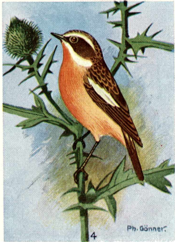
1. Singdrossel, 2. Steinschmätzer ♂, 3. Schwarzkehlchen ♂, 4. Braunkehlchen ♂. Alle \frac{2}{3} nat. Größe.

Probekbild aus dem Werk von Sebastian Pfeifer: „Die Vögel unserer Heimat“. Herausgegeben von der Senckenbergischen Naturforschenden Gesellschaft. Das Werk enthält 65 Buntbilder nach Gemälden von Ph. Gönner, 41 seltene Nestsufnahmen von E. Keim, 4 farbige Eiertafeln und 70 Abbildungen auf 260 Textseiten. Preis: Ganzleinen gebunden RM. 4,60. Durch alle Buchhandlungen zu beziehen. Verlag W. Kramer & Co., Frankfurt am Main NO 14.