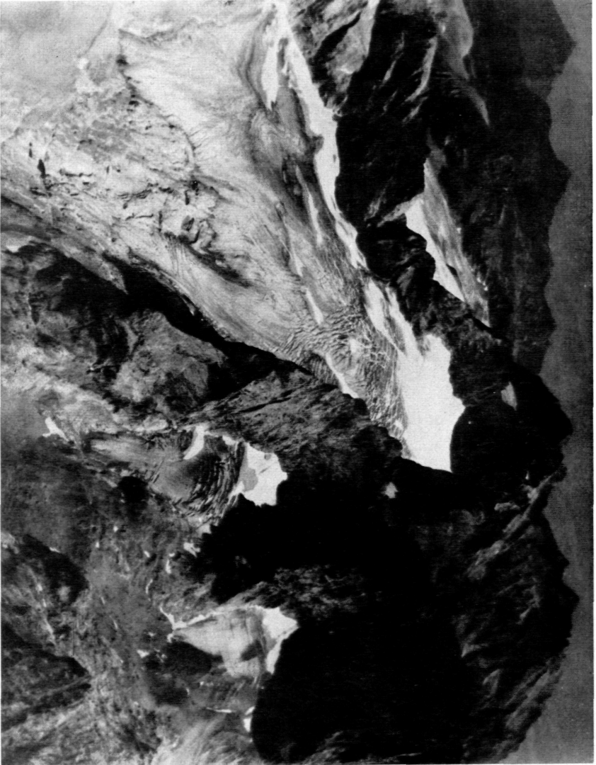
Bild 2. Der Große und Kleine Gosau- sowie der Nördliche Torsteingletscher am 1. September 1951.