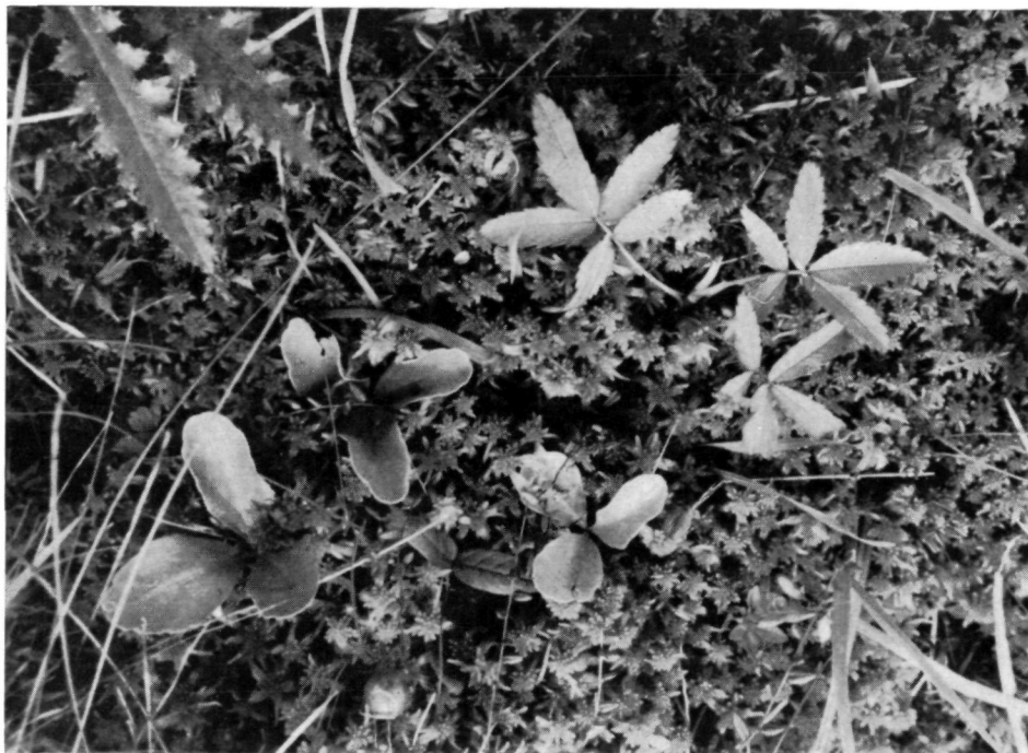
Abb. 3: Menyanthes trifoliata und Potentilla palustris über Sphagnen am Rande einer Hochmoorschlenke