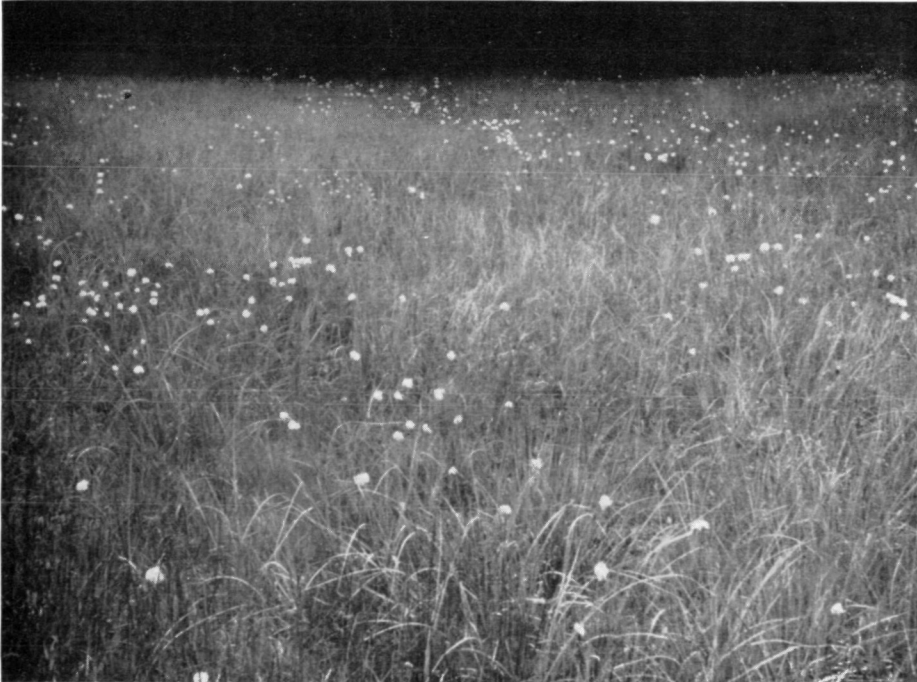
Abb. 2: Eriophorum vaginatum in einem entwässerten Hochmoor. Carex nigra und C. brizoides haben sich sehr stark verbreitet