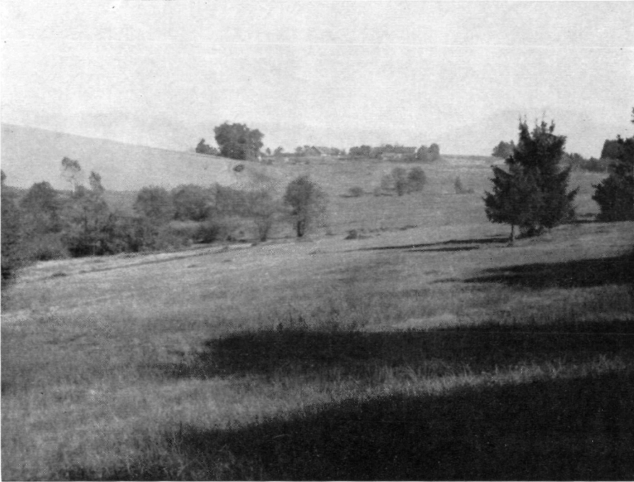
Abb. 1: Ausschnitt aus Moor 1 bei Berndorf vor der Entwässerung