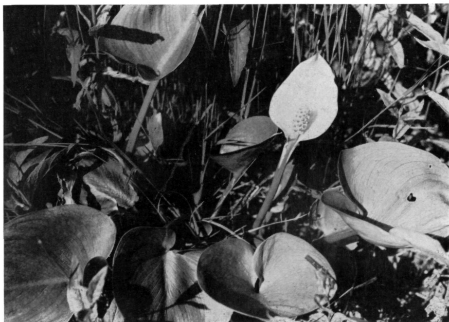
Abb. 4: Calla palustris