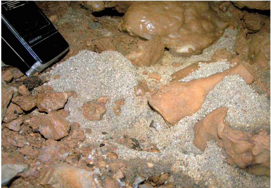
Abbildung 1: Bimsnester zwischen Gesteins- und Sinterschutt unterhalb der Knöpfchenhalle; Photo: I. Dorsten (2006).