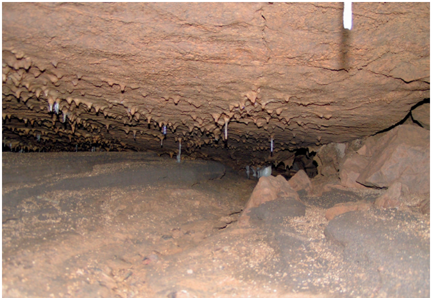
Abbildung 2: Trockenes Gerinne mit Anschnitt von schwarzen vulkanischen Schichten und Bims, Höhe des Bildausschnitts ca. 80 cm; Photo: I. Dorsten (2006).