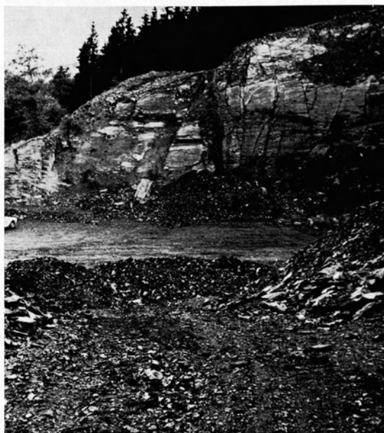
Abb. 2. Nördliche Bruchwand. Basaltgang in der Mitte. Im Vordergrund auf der Wegsohle dunkler Farbstrich, Basalt bzw. Basaltzersatz im Fortstreichen des Ganges nach Süden.