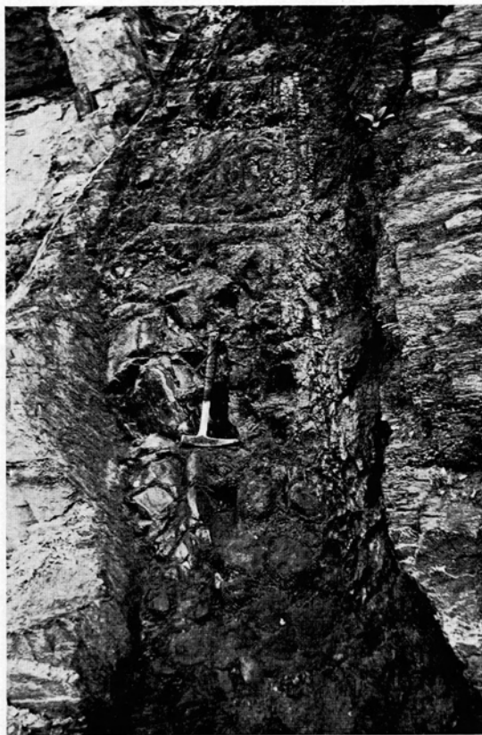
Abb. 3. Basaltgang an der nördlichen Bruchwand. Basalt in der liegenden Partie des Ganges kugelig-schalig zersetzt, zum Hangenden plattig. Breite der Spalte 90 cm.