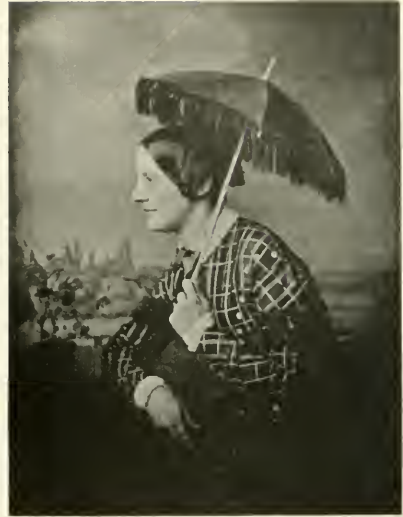
2] Jenny Lind, Sängerin, die „schwedische Nachtigall“, geb. 6. Oktober 1821 zu Stockholm, gest. 2. November 1887 in England Aufnahme von W. Breuning, Hamburg.