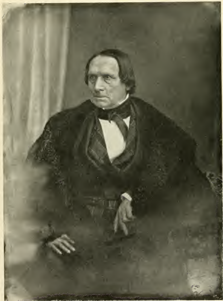
Peter von Cornelius, Maler, geb. 23. September 1783 zu Düsseldorf, gest. 6. März 1867 zu Berlin.