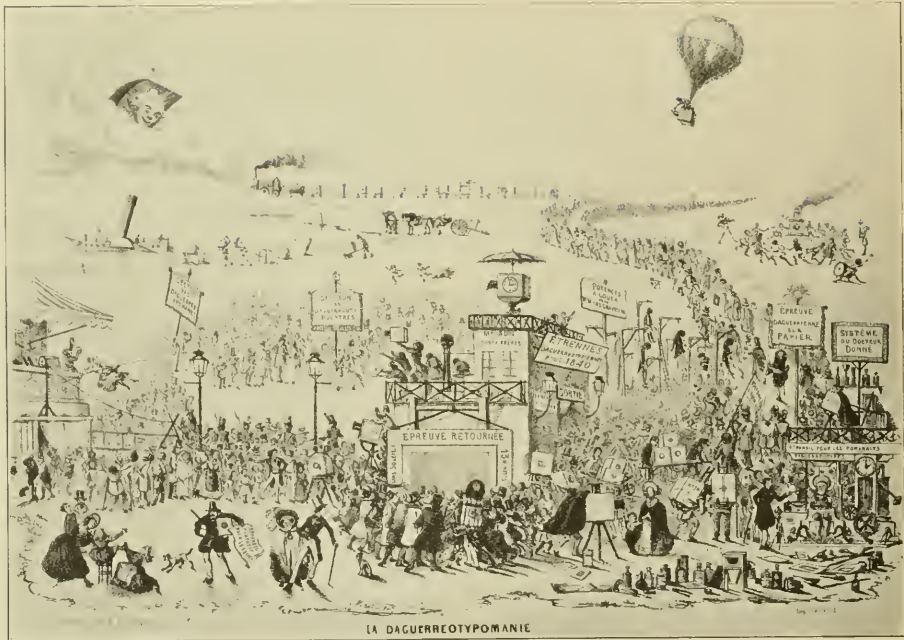
Karikatur von Maurisset 1839 (s. S. 36/37).