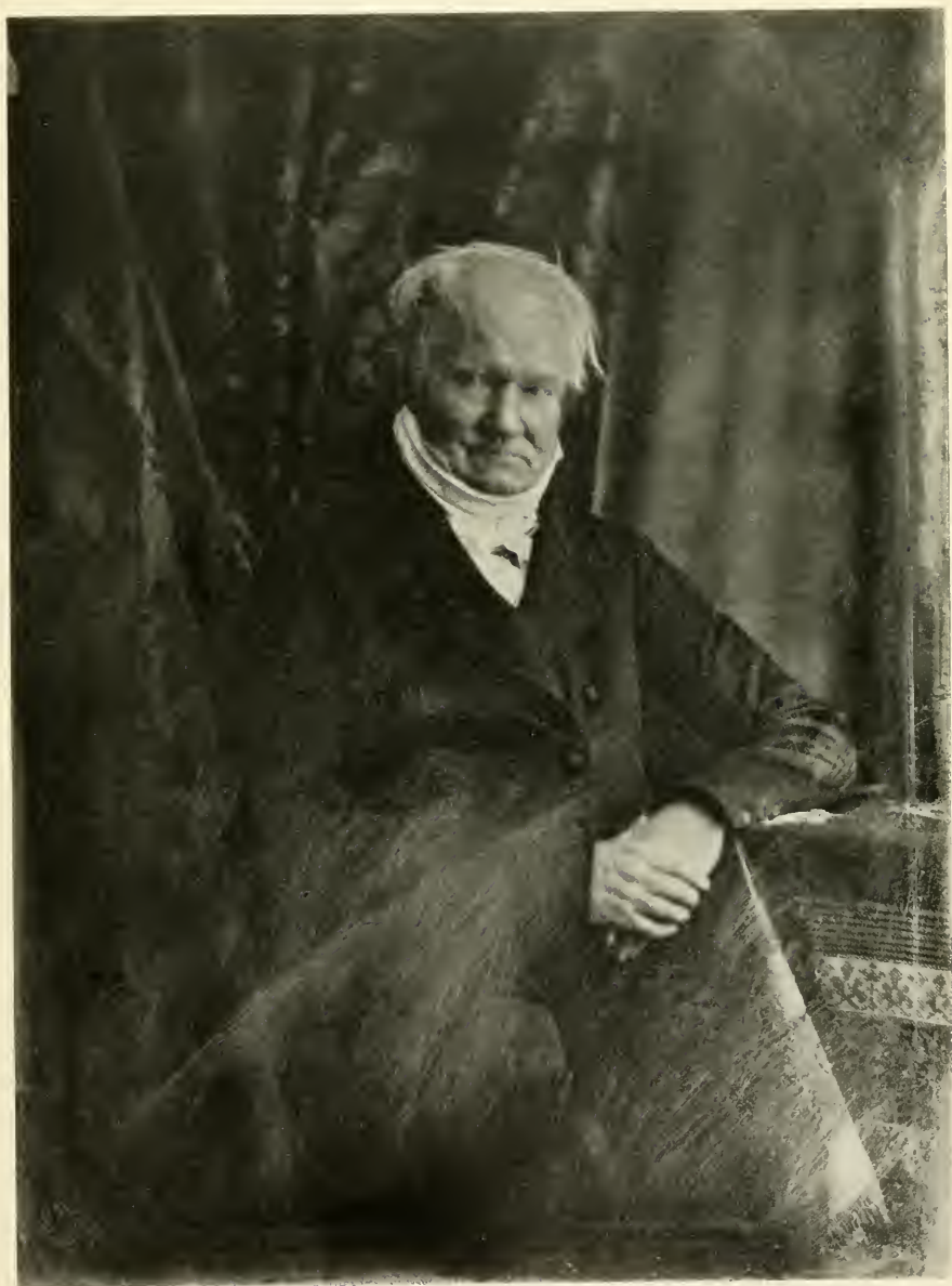
Alexander von Humboldt, geb. 14. September 1769 zu Berlin, gest. daselbst 6. Mai 1859. Aufnahme von H. Biow, 1847 in Berlin.