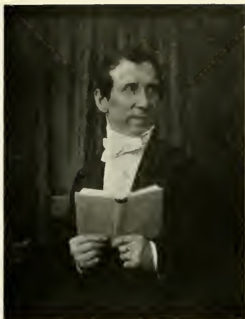
1] Andres Krüß, geb. 21. März 1791 auf Helgoland, gest. 25. Oktober 1848 zu Hamburg.