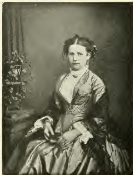
2] Unbekannte Dame mit seidnem Kleid.