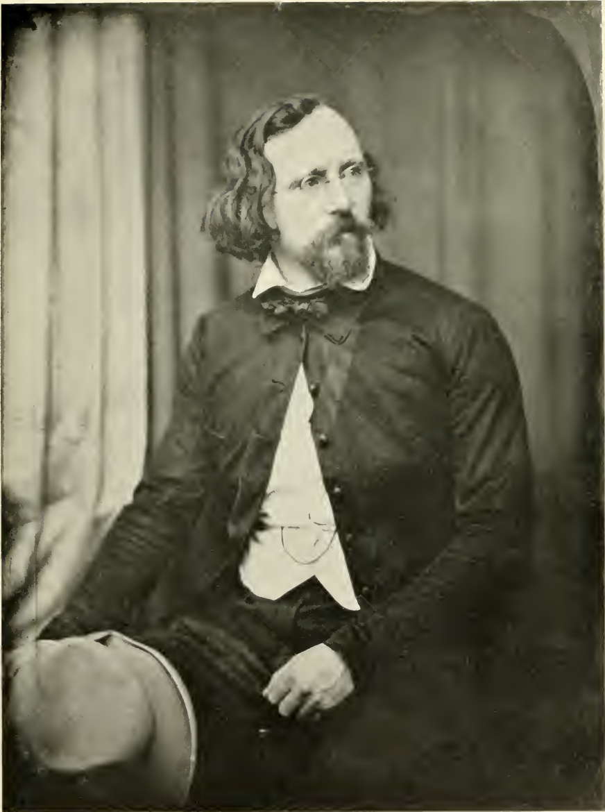
Jakob Venedey, Mitglied der Nationalversammlung in Frankfurt a. M., Abgeordneter für Homburg.