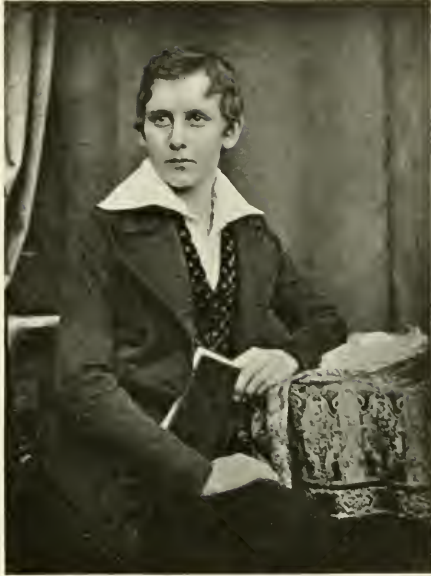
1] Charles Ami de Chapeaurouge (Senator in Hamburg 30. Dezember 1867), geb. 28. April 1830, gest. 30. September 1897. Aufnahme von H. Biow, Hamburg, um 1846.