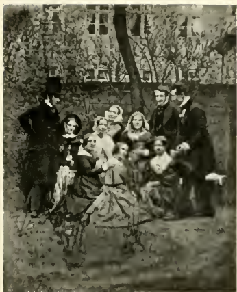
1] Eine fröhliche Gesellschaft in St. Pauli. Freilichtaufnahme von C. F. Rochow, St. Pauli Circus, Hamburg.