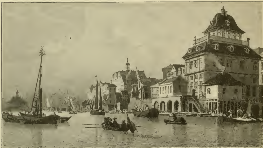
Das Baumhaus (rechts) von der Wasserseite und das Blockhaus.

Nach einer Lithographie von Valentin Ruhs, Hamburg (im Staatsarchiv).