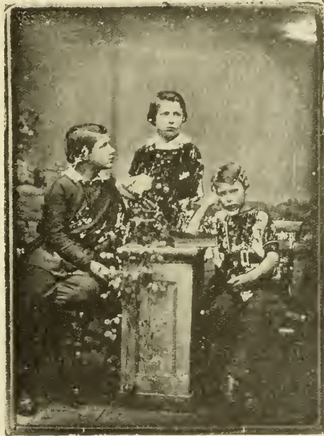
Gewaltsam geputztes und abgeblättrtes Silberbild.

Je nach dem Aussehen des Silberbildes hat mithin die Wiederherstellung zu geschehen. Man nehme zuerst das in der Regel auf der Rückseite mit dem Papier- oder Metallrahmen