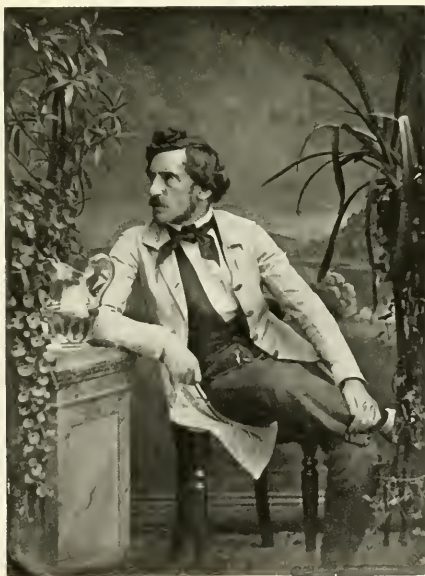
3] Carl Ferdinand Stelzner, Bildnismaler und Daguerreotypist, geb. 1805 (†) zu Flensburg (†), gest. 1894 zu Hamburg.