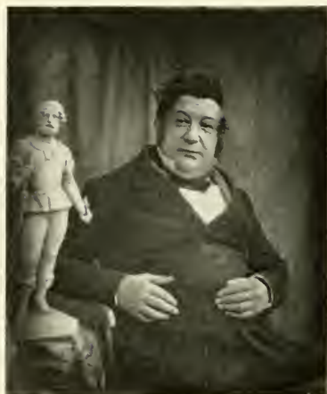
1] Carl Heinrich Kitzerow, Dekorationsmaler und Bildniszeichner auf Stein, geb. 13. Febr. 1799 zu Hamburg, gest. 11. Febr. 1874 zu Mailand.