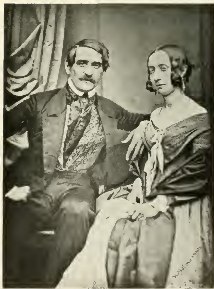
4] Unbekanntes Ehepaar. Bez.: H. Biow 1844.