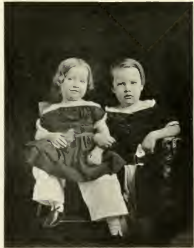
4] Unbekanntes Geschwisterpaar.