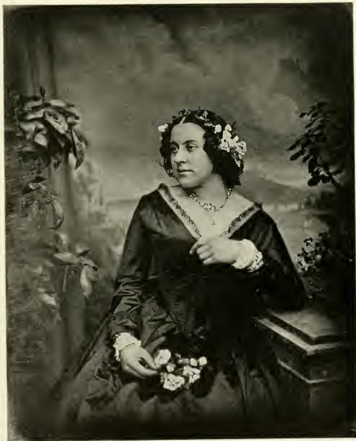
Bildnis einer Unbekannten.