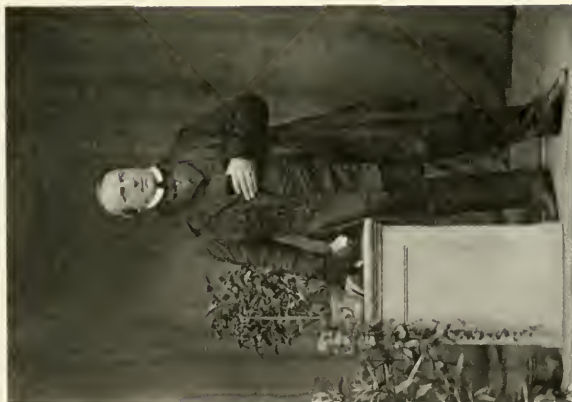
1 | Karl Krebs, Kapellmeister, geb. 1804 zu Nürnberg, gest. 1880 zu Dresden. Aufnahme von J. Völlner, Hamburg, um 1845.