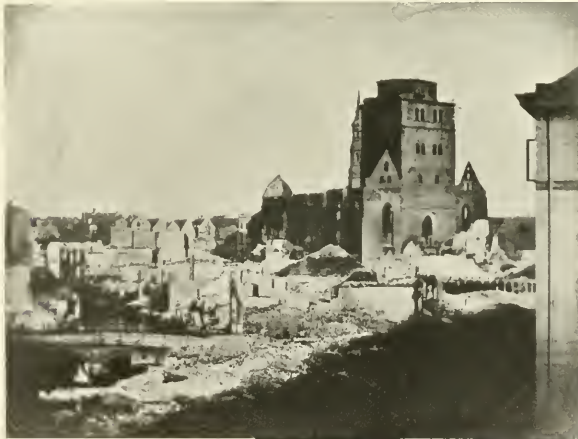
Blick auf die Ruinen der Nikolaikirche.

Im Vordergrund die kleine Alster mit den Ruinen der Altenwallstraße. Links der Börse das stehengebliebene Eckhaus der Schauenburgerstraße. Rechts hinter der Börse der Jakobikirchturm, links davon die Ruine des Petrikirchturms. Auf der linken Bildhälfte in der Ferne der St. Georger Kirchturm.