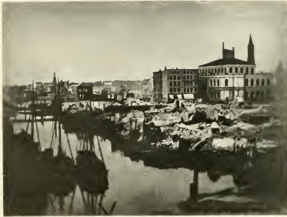
Blick auf die neue Börse.

Im Vordergrund die kleine Alster mit den Ruinen der Altenwallstraße. Links der Börse das stehengebliebene Eckhaus der Schauenburgerstraße. Rechts hinter der Börse der Jakobikirchturm, links davon die Ruine des Petrikirchturms. Auf der linken Bildhälfte in der Ferne der St. Georger Kirchturm.