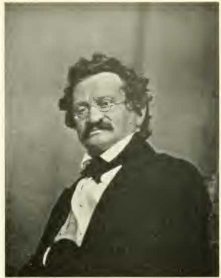
2] Moritz Gottlieb Saphir, Schriftsteller und Satiriker, geb. 1795, gest. 1858. Aufnahme von F. Stelzner, Hamburg 1843.