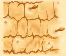
Fig. 5 b