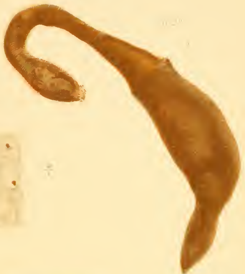
Fig. 2 a