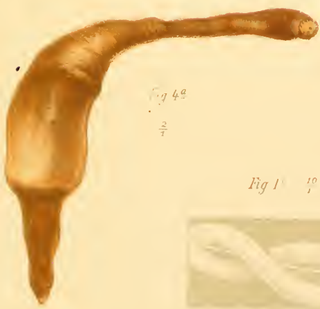
Fig. 4 a