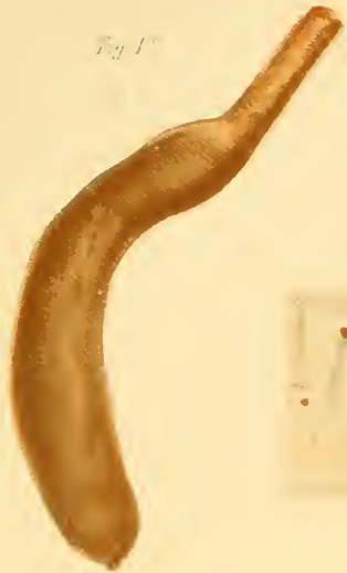
Fig. 1 a

Zum Jahrbuch über das Naturhistorische Museum zu Hamburg für 1885.