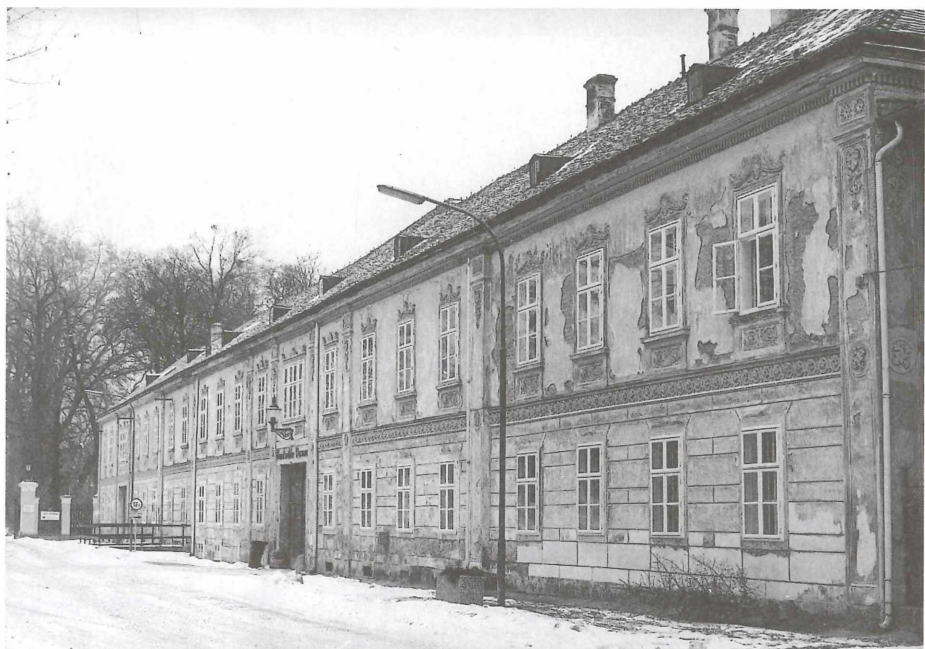
Abb. 12: Die Mühle in Dornau bei Leobersdorf