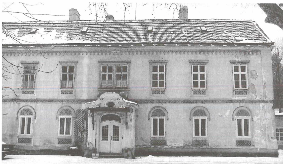
Abb. 13: Das Herrenhaus in Waldegg

etwas willkürlich übereinander geratene Etagen zweier verschiedener Gebäude anmuten (Abb. 14).