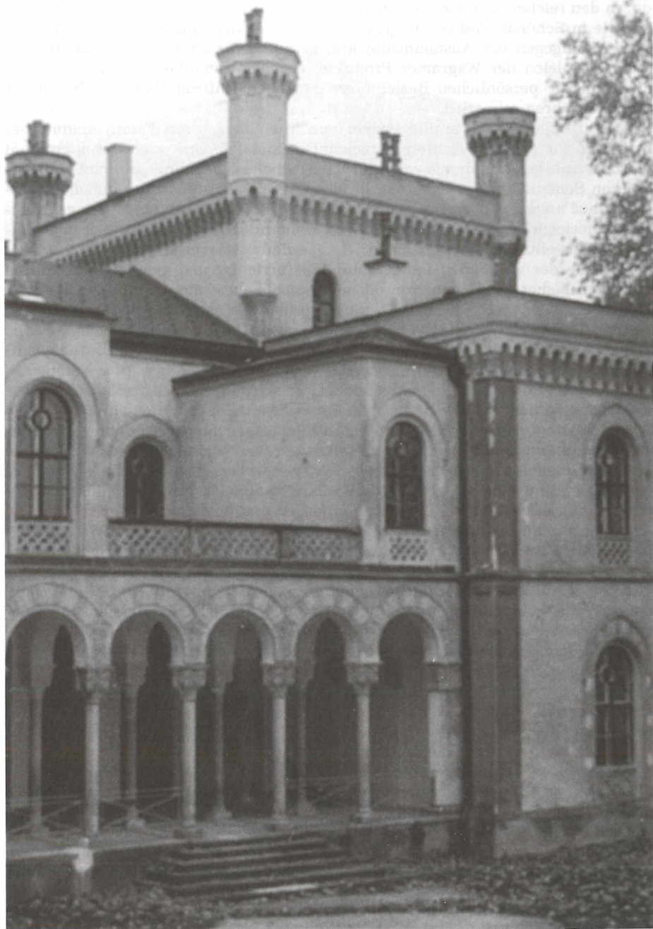
Abb. 2: Ludwig Förster, Theophil Hansen Villa Pereira in Altenberg an der Donau