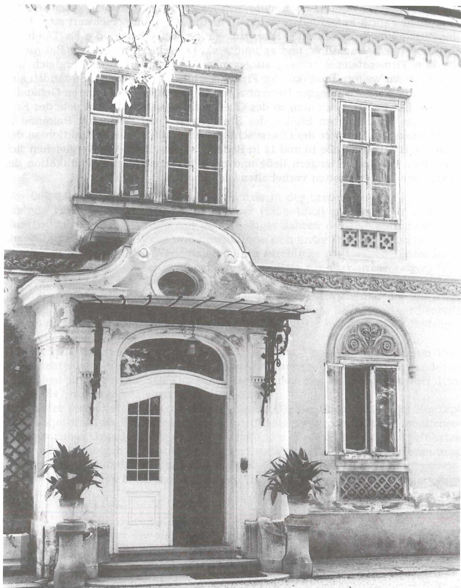
Abb. 14: Fassadendetail des Herrenhauses in Waldegg

Im Gegensatz zur Firma Wienerberger, deren Warenkataloge sich ziemlich oder ganz vollständig erhalten haben und über das breitgefächerte Sortiment von 1858