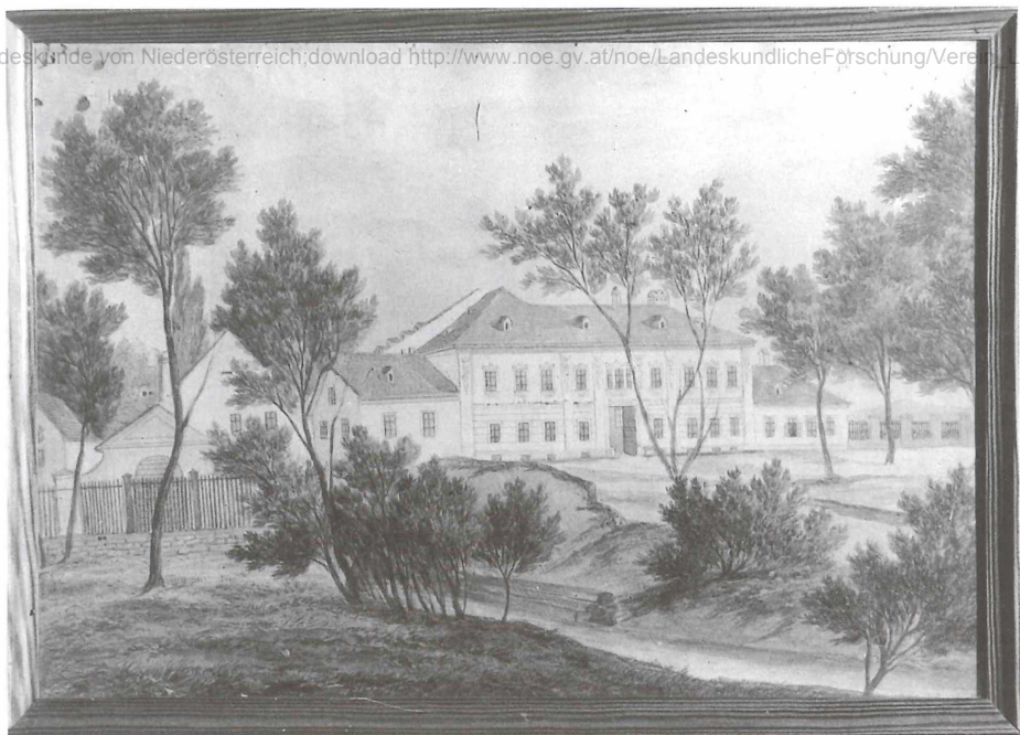
Abb. 11: Unbekannter Biedermeieraquarellist Die Mühle in Dornau bei Leobersdorf (um 1850)

könnte, da man von jedem Terrakotta-Versatzstück einige Exemplare am Dachboden auf Lager gelegt hat – wo sie sich heute noch befinden. 38)