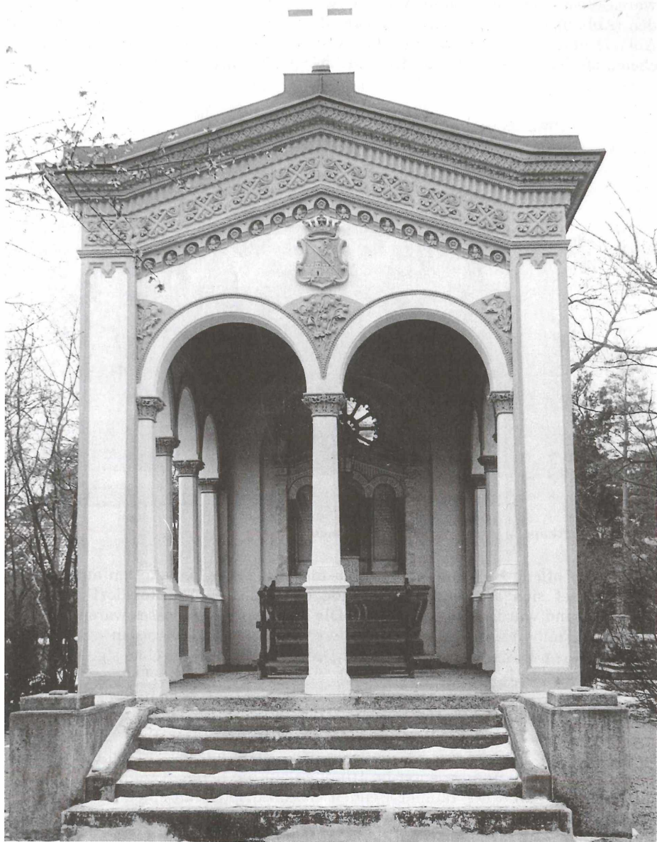
Abb 3: Gruftkapelle der Familie Pacher von Theinburg, Schönau an der Triesting (1847)

Wagram 1847 – wobei nach Fernkorn hier nach Fernkorns Modell meint. Unter den zahlreichen, dem Verfasser bisher bekanntgewordenen Ausgaben dieser – für die österreichische Skulptur am Beginn des Historismus bedeutenden – Madonna