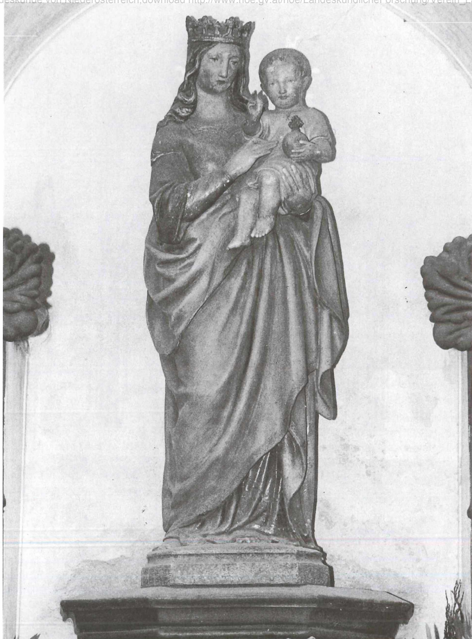
Abb. 6: Anton Dominik Fernkorn Madonna mit dem Christuskind; Pfarrkirche St. Stephan, Baden

Architektur anzuwenden, sind es im allgemeinen schlichte, kubische Baukörper, die an den entsprechenden Stellen mit dekorativen Details versehen werden. Das