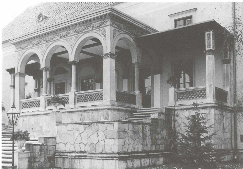
Abb. 10: Die Loggia des Schlosses Weikersdorf (1859)