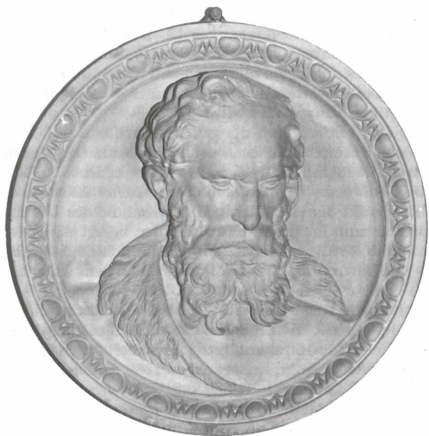
Abb 1: Victor Brausewetter 1813–1899 Portraitrelief (Terrakotta) von Anton Domik Fernkorn. Um 1847

erinnerungen geschriebenes, lebendiges Bild ihres bedeutenden Vorfahren und damit die bisher ausführlichste Lebensbeschreibung des Fabrikanten. 13)