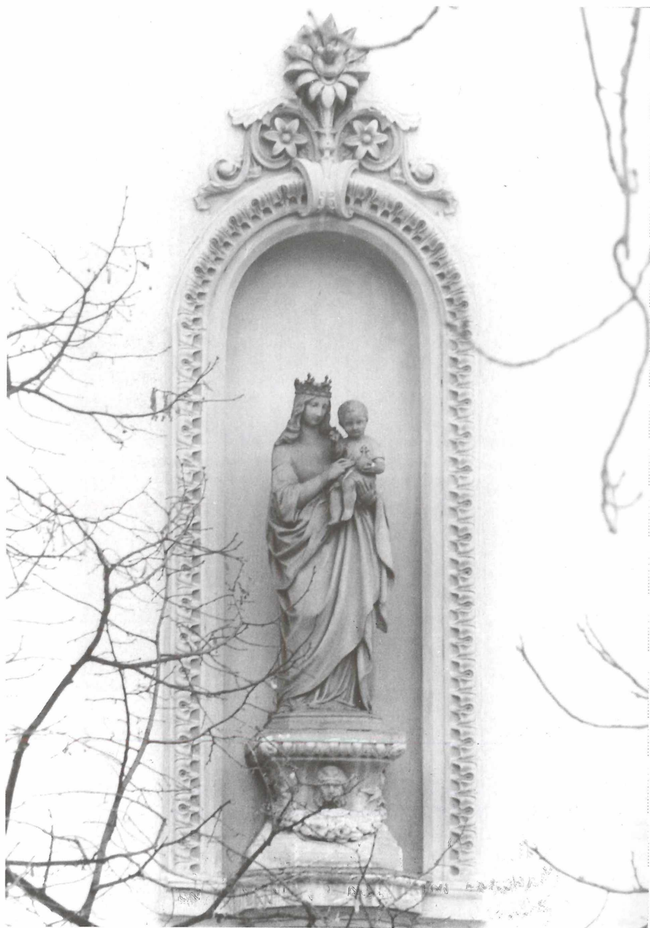
Abb. 7: Anton Dominik Fernkorn Madonna mit dem Christuskind; Pfarrkirche Bad Vöslau