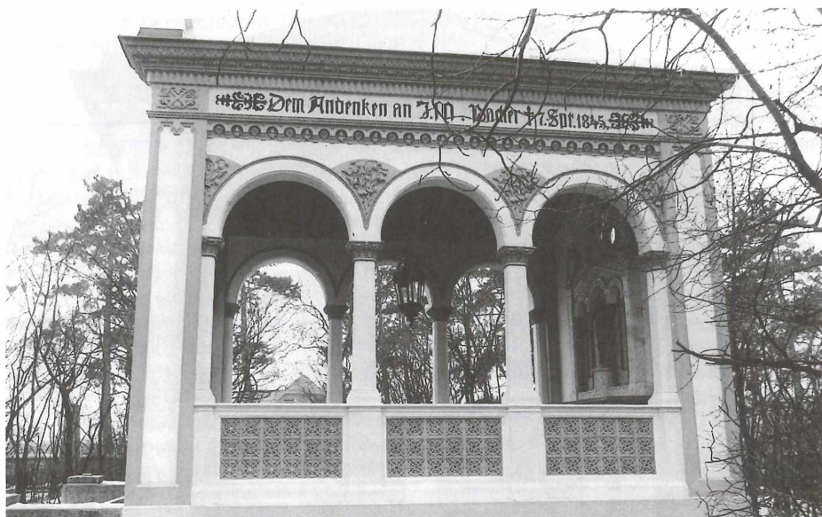
Abb. 4: Gruftkapelle (wie Abb. 3), Seitenansicht

wären etwa noch die bemalte Version am Chorhaupt der Stephanskirche in Baden (Abb. 6), die ungefaßten Exemplare der Pfarrhöfe von Bad Vöslau (um 1870, Abb. 7) und Kottingbrunn (um 1900, Abb. 8) oder die entlegeneren, silberbestrichenen, an der Ortskapelle von Großhaslau bei Zwettl (Abb. 9) zu erwähnen.