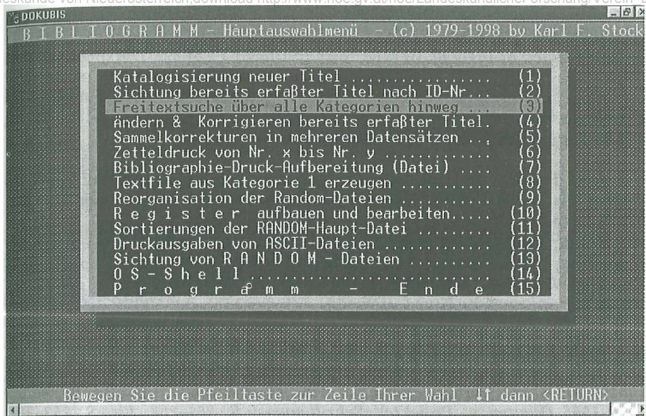
Abb. 4: Hauptmenü des Bibliographie-Programmes BIBLIOGRAMM