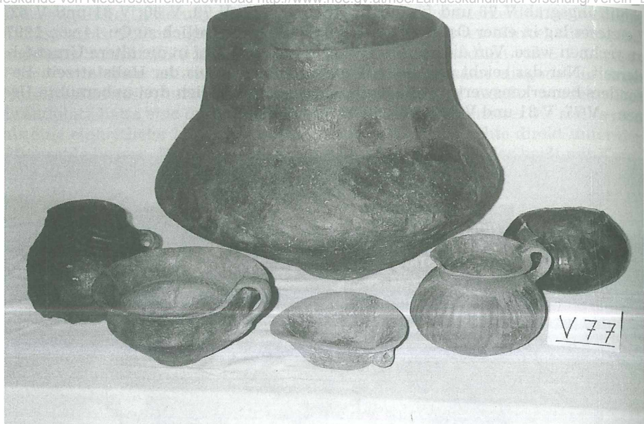
Abb. 2: Restauriertes Keramikensemble vom Urnengrab V 77; große Zylinderhalsurne mit verschiedenen Töpfen, Tassen und Schalen als Grabbeigaben.

schmuck. 22) Neben einer zweiteiligen Blattbügelfibel, mit einfachem Sanduhrmuster, vom Typus Gemeinlebern wurden dem Kind noch ein rundstäbiger Armreif, drei verschiedene Bronzeknöpfe bzw. -buckel und Teile von Spiralröllchen, die wahrscheinlich einmal zu einer Kette gehört haben, mitgegeben.