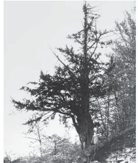
Alte Eibe am Badenstein bei Witzenhausen um 1915

In demselben Jahr erschien eine bemerkenswerte, von Max Zeiske (Kassel) verfasste Arbeit über die Eibe in Hessen. Darin führte der Verfasser eine komplette Bestandsaufnahme der natürlichen Eiben-Populationen in Hessen durch. Er beschreibt die Eibe als einen schon immer auf die Kalkgebiete Nordosthessens beschränkten „echten Waldbaum“, der fast ausschließlich in der unteren Baum-schicht von Laubwäldern, vornehmlich Buchenwäldern, auf Fels- und Steilhängen auftritt. Als wesentliche Gefährdungsfaktoren sieht er die Einführung