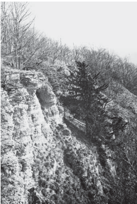
Eibe am Steilhang der Graburg bei Weißenborn um 1915