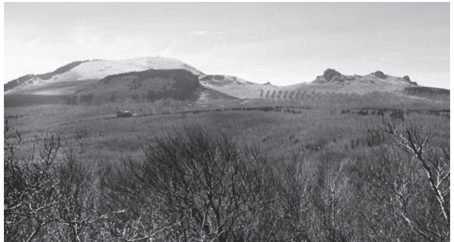
Blick von der später durch Basaltabbau zerstörten Kuppe des Hangarsteins bei Fürstentwald zum Hohen Dörnberg (links) mit dem 1913 unter Naturschutz gestellten Helfenstein (rechts) im Jahr 1908

Der seit 1945 bzw. in seiner heutigen Abgrenzung seit 1981 bestehende Regie-