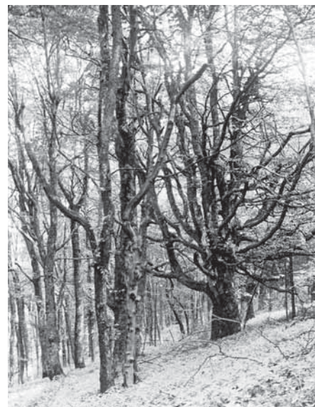
Kesselrain bei Wüstensachsen um 1920

Das direkt an der Grenze zu Bayern auf 760 – 840 m ü. NN gelegene Waldgebiet des Kesselrains bei Wüstensachsen galt bis zum Beginn des 20. Jahrhunderts als einzigartiger Urwaldrest mit hohem Totholzvorrat und bemerkenswerter, montan geprägter Bodenvegetation (SCHAEFER 1913B, HUECK 1926). SCHAEFER (1927A) bezeichnet es als das ehemals „bedeutendste Naturwaldgebiet Mitteldeutschlands“. Die große Naturnähe des Gebietes, das hohe Alter und der bemerkenswerte Stammumfang der Bäume werden bereits im Forstbotanischen Merkbuch (RÖRIG 1905) hervorgehoben. Nachdem der Kesselrain 1911 durch einen Holzabfuhrweg erschlossen worden war, scheiterten die Bemühungen des Bezirkskomitees für Naturdenkmalpflege um eine Verlegung des Weges. Die 1912 geplante Abholzung des Gebietes und Wiederaufforstung mit Fichte konnte verhindert, und die Zusage der Forstverwaltung, wenigstens eine Forstabteilung unberührt zu lassen, zunächst erwirkt werden. Allerdings erfolgte 1925 ein Holzeinschlag im gesamten Gebiet.