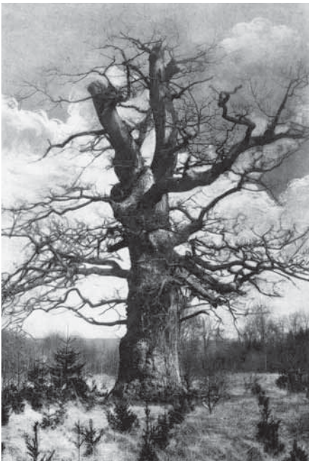
Bei der Sababurg um 1910; Fichtenanpflanzung bedroht Huteeiche.

Zu den wichtigsten Aufgaben des Bezirkskomitees gehörte die Erarbeitung von Vorschlägen zur Pflege und Erhaltung von Naturdenkmälern und die Erarbeitung von Anträgen zur Unterschutzstellung (SCHAEFER 1926B). Die Ausweisung der Schutzgebiete erfolgte in den einzelnen Gebieten – je nach Besitzverhältnissen – auf unterschiedlichem Wege. Wie dies im Einzelnen geschah, welche Schwierigkeiten dabei u. U. zu überwinden waren und welche Rückschläge hingenommen werden mussten, soll im Folgenden am Beispiel einer Auswahl von Gebieten dargestellt werden. Einen Überblick über die bis 1927 unter Schutz gestellten Gebiete geben Karte Seite 63 und Tabelle 1.