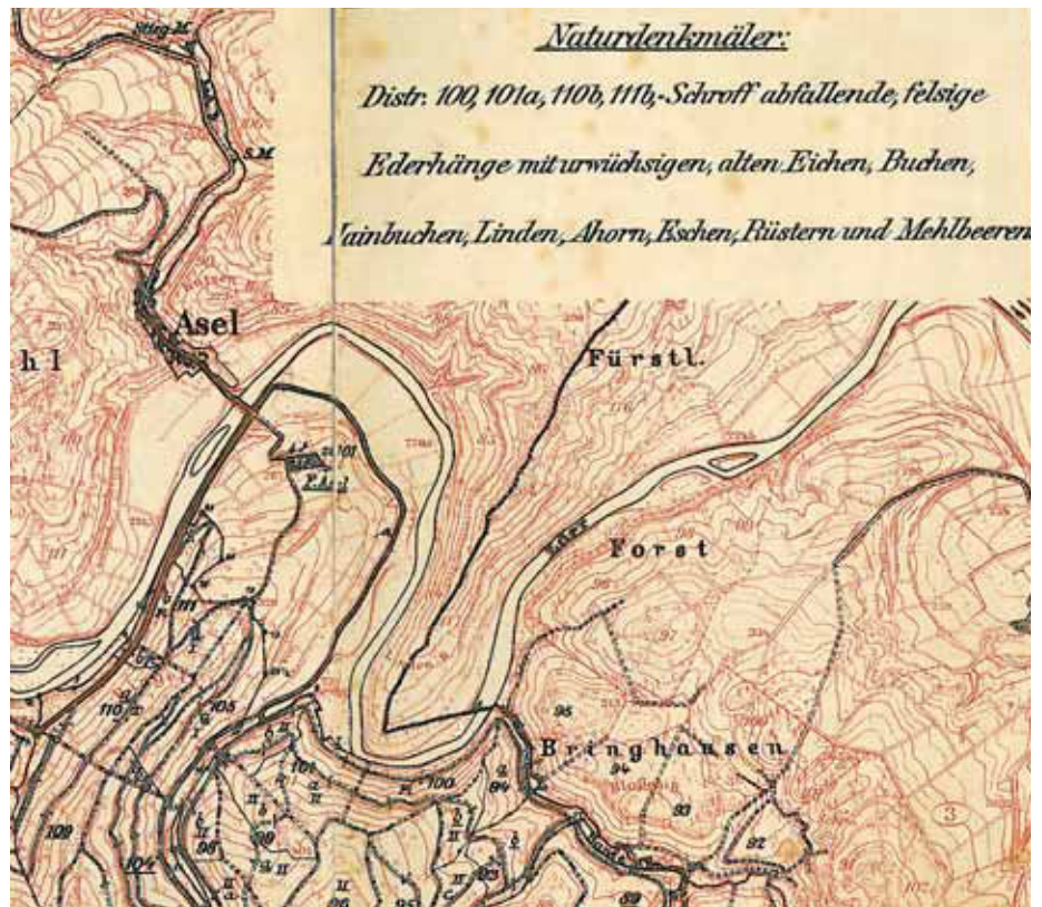
Ausschnitt aus einer vor 1914 entstandenen Forstwirtschaftskarte für die Oberförsterei Altenlotheim mit Auflistung der Naturdenkmäler.

Während des Ersten Weltkrieges und in den wirtschaftlich schwierigen 1920er Jahren erhöhte sich der Nutzungsdruck, insbesondere vonseiten der Steinbruchindustrie und der Forstverwaltung, sodass vom Naturschutz in dieser Zeit eine Reihe schwerer Rückschläge hingenommen werden musste, wie am Beispiel zahlreicher Einzelgebiete gezeigt wird. SCHAEFER (1926a) spricht