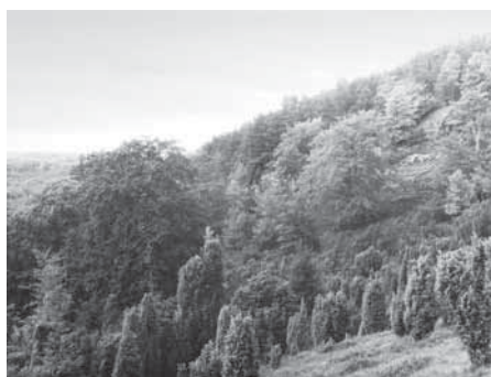
Paradies bei Gellershausen um 1920

Für die ehemalige Hutefläche mit alten Eichen und Buchen verpflichtete sich auf Anregung des Fürsten von Waldeck die Fürstliche Domänenkammer 1911 zu einem Nutzungsverzicht, zunächst bis 1917. Eine Anzahl alter Bäume wurde dann aber 1920 entnommen (ORTLOFF 1926). Auch wenn das „Paradies“ erst 1980 als Naturschutzgebiet (7 ha) ausgewiesen wurde (LÜBCKE 1987), scheint nach 1920 keine forstliche Nutzung mehr stattgefunden zu haben.