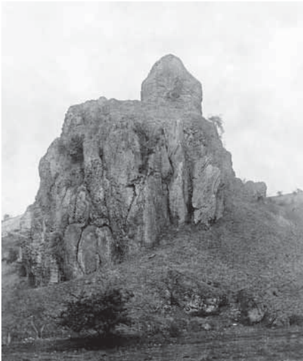
Wichtelkirche um 1910