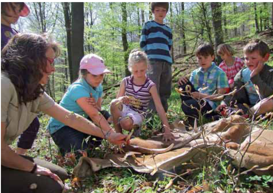
Kinder sind bei geführten Wanderungen besonders zu begeistern.