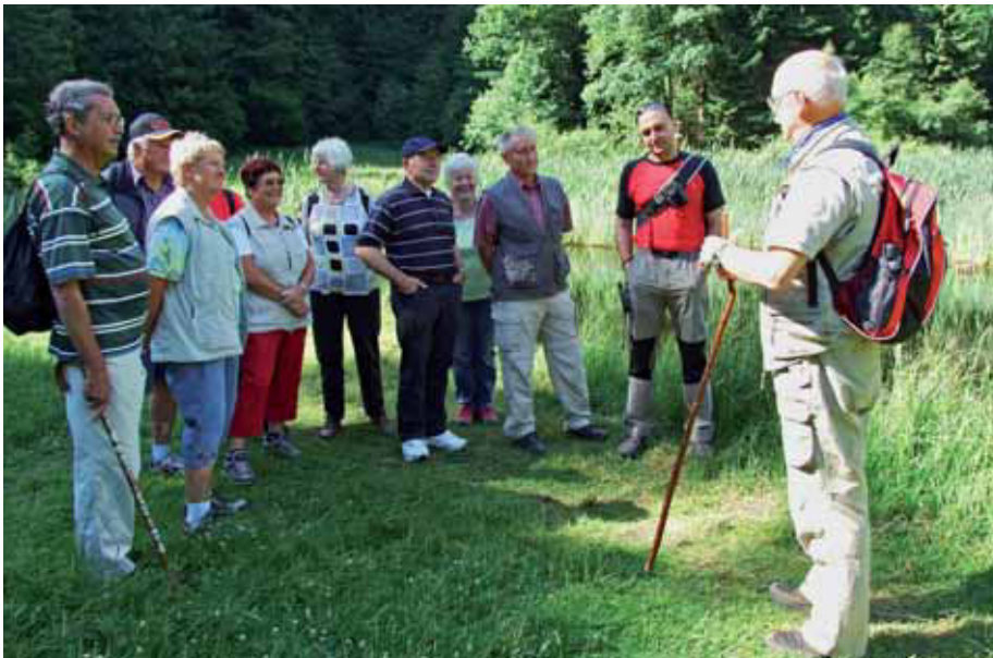
Wanderführer vermittelt interessante Zusammenhänge in der Natur.