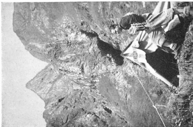
Abb. 3.