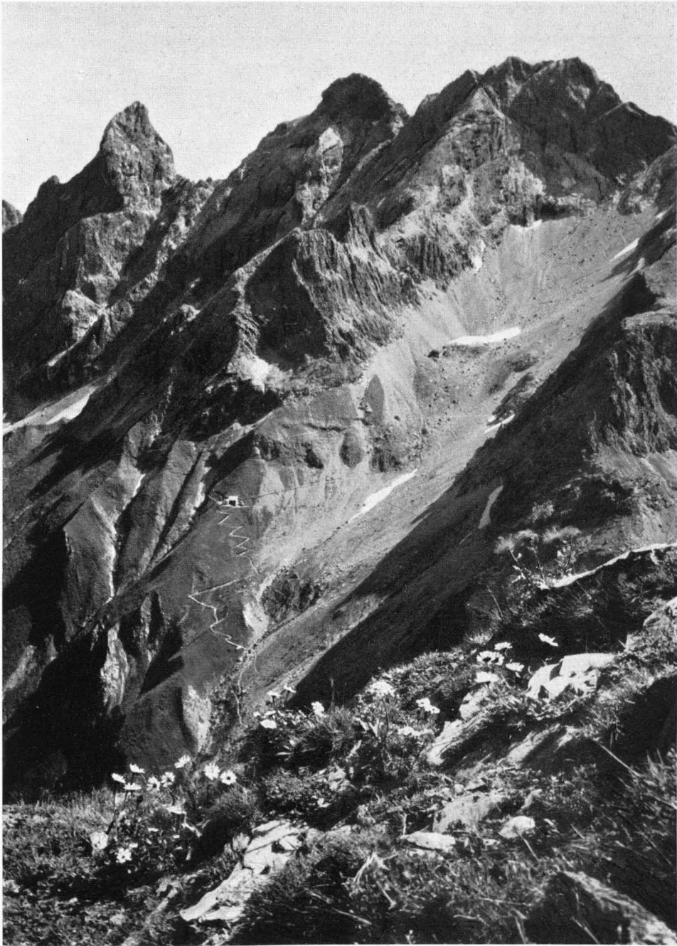
Im Reiche der Trettachspitze