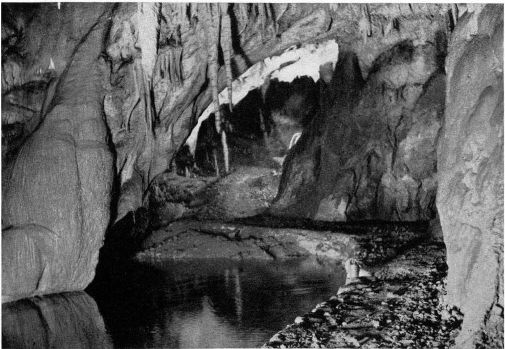
Der Grottenolm (Proteus anguinus) in seiner natürlichen Umgebung