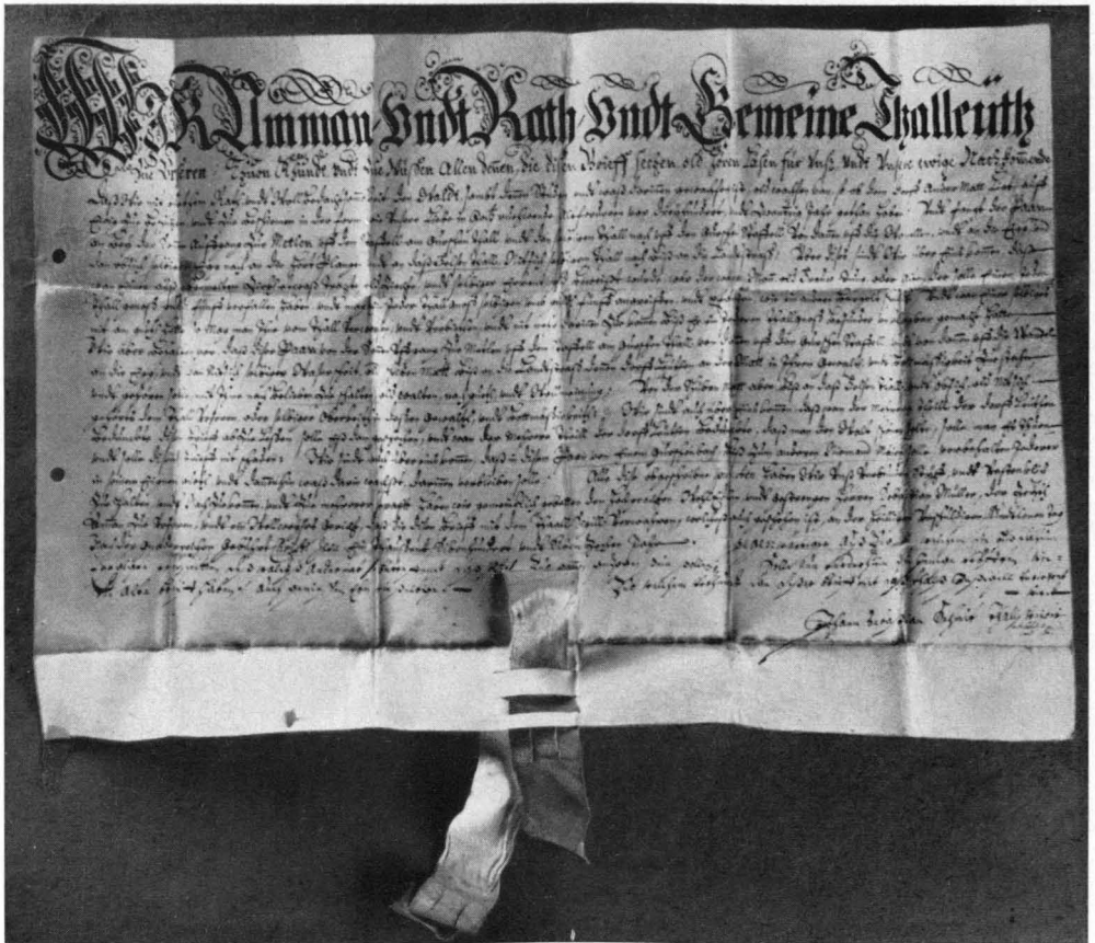
28. Dez. 1717, Erneuerung des Bannbriefes für den Wald ob Andermatt vom Jahre 1397, Pergamenturkunde im Talarchiv der Korporation Urseren in Andermatt, Schachtel 2