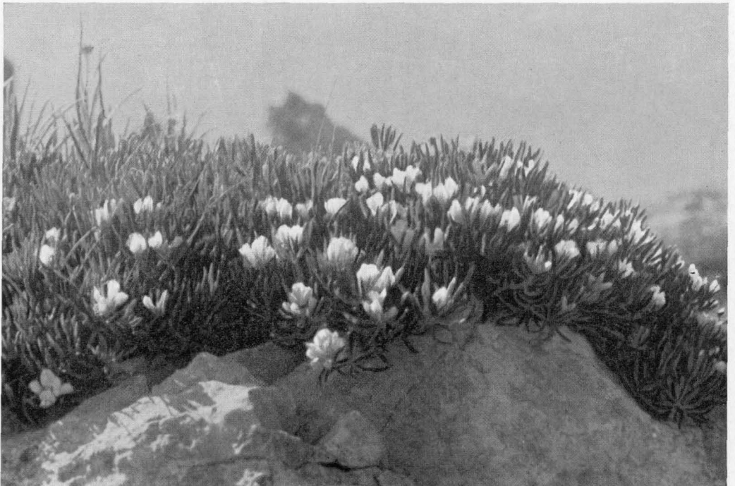
Abb. 4 Genista holopetala