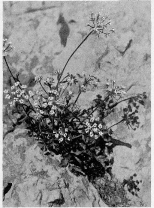
Abb. 13 Hladnikia pastinacifolia