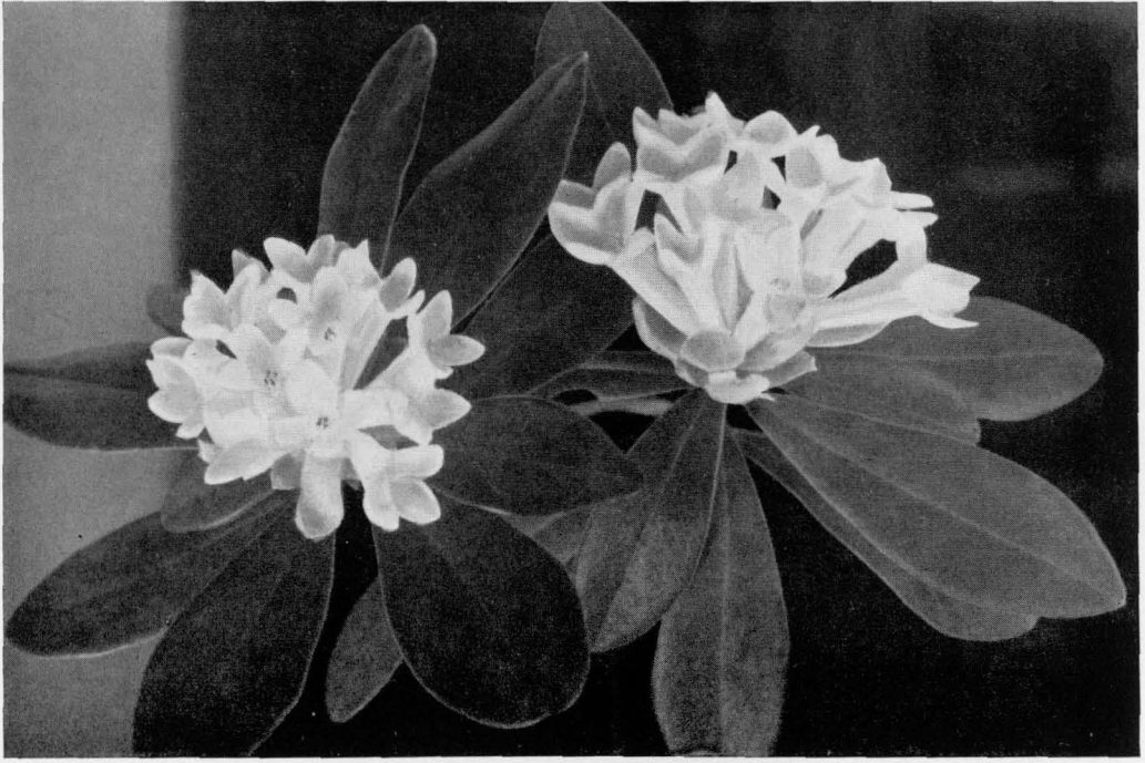
Abb. 1 Daphne blagayana