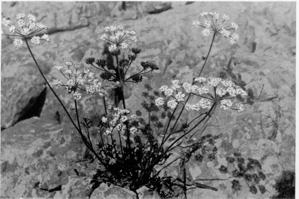
Abb. 14 Hladnikia pastinacifolia

Die Aufnahmen 1 bis 6 sowie 8 und 11 bis 14 von F. Sušnik, Ljubljana