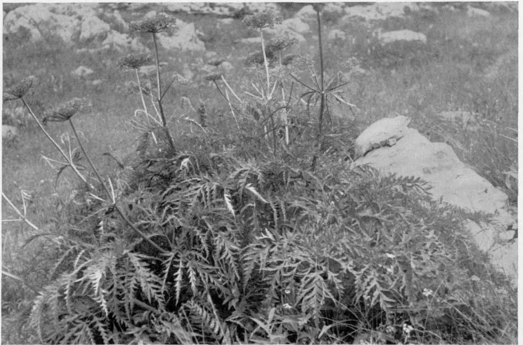
Abb. 8 Molopospermum peloponnesiacum