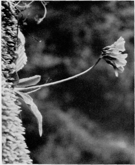
Aufjn. T. Planina, Ljubljana Abb. 10 Primula carniolica