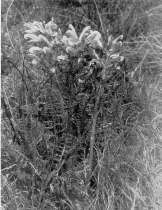
Abb. 3 Pedicularis friderici-augusti