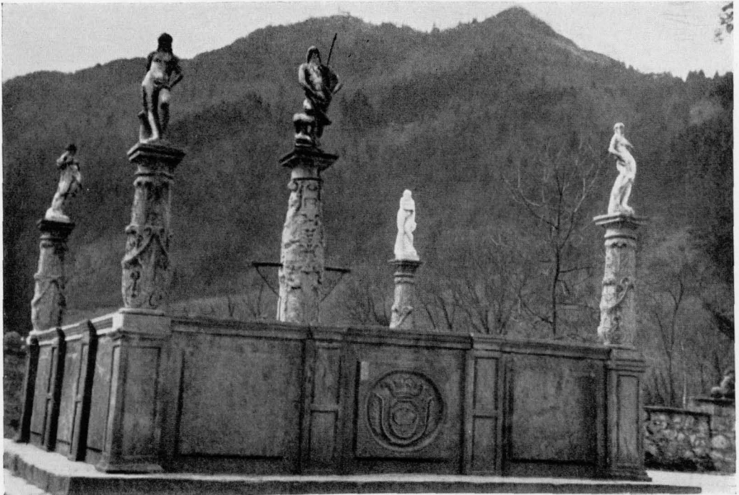
Abb. 2 Lovrenc bei Polhov gradec