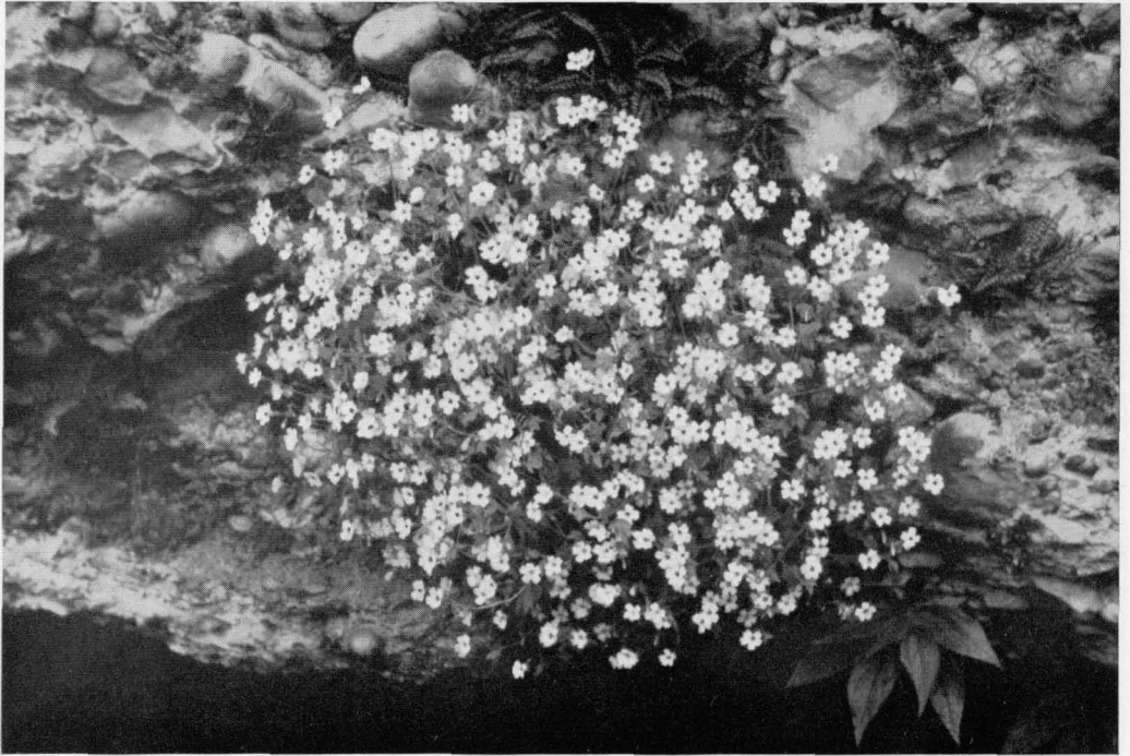
Abb. 7 Saxifraga petraea