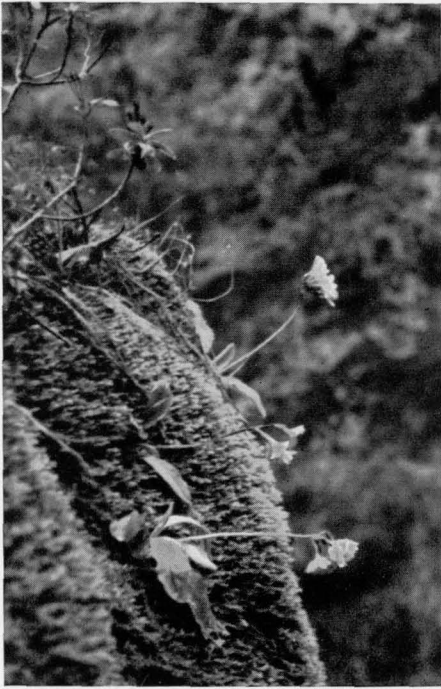
Aufjn. T. Planina, Ljubljana Abb. 9 Primula carniolica