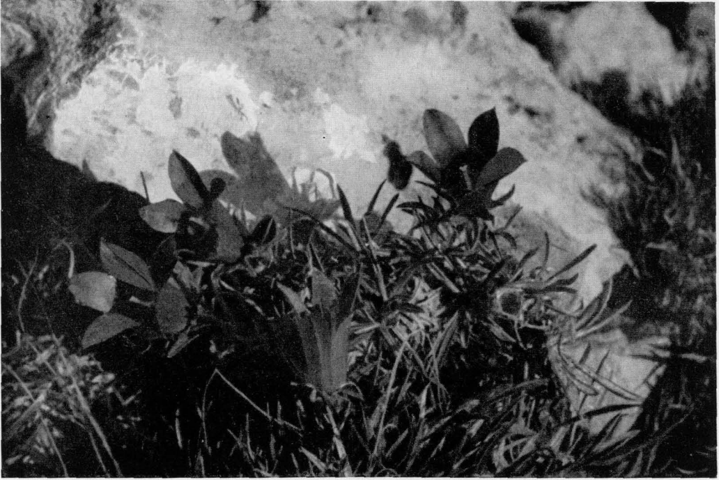
Abb. 5 Edraianthus graminifolius