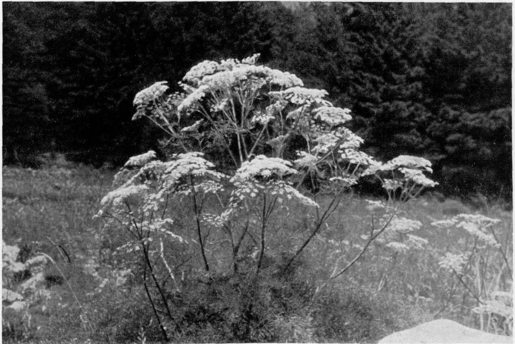
Abb. 6 Ligusticum seguierii