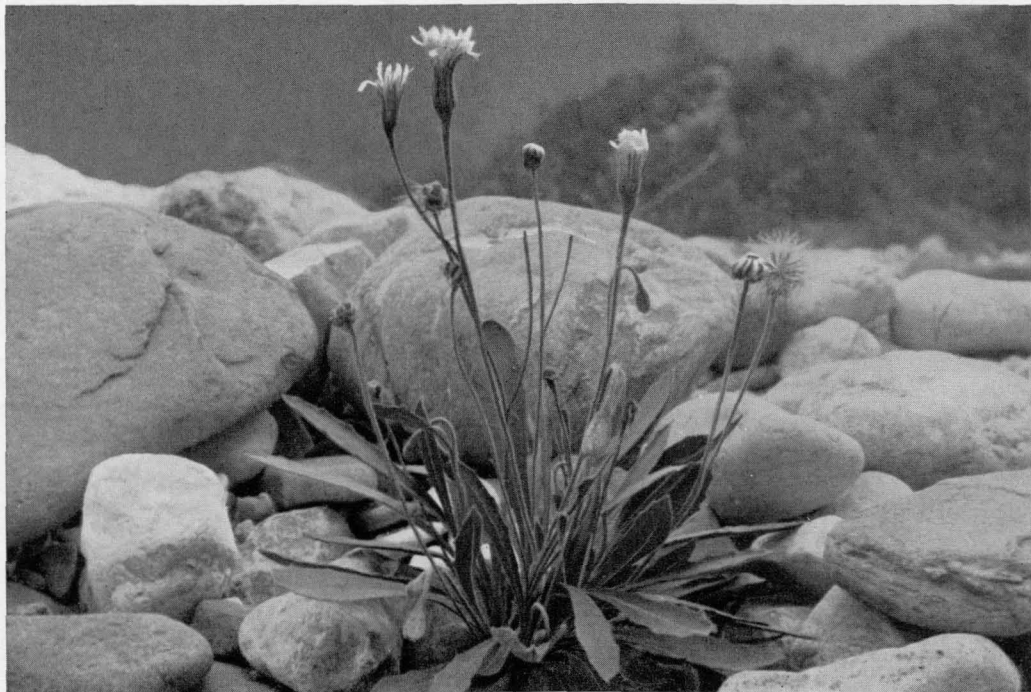
Abb. 11 Leontodon berinii