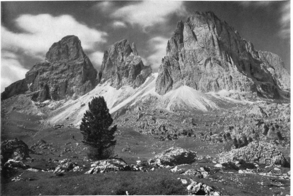
Abb. 3 Hochgelegene Einzelzirbe. Am Südfuß der Langkofelgruppe, nächst dem Sellajoch, bei 2300 m ü. d. M. Zwischen den Bergsturzböcken verstreut noch höher vordringende junge Zirben. (Die Gipfel von links nach rechts: Grohmannspitze 3111 m, Fünffingerspitze 2996 m, Langkofeleck 3081 m)