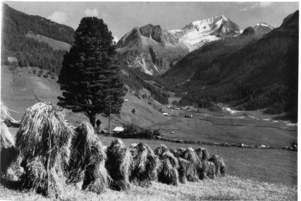
Abb. 2 Der Abschluß des Raintals in der Rieserfernergruppe (Hohe Tauern, Südtirol), vom Dorfe Rain aus gesehen. Rechts über der Bildmitte der Hochgall (3440 m), der höchste Gipfel der Rieserfernergruppe; rechts unter ihm, in die Lücke der hohen Gipfel aufragend, das Tristenköckel (2469 m), auf dessen Gipfel das oberste Zirbenwäldchen der Ostalpen liegt; auf der sanften Abdachung links unter dem Nöckel, fast in der Falllinie unter dem Hochgallgipfel, ist die Alte Kasseler Hütte sichtbar. Im Vordergrund links eine sehr tief (1580 m) gelegene Einzelzirbe, die das Kreuz unter ihr schirmt (Kultbaum?)