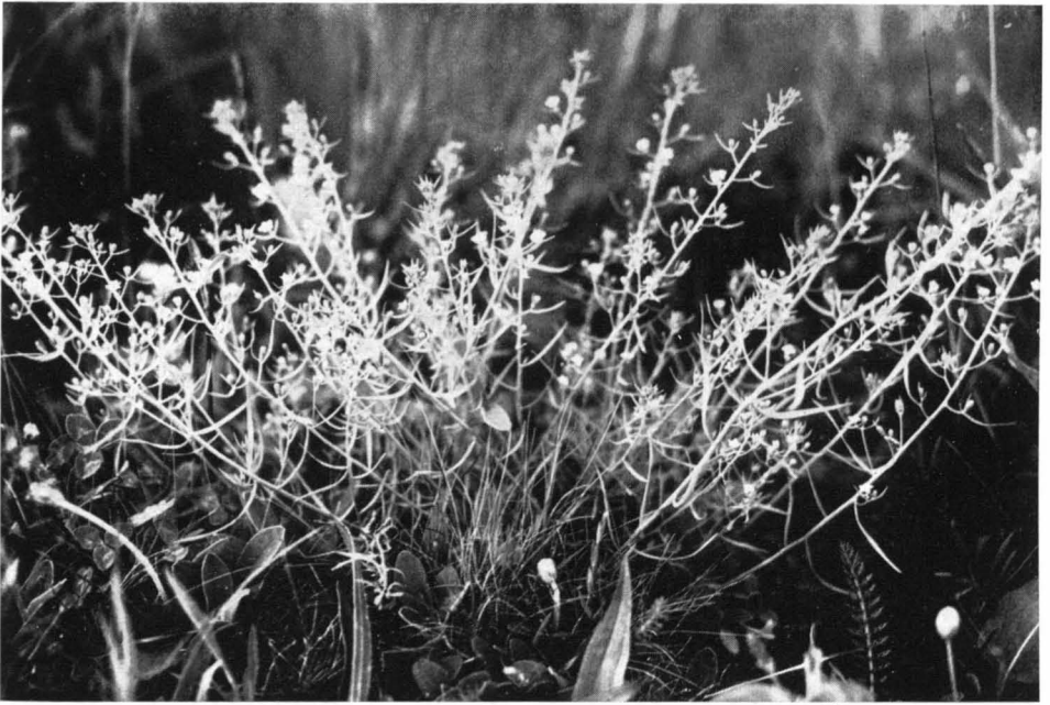
Bild 5 Wiesen-Leinblatt ( Thesium pyrenaicum ); \frac{1}{3} n. Gr. — Breungeshainer Heide (Vogelsberg), 8. Juni 1950.