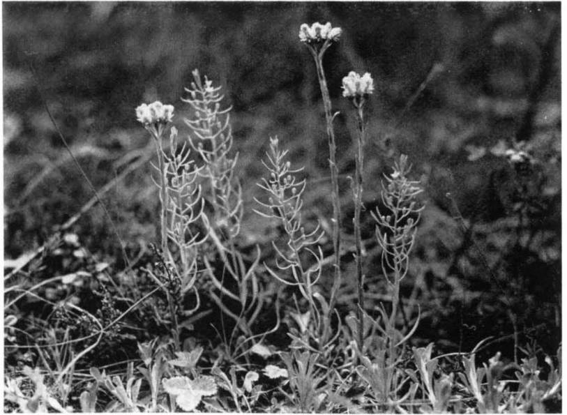
Bild 7 Tragblattloses Leinblatt ( Thesium ebracteatum ) neben Heidekraut ( Calluna vulgaris ) und Katzenpfötchen ( Antennaria dioica ); \frac{1}{3} n. Gr. — Dallnitzwald bei Lyck, 24. Mai 1936.