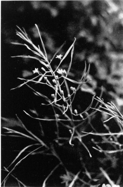
Bild 8 Tragblattloses Leinblatt ( Thesium ebracteatum ); \frac{4}{5} n. Gr. — Dallnitzwald bei Lyck, 24. Mai 1936.