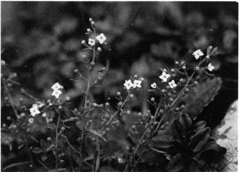
Bild 2 Alpen-Leinblatt ( Thesium alpinum ) über dem Laub von Sonnenröschen ( Helianthemum nummularium ) und Drachenmaul ( Horminum pyrenaicum ); \frac{1}{1} n. Gr. — Königssee-Alpen am Funtensee, 12. Juli 1936.