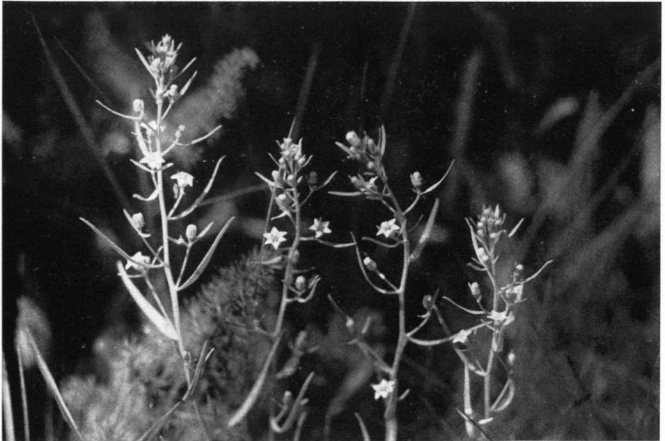
Bild 6 Wiesen-Leinblatt ( Thesium pyrenaicum ); im Hintergrund die fein zerschlitzten Blätter der Haar-Bärwurz ( Meum athamanticum ); \frac{1}{1} n. Gr. — Oberes Bärenatal (Feldberg im Schwarzwald), 3. Juli 1934.