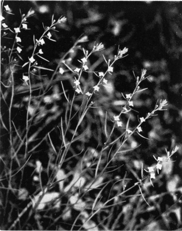
Bild 1 Alpen-Leinblatt ( Thesium alpinum ); \frac{1}{2} n. Gr. — Bad Kreuth (Obb.), 11. Juni 1952