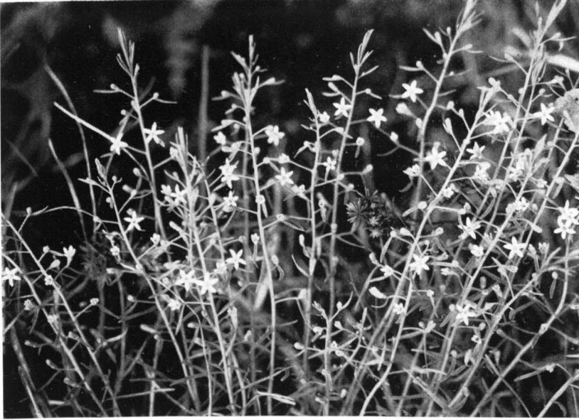
Bild 3 Schnabelfrüchtiges Leinblatt ( Thesium rostratum ); \frac{1}{2} n. Gr. — Bad Kreuth (Obb.), 11. Juni 1952.