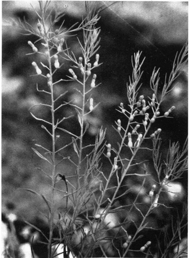
Bild 4 Schnabelfrüchtiges Leinblatt ( Thesium rostratum ) mit reifen Früchten; \frac{2}{3} n. Gr. Linderries bei Schloß Linderhof (Obb.), 5. Juli 1951.