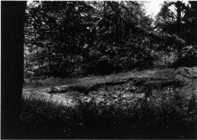
Abb. 7 Schürfloch am Silberberg 10 km südwestlich von Osnabrück