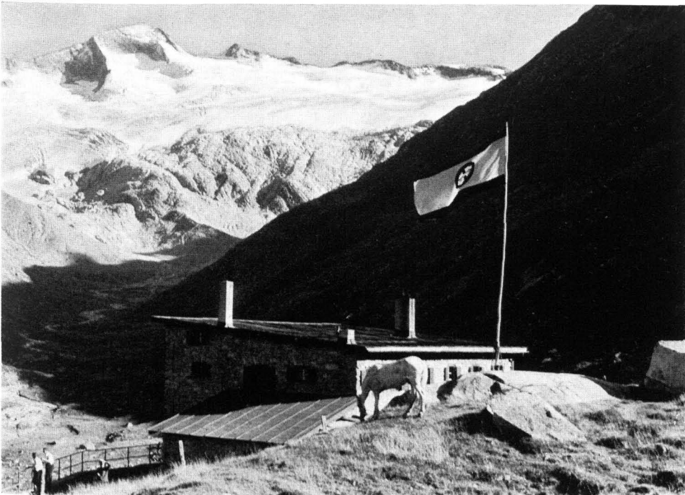
Abb. 2 Osnabrücker Hütte (2040 m) mit Hochalm Spitze (3360 m)