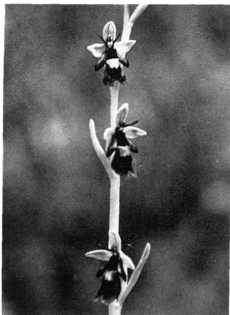
Abb. 14 Fliegenorchis ( Ophrys insectifera ); \frac{1}{1} nat. Gr.