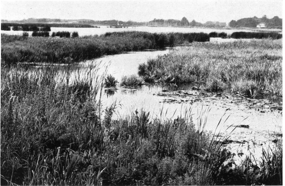
Abb. 3 Naturschutzgebiet am Dümmer — Hunteausfluß — 35 km nördlich Osnabrück — Besonderer Schutz gilt der Vogelwelt, die hier in über 100 Arten brütet. —