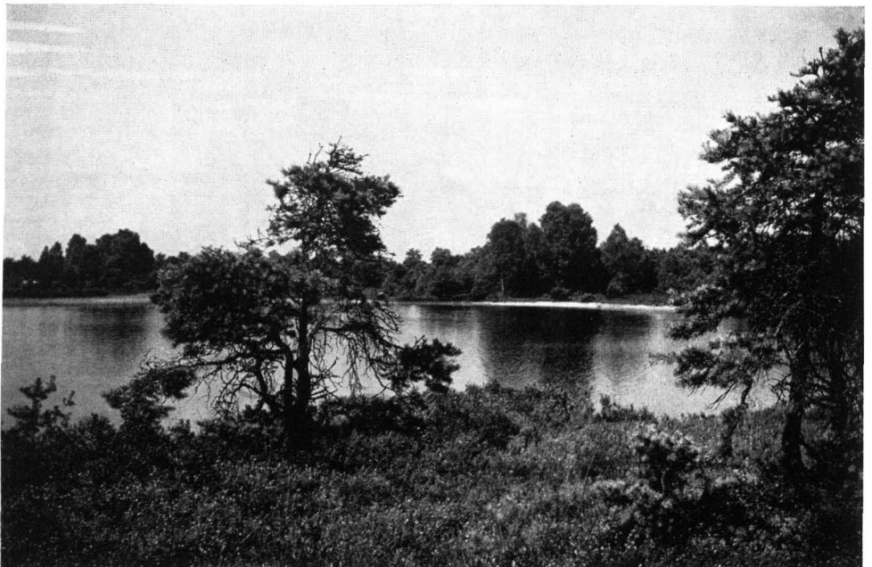
Abb. 4 Naturschutzgebiet Heiliges Meer — Erdfallsee — 40 km westlich Osnabrück