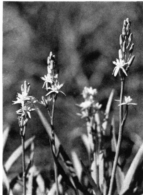
Abb. 11 Moorlilie ( Narthecium ossifragum ); \frac{1}{2} nat. Gr.

Aufnahmen: Abb. 10 und 11 Dr. Georg Eberle, Wetzlar