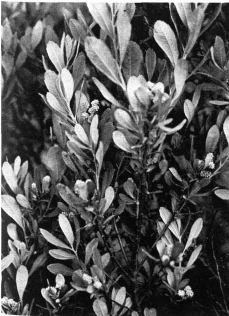
Abb. 10 Gagel ( Myrica gale ); \frac{1}{3} nat. Gr.