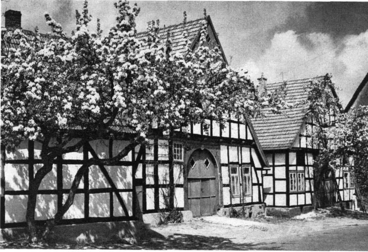
Abb. 9 Fachwerkhäuser in Bad Essen am Wiehengebirge — 25 km östlich von Osnabrück