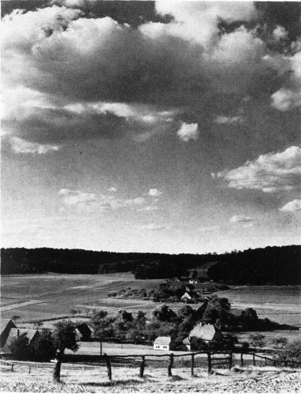
Abb. 5 Himbergen, Bauerschaft am Stockumer Berg, 131 m (Teutoburger Wald) — 15 km südöstlich Osnabrück