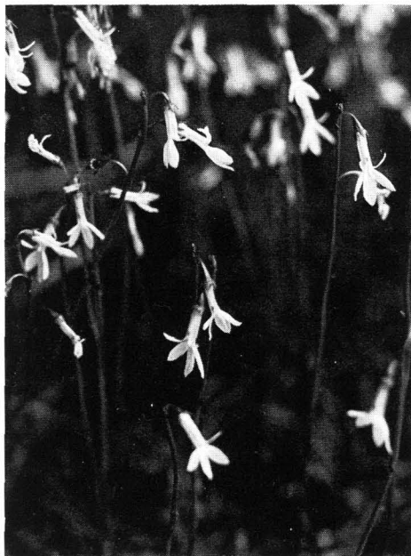
Abb. 12 Lobelie ( Lobelia dortmanna ); \frac{1}{2} nat. Gr.