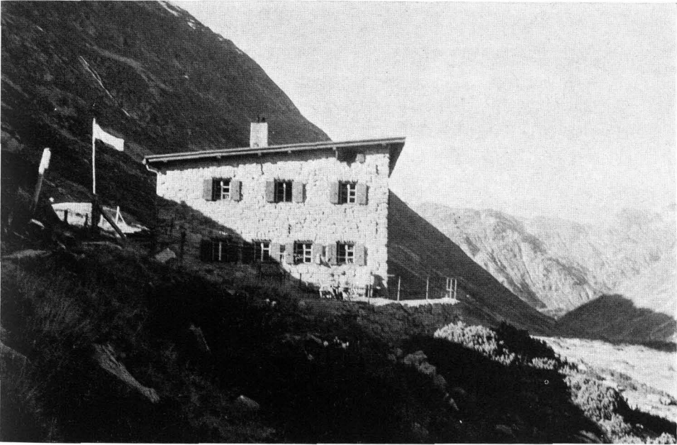
Abb. 1 Osnabrücker Hütte (2040 m) mit Blick gegen Anstieg talauswärts