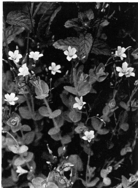
Abb. 13 Sumpf-Hartheu ( Hypericum elodes ); \frac{1}{2} nat. Gr.