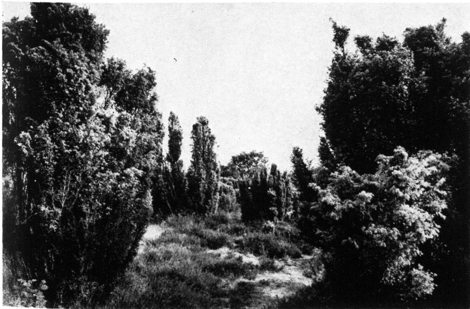
Abb. 6 Naturschutzgebiet Haselünner Kuhweide — 60 km nordwestlich Osnabrück