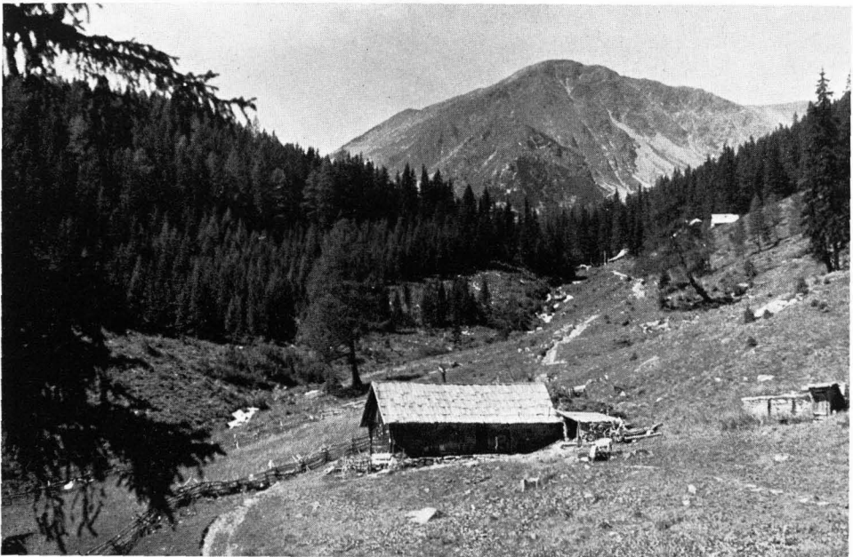
Abb. 6 Stubalm mit Hochreichart: Waldweide, (Hochreichart-Schutzhaus r. o. am Waldrand).