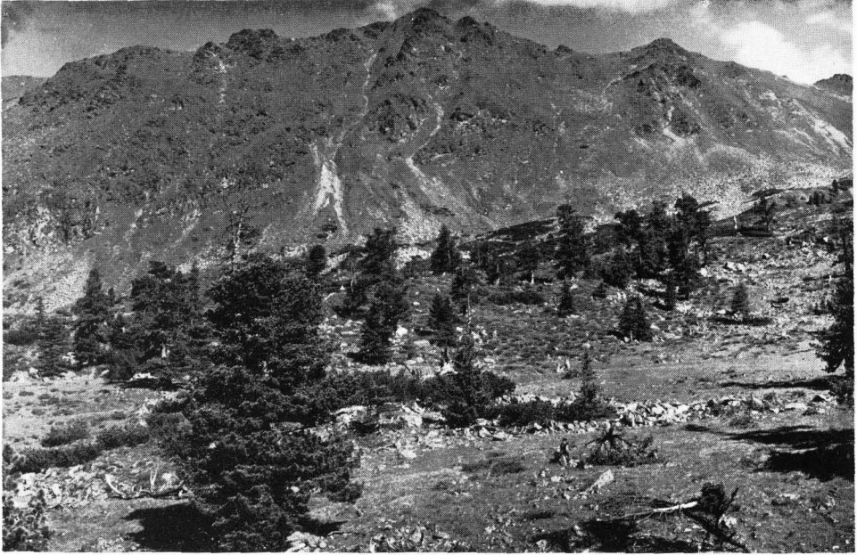
Abb. 10 Stubalmkar mit Hefenbrecher, subalpine Übergangs-Strauchstufe: Pinetum mughi , Rhodoretum ferruginei , Nardetum .