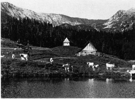
Abb. 7 Weinmeisterboden: obere Waldzone, die „Schwarzlacken“ mit der „Oberen Bodenbütte“ (Halterbütte), 1619 m M. H., Waldweidegebiet.