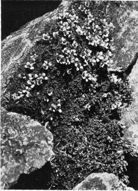
Abb. 4 Wimper-Steinbrech: ( Saxifraga blepharophylla ).