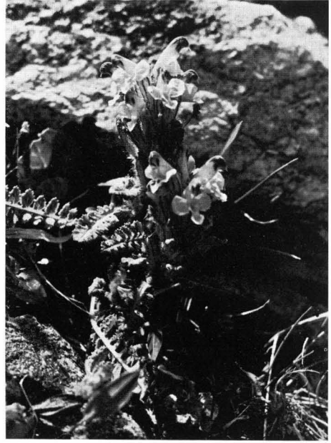
Abb. 2 Oeder's Läusekraut: (Pedicularis oederi).