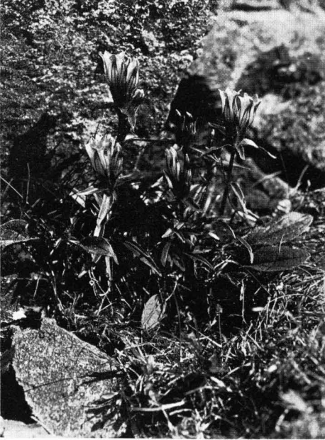
Abb. 1 Kälte-Enzian: (Gentiana frigida).