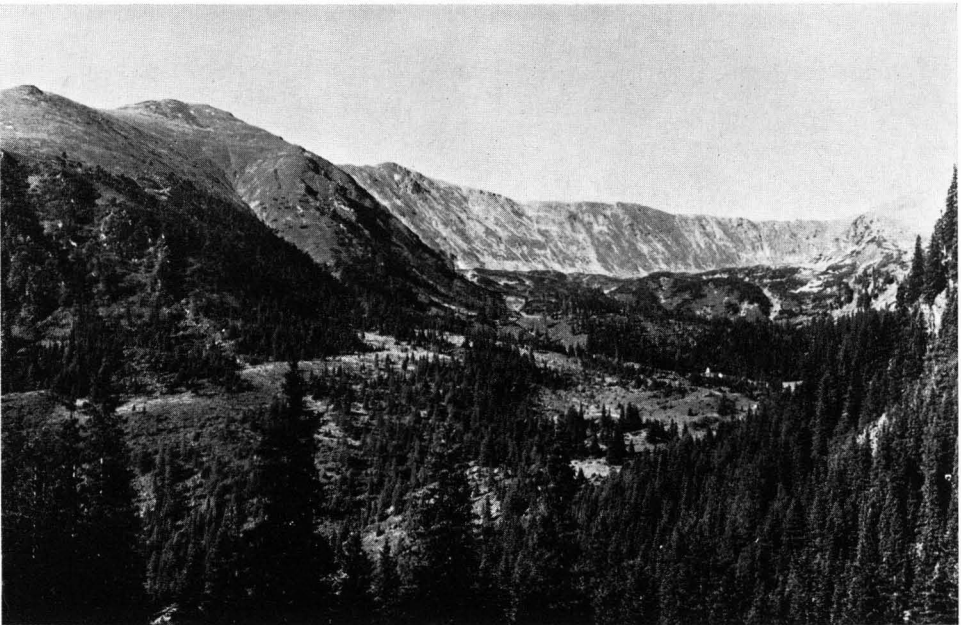
Abb. 3 Weinmeisterboden: Vegetationsstufen.