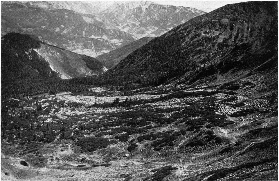
Abb. 11 Stubalmkar: Blockhalden mit Krummholz-Bewuchs.