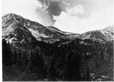
Abb. 8 Hochreichart, Blick in das Reichartkar (auch „Reichartloch“), rechts Anstieg zum Kleinreichart: Vegetationsstufen.