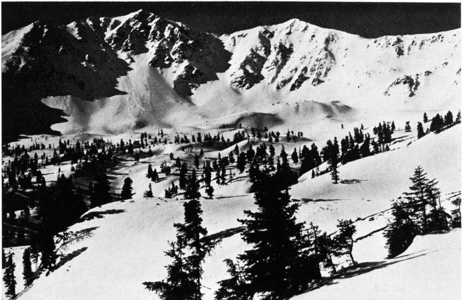
Abb. 9 Gotstal-Kessel mit den N-Abstürzen des Seckauer Zinken: „Alpine Parklandschaft“ und obere Baumgrenze im Karhintergrund.