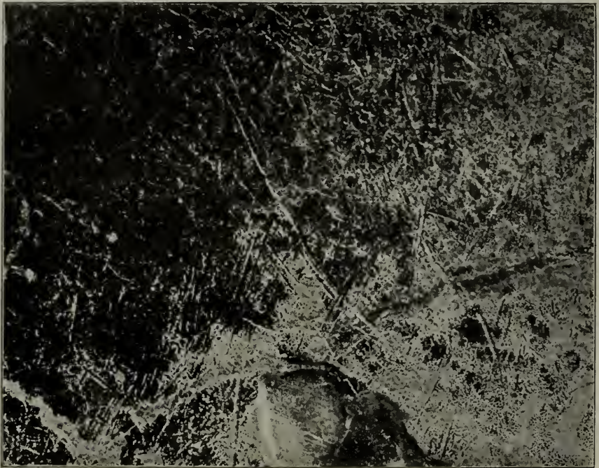
Glasscherben aus den Dünen von Coxyde in Belgien mit Sanderosionen.