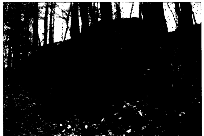
Abb. 2: Metagabbro mit Nebengesteinseinschlüssen (Intrusionsbrekzie) neben Parkplatz 400 m südlich Schallaburg.

Im Wald neben dem südlichsten Parkplatz etwa 400 m südlich der Schallaburg liegen mehrere Blöcke eines ungleichkörnigen bis porphyrischen Metagabbros. Das Besondere sind Einschlüsse von cm bis mehrere