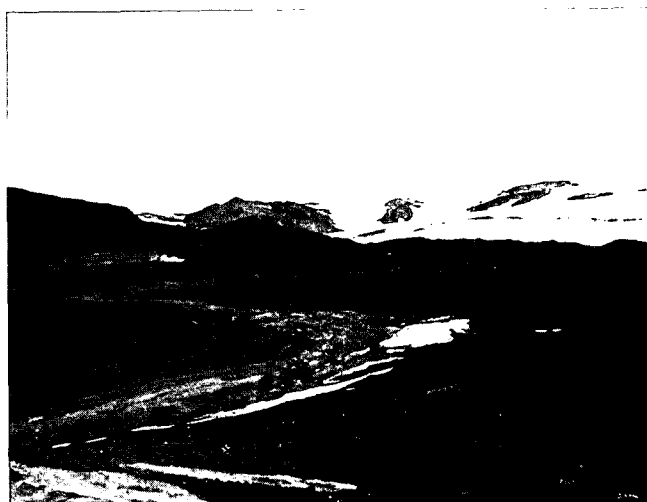
Abb. 3: Blick vom NE-Ende des Langasker über den östlichen Quellfluß der Djúpá hinweg auf die Landzunge mit dem Schlackenkegel Eldgigur (in der Bildmitte). Im Hintergrund die Randgebiete des Vatnajökull (Photo K. JAKSCH, 22. Juli 1981).