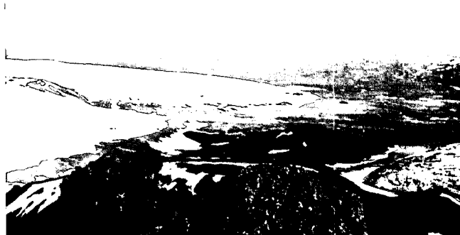
Abb. 2: Blick vom Berg Hágöngur nach Südosten auf die Landzunge mit dem Eldgigur. Im Bild rechts die steile „Vorstoßfront“ des südlich der Hágöngur sich ausbreitenden Gletschers. Links die beiden an der Ostseite der Landzunge gelegenen Eislappen, die unmittelbar an die Endmoräne heranreichen. Weiter entfernte Moränen von historischen Gletscherständen fehlen. Vor dem südlichen Eislappen erhebt sich der ca. 15 m hohe „Pseudokrater“ aus dem Sander.

Das Gletschervorfeld des südwestlichen Vatnajökull, von dem im folgenden berichtet wird, ist über die rechte (westliche) Talseite der Djúpá noch relativ leicht zu erreichen, wobei vom Gehöft Kálfafell bis zum Gletscher 20 km, meist weglos, zurückzulegen sind. Hier am Sidujökull finden seit 1964 Gletschermessungen statt. Weder Lava (örtlich als „Fossahraun“ bezeichnet), die im gletschernäheren Teil des Vorfeldes von Moränen