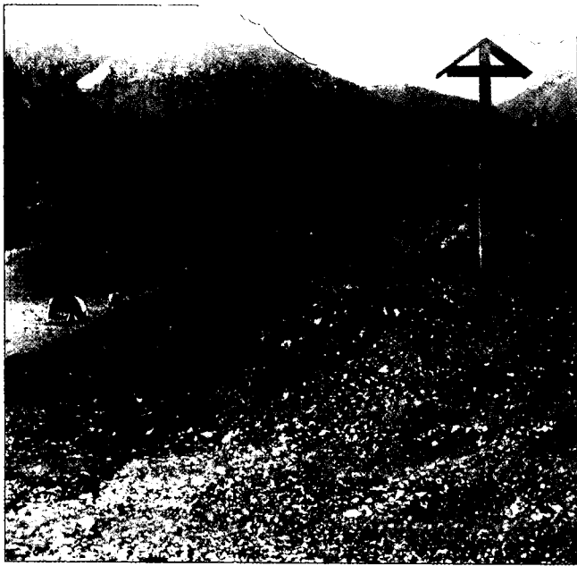
Abb. 1. Tomahügel des Fernpaßbergsturzes W der Schmitte mit Blickrichtung SE.

(1901) den Begriff „Tomalandschaft“ auch für die symmetrisch geformten Hügel des Fernpaßbergsturzes. Interessanterweise lautet die Lokalbezeichnung für diese Hügel im Ehrwalder Talkessel „Duma Bichl“, was man mit „Toma Hügel“ übersetzen kann.